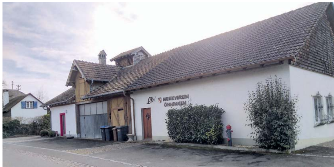
Das alte Öhninger Feuerwehrhaus soll zum Haus der Musik werden.

Spannend für die Öhninger Bürger war vor allem die Vorstellung der Jahresrechnung 2018. Im Jahresverlauf zeichneten sich positive Entwicklungen ab, wie zum Beispiel bei der Kreisumlage, aber insbesondere auch bei der Gewerbesteuer. Die gesamtwirtschaftliche Entwicklung verlief erneut besser als zum Zeitpunkt der vergange-