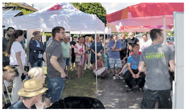
Die Planungen für den neuen Stahringer Dorfplatz wurden im Rahmen eines Bürgerworkshops verfeinert.

Seit zwei Jahren setzt die Stadt verstärkt auf Bürgerbeteiligung / von Dominique Hahn