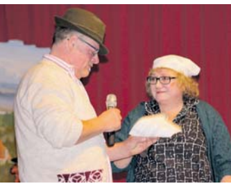
Ein buntes Programm hat der NV Welsbart vorbereitet.