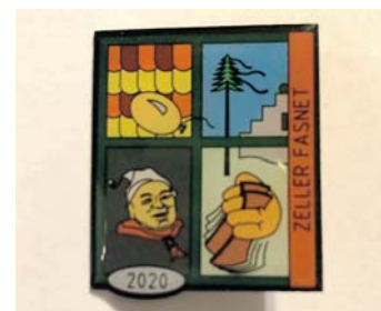
Die Jahresbrosche hat sich vom einfachen »Bleche« zum wahren Sammlerstück entwickelt. Sie dient der Finanzierung der Straßenfasnacht.

An diesem Samstag können dann in der roten Tonne auch zum letzten Mal Karten für die Narrenspiegel-Veranstaltungen im Vorverkauf erworben wer-