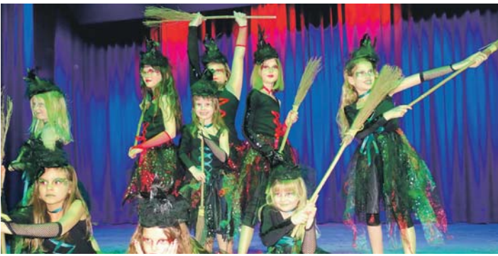
Die jungen Alt-Stockacherinnen rührten beim Damenkaffee ihr Hexensüppchen an.

Testosteron hatte hier (so gut wie) nichts zu suchen: Beim 30. Damenkaffee der Alt-Stockacherinnen im Bürgerhaus »Adler-Post« war die Weiblichkeit unter sich – die Musiker der »Buggy Band« mal ausgenommen.