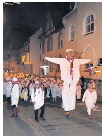
Zum Auftakt in die Fastnacht pilgern viele Menschen aus der ganzen Umgebung zum Radolfzeller Hemdglonkerumzug. Hier zeigt sich immer wieder, dass sich Brauchtum und Party gut vereinen lassen.