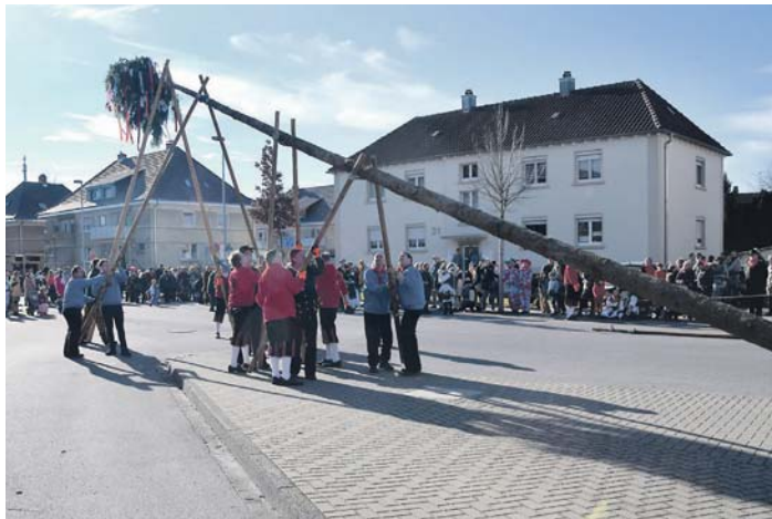
Mit vereinten Kräften aus allen Untergruppierungen wurde wieder der Narrenbaum der Froschen aufgestellt.

Fast eine Woche war Radolfzell wieder in der Hand der Narren, die mit vielen gelungenen Veranstaltungen Tradition und Party vereinten und für ein buntes Programm sorgten. Durchwachsener als im letzten Jahr fällt indes das Fazit der Polizei aus.