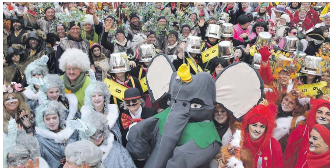
Bunt war sie, die Zeller Fasnet. Beim großen Sonntagsumzug waren 48 Gruppen mit von der Partie mit insgesamt fast 2.000 Teilnehmerinnen und Teilnehmern. Die schönsten Verkleidungen wurden auch in diesem Jahr wieder prämiert. Das Bild zeigt die Gruppen nach der Prämierung auf dem Marktplatz.