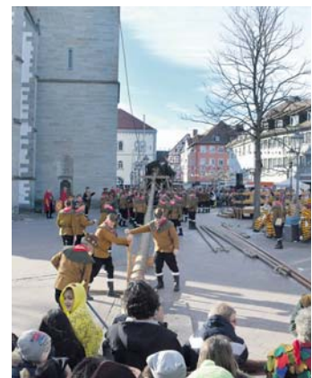
Routiniert lief das Stellen des Narrenbaumes bei den Holzhausern der Narrizella (Bild oben). Am Schmutzigen Dunschtig heizte die Froschenkapelle nach dem Rathaussturm die Menge auf dem Marktplatz ein. (Bild unten).