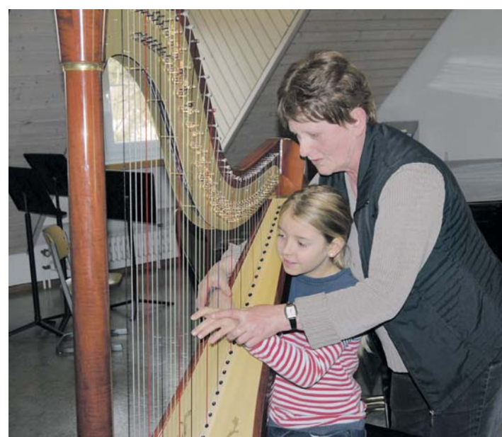
Ein außergewöhnliches Instrument, welches aktuell etwas aus seinem Nischendasein herauskommt, die Harfe. Auch diese kann in der Singener Jugendmusikschule erlernt werden.