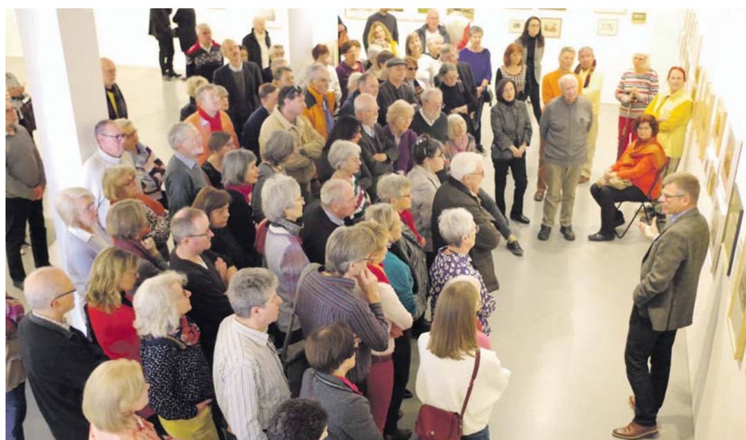
Viele spannende Details und Geschichten über die Bilder des Singener Hausbergs aus mehreren Jahrhunderten konnte der Museumsleiter den Gästen der Finissage im Kunstmuseum verraten. sub-Bild: of

Die Ausstellung »Der Twiel im Blick« im Singener Kunstmuseum, die mit über 200 Exponaten aus der Sammlung des Kunstmuseums, von Kunstfreunden beidseits der Grenze wie aus dem Singener Stadtarchiv mit Ansichten des Singener Hausbergs bestückt wurde, ist der große Renner geworden. Sehr stark sei sie von Besuchern nachgefragt worden und viele seien sogar mehrmals gekommen, gab es auf der Finissage am Sonntag zu erfahren. Vor allem lockte die Bilderschau viele neue Besucher ins Museum, ist die erste Bilanz für die Ausstellung, die durch die Kooperation mit dem Stadtarchiv auch für das Kunstmuseum eine Premiere darstellte. Die angekündigten Kunstspaziergänge zum Abschluss waren eine »One-Man-Show«. Weil die Leiterin des Stadtarchivs, Britta Panzer, krank-