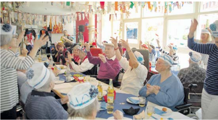
Mit einer »lustige Schifffahrt« wurde am Donnerstag und Freitag die Fastnacht im Pflegezentrum St. Verena gefeiert.