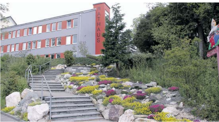
Der Gemeinderat tagte im Rathaus.