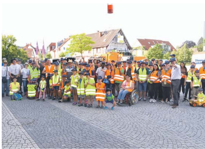
Die Stadtputzete »Singen macht sauber« wird 2020 in der Südstadt fortgesetzt.