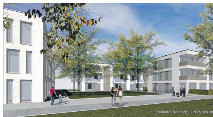
önnte die neue Mitte im Singener Ortsteil Beuren laut des Investors der KopfGruppe aussehen.