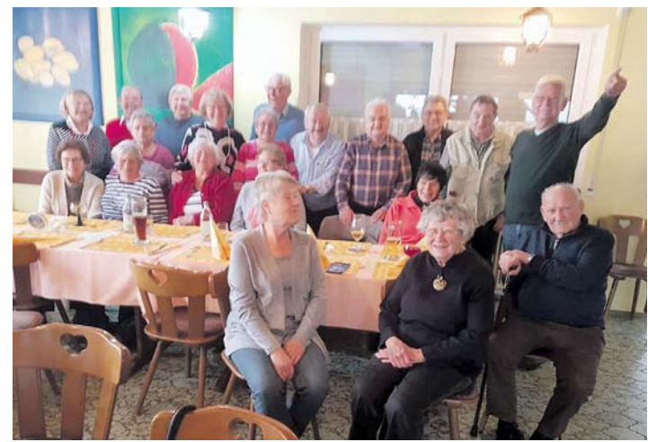
Bei der letzten Mitgliederversammlung des Fidelio.