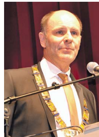
Oberbürgermeister Bernd Häusler. sub-Bild: of

Dies betrifft vor allem das Rathaus, das Bürgerzentrum, die Ausländerbehörde, das Blaue Haus in der Freiheitstraße, die Stadthalle, das Integrationshaus, die städtischen Einrich-