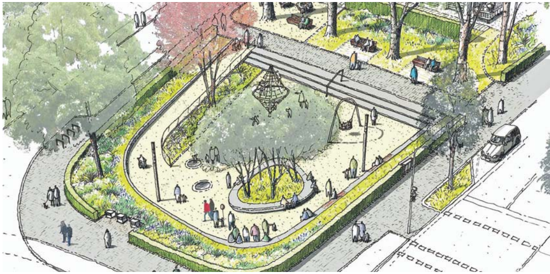
So soll nach den Plänen der Kreuzensteinplatz einmal aussehen.

Die Diskussion um den Kreuzensteinplatz in der östlichen Innenstadt dauert schon Jahre. Kurz vor der Ziellinie wurde allerdings in den Haushaltsplanungen im Februar nochmals die Schranke heruntergelassen als es um die Kosten ging – auch von den Grünen. Deshalb war das weitere Fortgehen mit einem Sperrvermerk versehen, bis auch die endgültige Planung vorgestellt und absegnet wurde. Nun gab es im Ausschuss für die Stadtplanung eine mehrheitliche Empfehlung zur Zustimmung. Stadtsanierer Tilo Brügel warb vor der Diskussion für die Neugestaltung des derzeit sozusagen brachliegenden Platzes an der Ecke Ekehard-/Kreuzensteinstraße. Landschaftsarchitekt Thomas Gnädinger hatte sich mit mehreren Entwürfen bis zum jetzi-