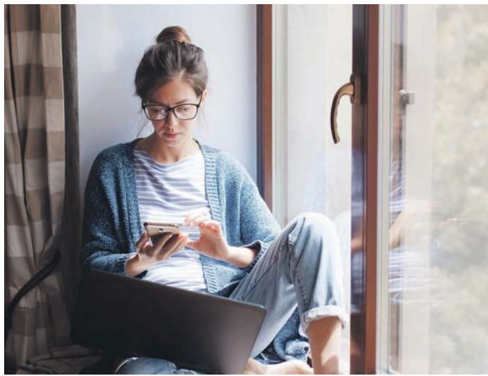
Soziale Kontakte via digitaler Medien pflegen ist in Zeiten der Co- rona-Krise mit ihren Ausgangsbeschränkungen besonders wichtig.