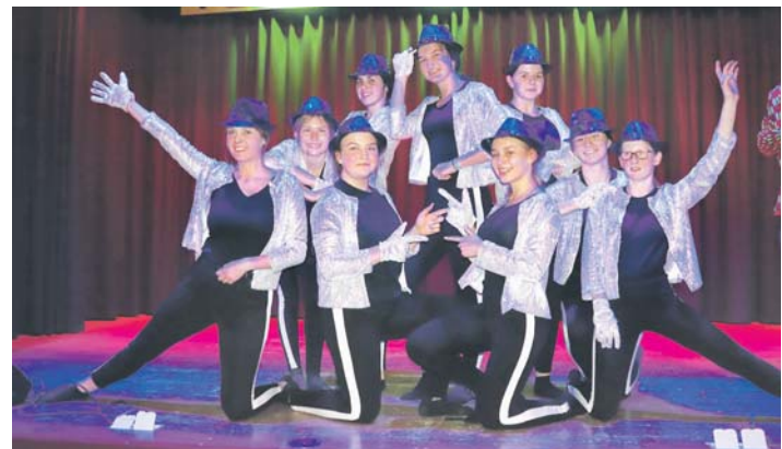
Die Jung-Alt-Stockacherinnen begeisterten beim Fasneteröffnen des Narrengerichts Stockach mit ihrer Tanzeinlage.