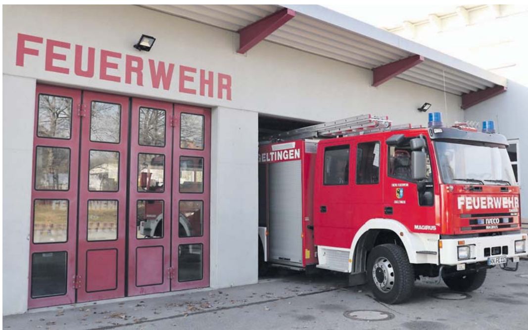
Die Abteilung Eigeltingen der Feuerwehr gehört mit zu den Nutznießern des Feuerwehrbedarfsplans, der im Gemeinderat vorgestellt wurde. In allen Abteilungen sind Mängel vorhanden.

Im Eigeltinger Gemeinderat wurde der aktuelle Feuerwehrbedarfsplan für die Wehren der Flächengemeinde vorgestellt. Als Probleme zeigten sich die Trennung der Einsatzkleidung von der Zivilkleidung der Wehrleute und die Notwendigkeit eines neuen Gerätewagens.