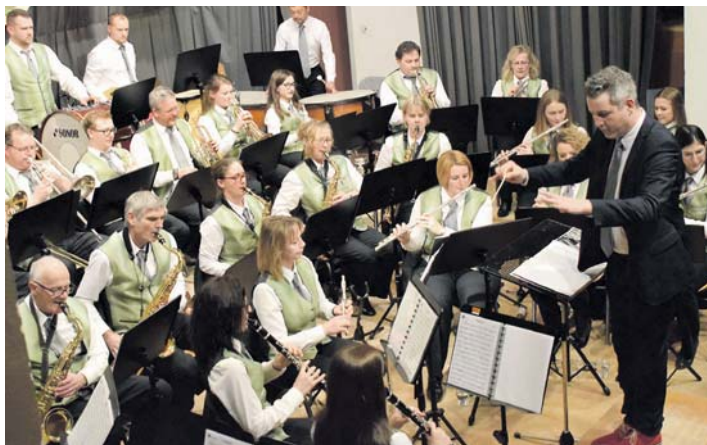
Zur Eröffnung der Spielsaison präsentierte der MV Öhningen in der Mehrzweckhalle ein konzertantes Klangfarbenspiel.

Die ersten dreißig Minuten gehörten der Jugendmusikschule der Halbinsel. Die Jungbläser der sechs Orchester in der Höri präsentierten ihr Klangfarbenspiel mit den Farben Weiß, Blau und Rot. Zum Auftakt, die senkrechte Variante (Russland) und das Stück »Troika Fantasy«. Die jungen Musiker erzählten Russlands Geschichte mit seinen Sagen, Märchen und Abenteuergeschichten. Die Farben horizontal ergaben mehrere Variationen vom französischen Volkslied »au claire de la lune« und zum Schluss die