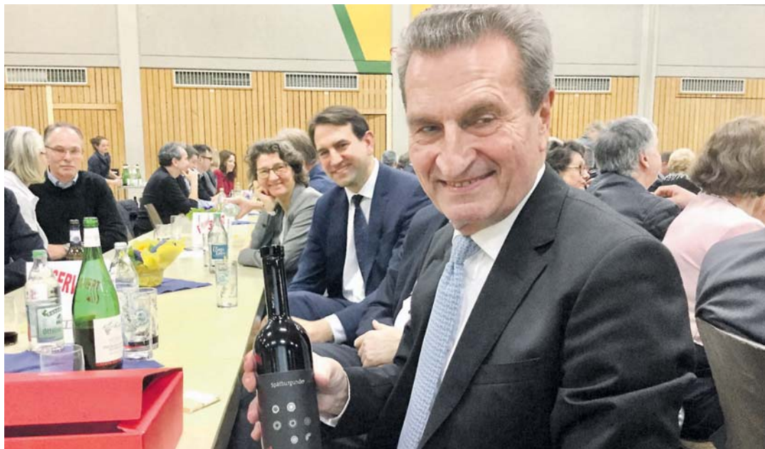
Günther Oettinger wurde nach seiner Rede mit einem flüssigen Präsent beschenkt.