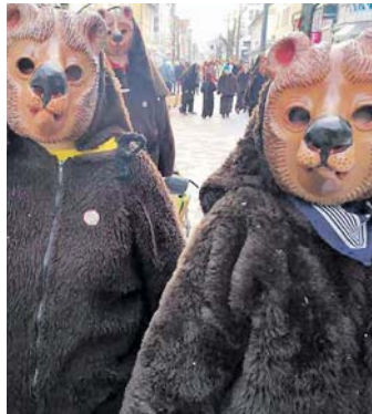
Die Narrenvereinigung Steinbühlbären Rorgenwies startete mit ihrer Dreikönigssitzung in die närrische Zeit.

Der Narrenverein Steinbühlbären Rorgenwies e.V. präsentierte bei seiner Dreikönigssitzung die Planung der Fasnetsaison 2020.