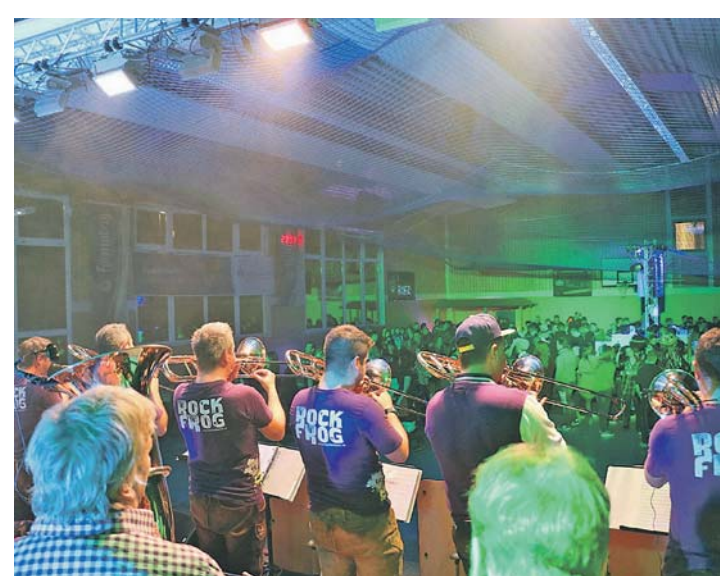
Die Besucher erlebten ein Programm mit Gruppen von Nah und Fern.

Das Jubiläumswochenende war für die Guggenmusik der Höhepunkt der diesjährigen Fasnachtssaison. Die Schtägge-Näschter aus Honstetten feierten ihren 25-jährigen Geburtstag in der gut besuchten Hochbuchhalle in Heudorf im Hegau. Am Freitagabend läutete die Froschenkapelle aus Radolfzell das Festwochenende ein und brachte eine großartige Stimmung in die Halle. Die Musikgruppe umrahmte auch das gesamte Programm. Die Guggenmusik Pille Palle aus Liggersdorf zeigte mit einem stimmungsvollen Programm ihr Können. Die Lumpenkapelle Löwenzahn aus Salem war das dritte Highlight und zeigte, wie sehr sie die Instrumente beherrscht. Die gute Laune und Stimmung der Gäste war zu spüren.