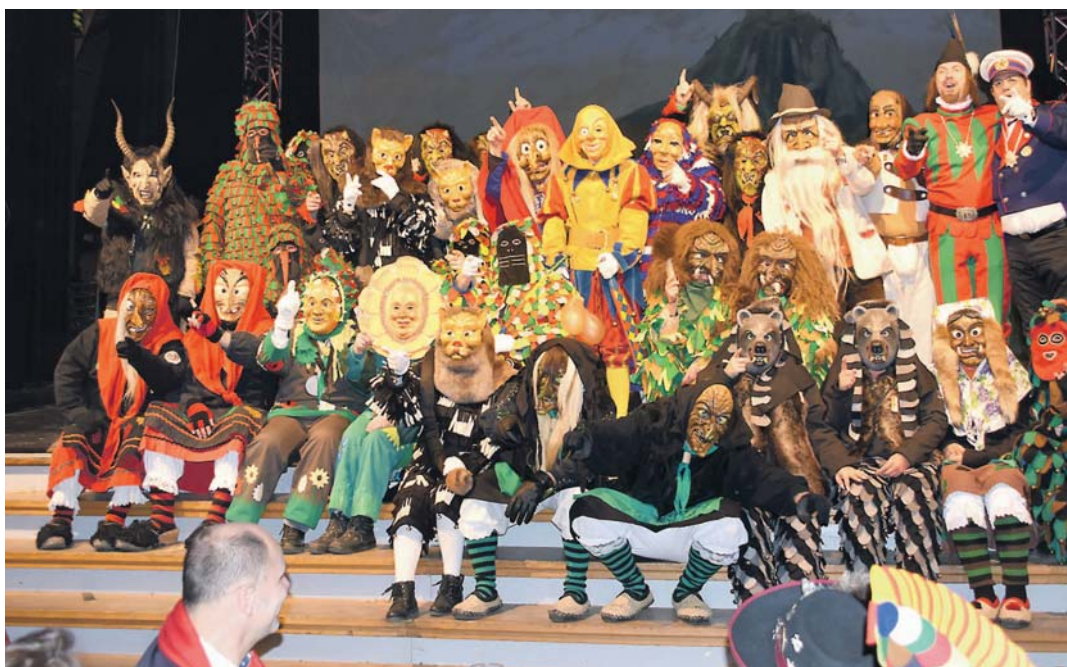
Krönender Abschluss der VSAN-Hauptversammlung: Beim Finale der »Singemer Fasnetnacht« präsentierten sich alle Singener Zünfte auf der Bühne der Scheffelhalle.

Die Fasnet in Singen ist schön – davon konnten sich die 68 Mitgliedszünfte und sieben befreundete Zünfte der Vereinigung Schwäbisch Alemannischer Narrenzünfte (VSAN) bei ihrer Hauptversammlung am Samstag überzeugen. Denn die ausrichtende Poppele-Zunft bereitete ihren Gästen aus der Region von Wangen bis Offenburg und Cannstatt bis in die Schweiz einen wahrlich herzlichen und sehenswerten Empfang.