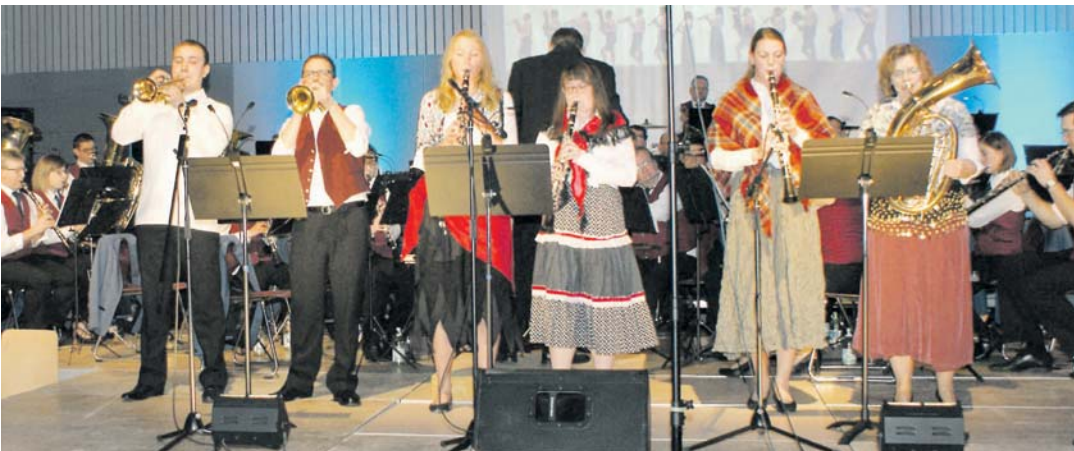
Im passenden Outfit traten die Musikerinnen und Musiker zum »Zigeunermarsch« an.