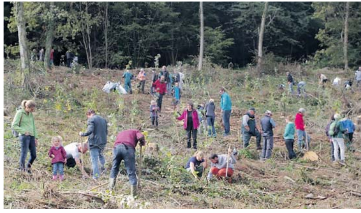
Mitmachen bei der Baumpflanzaktion am 14. März.

Auch die Stadt Aach beteiligt sich am Samstag, 14. März, ab 10 Uhr an der Aktion des Gemeindetages Baden-Württemberg, bei dem 1.000 Gemeinden je 1.000 Bäume pflanzen. Aach hat hierfür 600 Bergahorn, 200 Winterlinden, 200 Kirschbäume und 100 Douglasien, zusammen 1.100 Bäume, aus einer Pflanzschule besorgt. Das heißt in