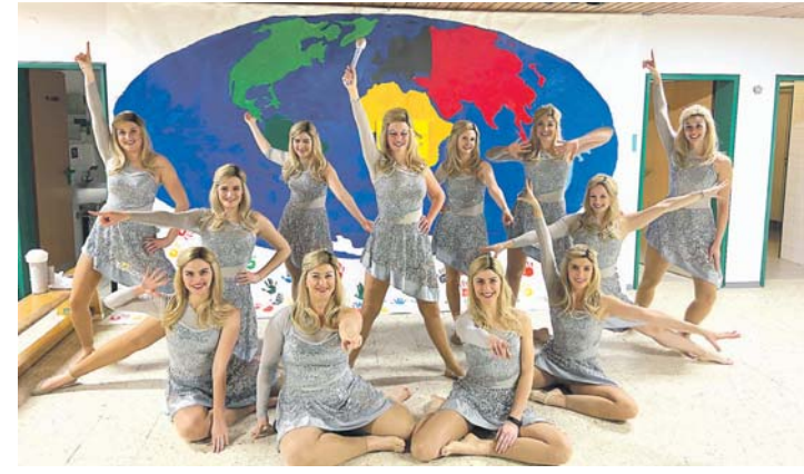
Zum Showtanz lädt der VfB Randegg ein.