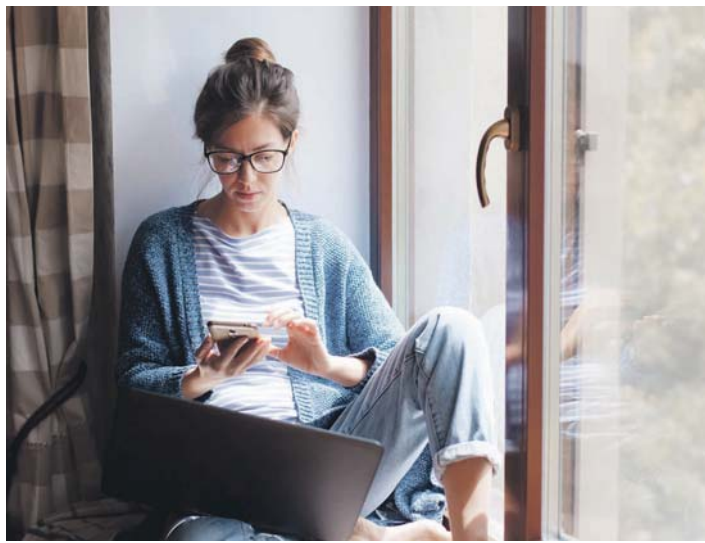
Soziale Kontakte via digitaler Medien pflegen ist in Zeiten der Co- rona-Krise mit ihren Ausgangsbeschränkungen besonders wichtig.