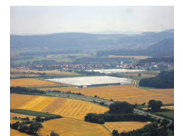
Noch nördlicher von Singen liegt der zweite Standort, den die Stadt für das geplante Kreisklinikum vorschlägt.

Demnach hat die Stadt Singen neben dem bekannten Standort unterhalb des Baugebiets Reckholderbühl nun auch ein Grundstück bei Singen-Hausen/Schlatt unter Krähen neu angeboten. Zumindest die Bewerbung bestätigte die Pressestelle der Stadt Singen, für das weitere Verfahren ist die Auswahlkommission des Kreistags zuständig. Das neu in den Wettbewerb eingebrachte Grundstück gehört nur zum Teil der Stadt Singen und liegt in der Fläche