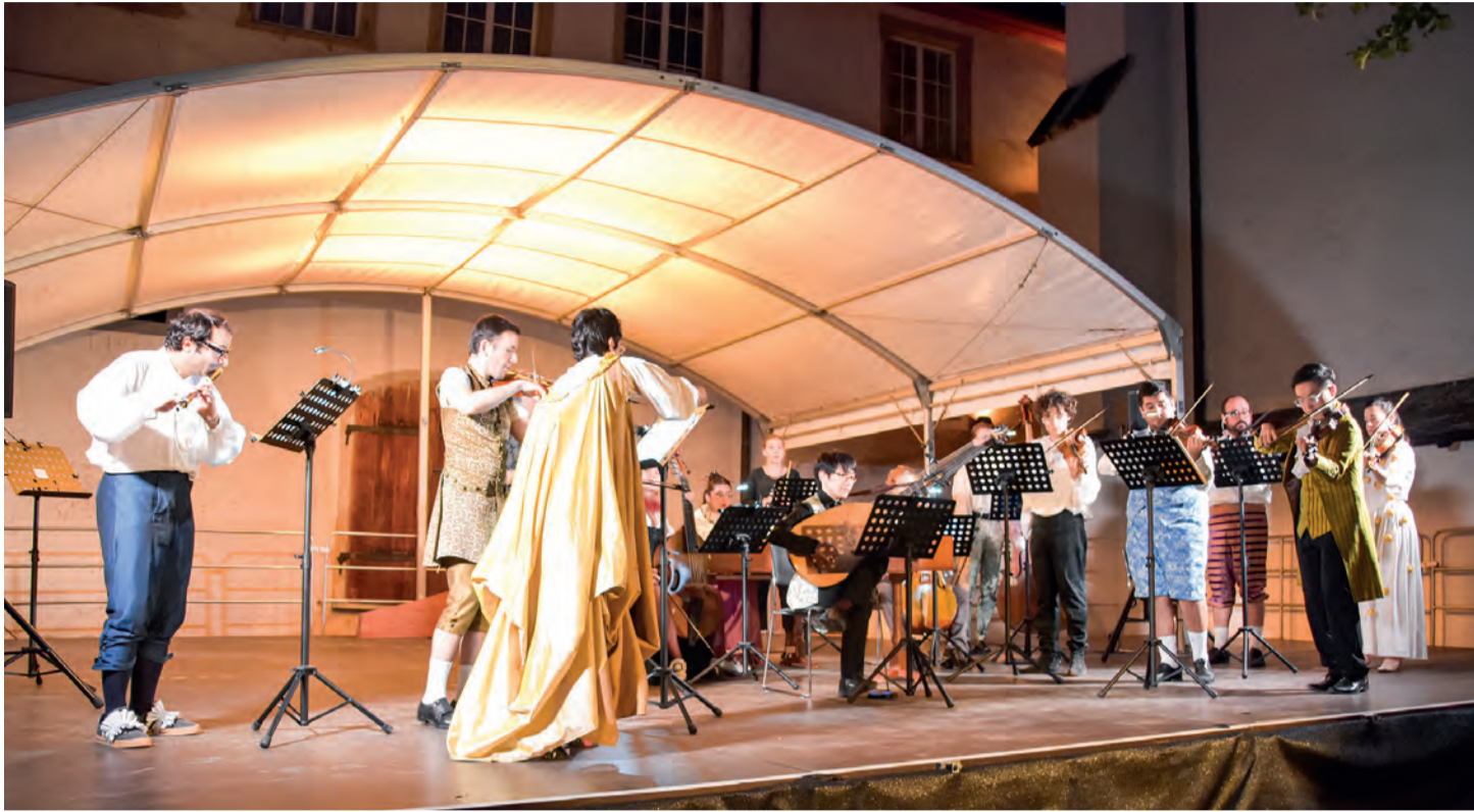
Das Barockorchester der Höri Musiktage bei der abschließenden „Conclusion“ im Hof des Chorherrenstifts.