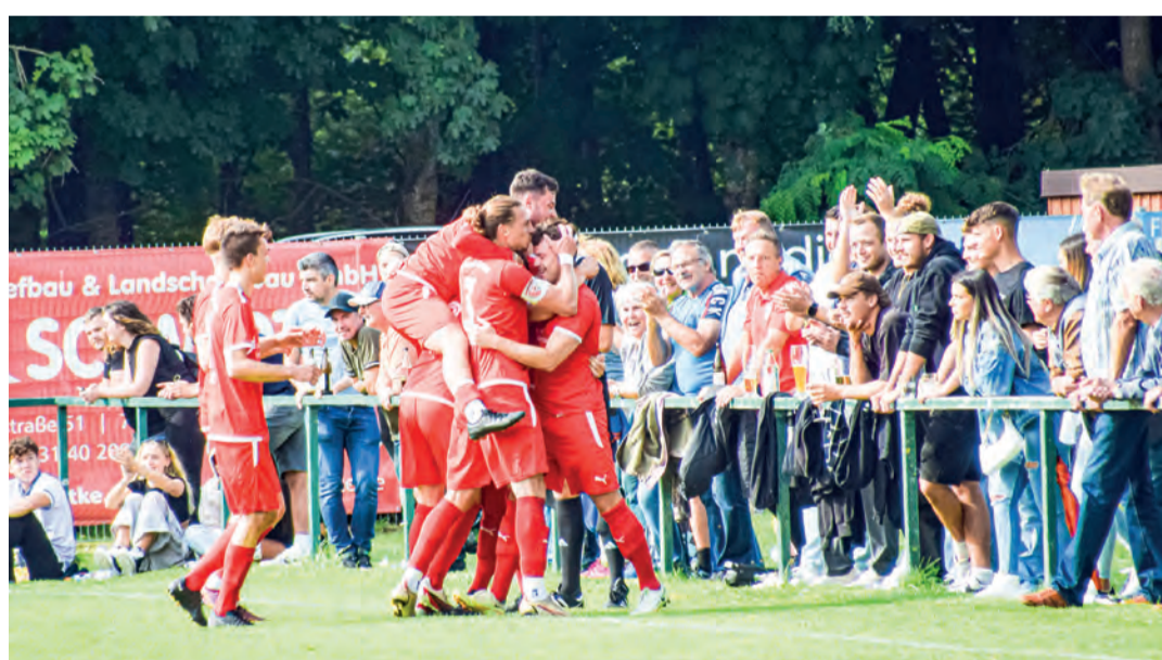
Jubel beim SC Gottmadingen-Bietingen nach dem 3:1 gegen den FC Singen.