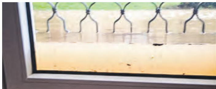
Ein Beispiel aus Arlen, wo nur das dichte Fenster einen größeren Schaden verhinderte.

Bauleitplanung eingeflossen ist. Ereignisse wie der verheerende Starkregen in Mühlhausen vor zwei Jahren sowie einige Starkregen in der eigenen Gemeinde machen nun auch hier ein Starkregenmanagement für die drei Teillorte nötig, wie in der letzten Sitzung des Gemeinderats herausgehoben wurde, auch wenn die Gemeinderäte zunächst eher skeptisch waren. Doch das Starkregenmanagement erfasste eben, was so an