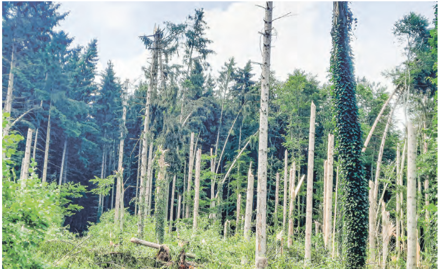
Nach dem jüngsten Sturm: Wie Zahnstocher wurden die Bäume im Wald von Liggeringen abgeknickt.