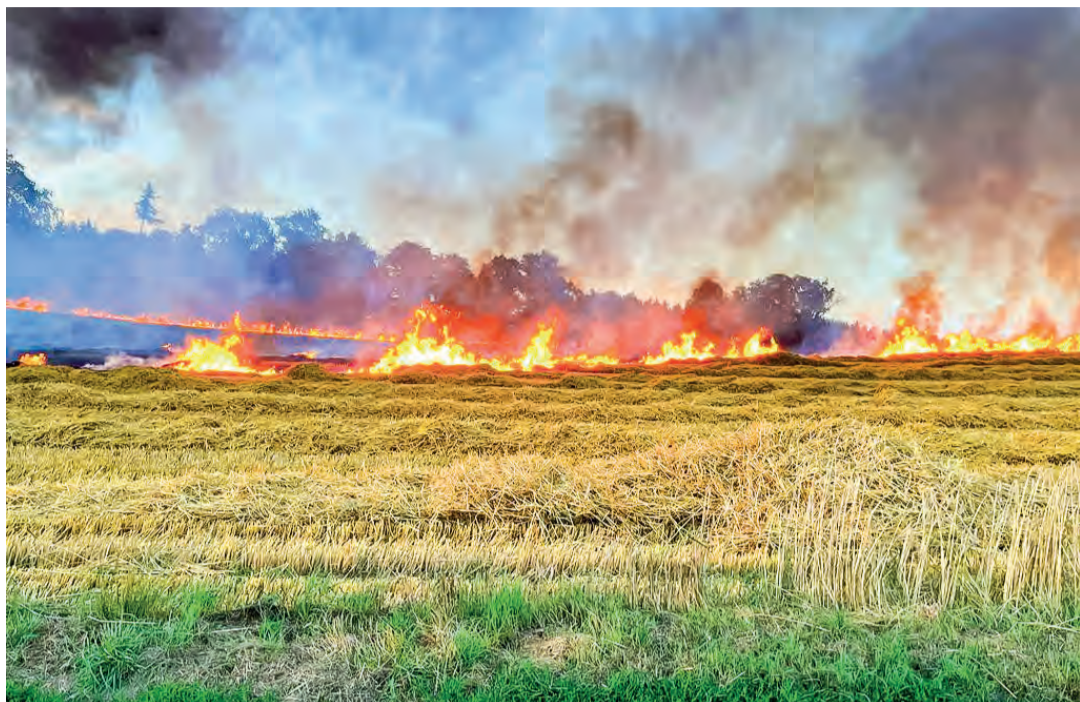
Fast zwei Hektar eines Weizenfeldes in Bietingen standen in Flammen. Die Freiwillige Feuerwehr Gottmadingen konnte ein Übergreifen auf ein Waldstück verhindern.