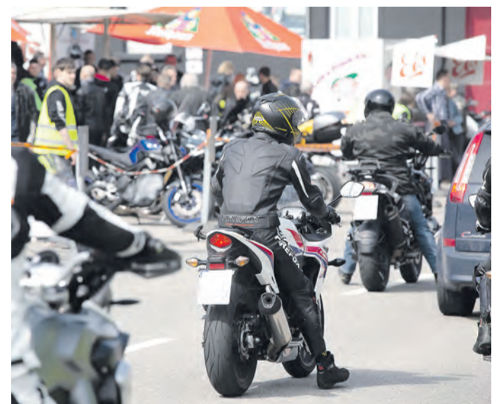
Saisonstartmesse 2019 – Ausfahrt und Ausstellung neuer Motorräder.

Zu den Highlights des Messewochenendes zählt die Präsenz namhafter Aussteller wie dem Enduro-Park Hechlingen, Touratech, GasGas, Hepco-Becker, Nice Bikes Company, Racetrack, Feelgood Reisen, Mizu, BGV und vielen mehr. Demnach ist für jeden Besucher etwas dabei – angefangen bei Motorrad-Ausrüstung über Renntraining-Anbieter und Lackierer hin zu Reisen und Ver-