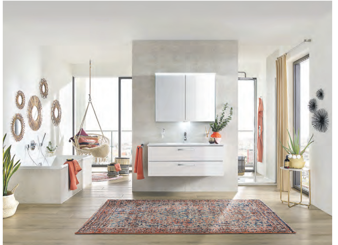
In enger Zusammenarbeit mit dem örtlichen Fachhandwerk bietet Pfeiffer & May den Kunden qualitativ hochwertige Produkte.

Im Jahr 1906 in Karlsruhe als kleines Eisenwarengeschäft gegründet, ist das in dritter Generation geführte Familienunternehmen Pfeiffer & May heute im Südwesten Deutschlands die Adresse für Bäder, Heizung und Haustechnik schlechthin. Seit über einem Jahrhundert kann sich die Firma mit ihrer steten Leistungsfähigkeit und absoluter Zuverlässigkeit am Markt behaupten. Die Philosophie des Unternehmens: An bewährten Traditionen festhalten und gleichzeitig Pioniergeist, Innovationstalent und Wagemut beweisen.