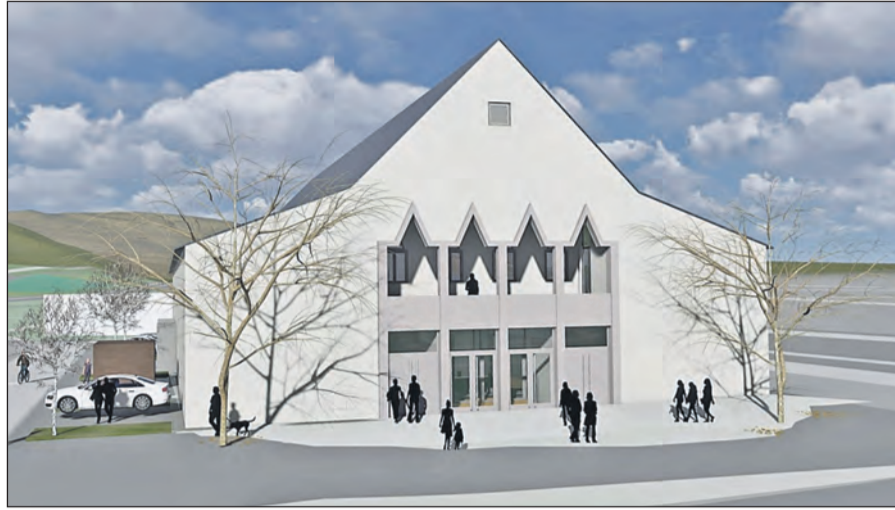
Planarstellungen der neuen Scheffelhalle in Singen: Links die Innenansicht mit Blick auf die Bühne, rechts die Ansicht vom Giebel mit Loggia.