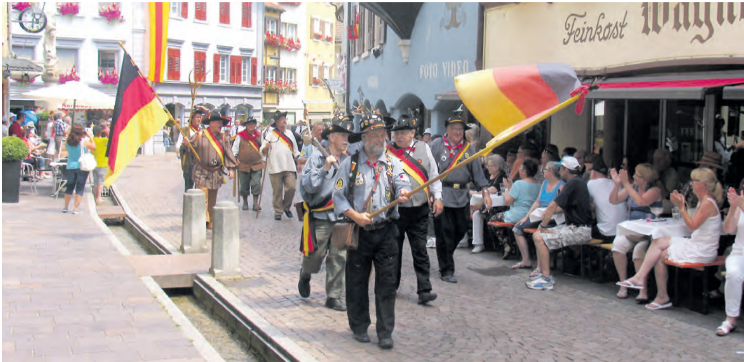
Die Heckergruppe aus Singen und dem Hegau bei einem früheren Umzug durch die Freiburger Altstadt. Sie gibt es im Jubiläumsjahr der badischen Revolution leider nicht mehr.

So ist es für die Region nun der Schwarzwaldverein, der das Jubiläumsjahr hier in Konstanz startet. Am 175. Jahrestag des Heckerzug-Starts gibt es einen revolutionären Aufbruch in Konstanz, dort, wo es damals losging, so der Verein in seiner Mitteilung. An der historischen Stätte in der Innenstadt sei mit Frei-