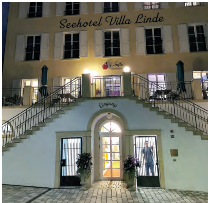
Das „s'Äpfle“ in Bodman im Linde-Areal hatte gleich im ersten Jahre des Bestehens 2020 einen Michelin-Stern geholt und kann ihn auch in 2023 zum Leuchten bringen.

Denn trotz einer wirtschaftlich schwierigen Zeit und Fachkräftemangel bestätigt die Restaurantauswahl 2023 wieder einmal das vielfältige Angebot und das unverändert hohe Niveau der deutschen Gastronomie. Eine beachtliche Entwicklung, die sich in einer erneuten Rekordzahl von insgesamt 334 Sternerestaurants widerspiegelt, darunter ein neues 3-Sterne-Restaurant, acht neue 2-Sterne-Restaurants und 34 Restaurants mit einem Stern. Die Region zwischen Hegau und Bodensee zeigt Beständigkeit, denn am Himmel strahlen da weiterhin fünf Sterne für besondere Qualität und Phantasie. Das Konstanzer „Ophelia“ kann seine zwei Sterne mit Lob halten: „Das Hotel ‚Riva‘ – und somit auch dieses Gourmetrestaurant – besticht ... vor allem durch die präzise Küche von