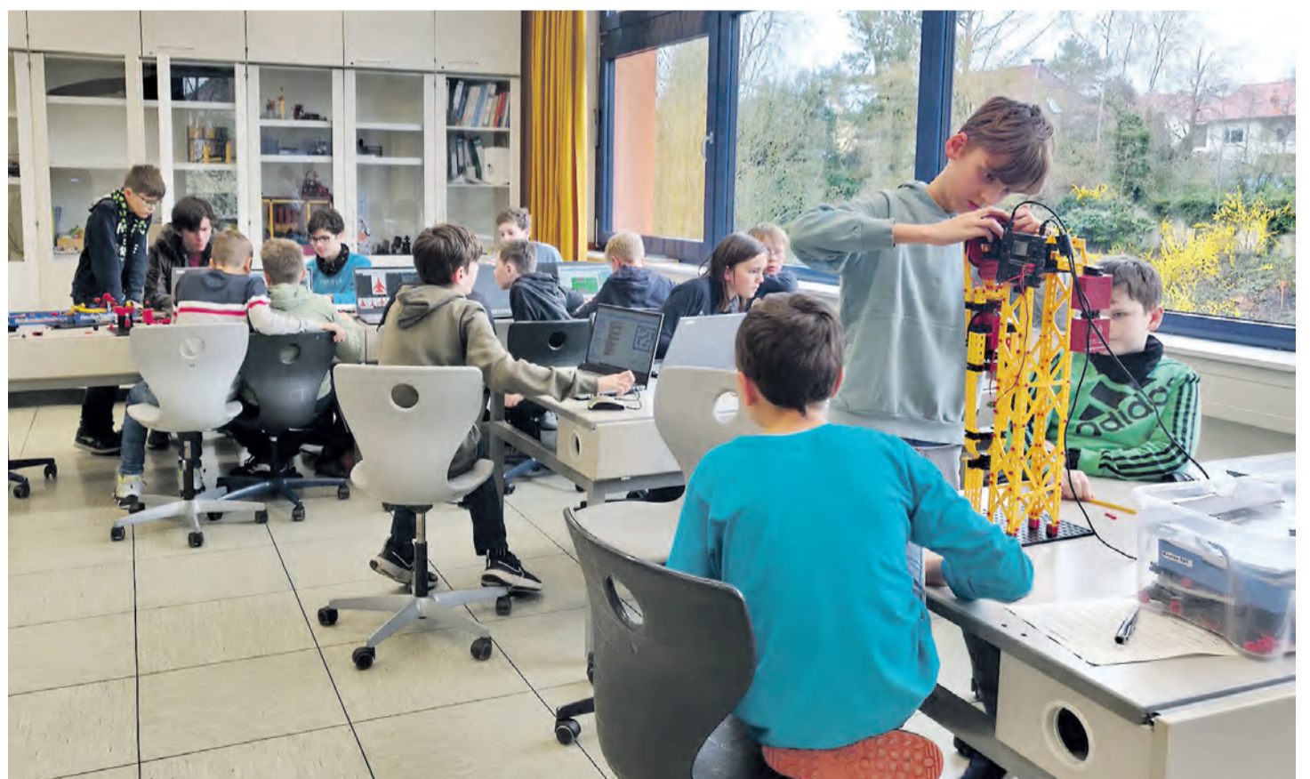
Um sich selbst ein Bild zu machen, gab es am Freitagnachmittag zudem noch einen Blick in den Raum nebenan: Etwa 20 Kinder und Jugendliche waren hier fleißig am Werkeln, Experimentieren oder Programmieren.

Konkret werden die Stiftungsgelder für drei Projekte verwendet: Einblicke in die Fertigungstechnik 4.0 zum Beispiel mit 3D-Druckern, einen Löt-kurs für Zehn- bis Zwölfjährige, der dann nach Bedarf wiederholt werden könne, und in das Konstruieren und Bedienen fahrbarer Roboter. Dazu sollen unter anderem leistungsstarke Laptops, ein zentraler Präsentationsbildschirm für die Kurse sowie ergänzendes Material