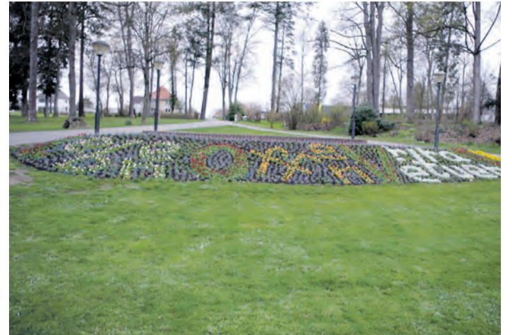
Die neue Frühlingsbepflanzung im Stockacher Stadtgarten sorgte für viele Fragezeichen – Was steckt hinter dem Buchstabensalat? fragen sich viele Besucher.

Jedes Jahr sorgen die Stockacher Stadtgärtner des Bauhofs im Stadtgarten mit ihrem Frühlingsflor für eine neue Überraschung. War letztes Jahr der Wunsch nach Frieden angesichts des kurz zuvor ausgebrochenen Kriegs gegen die Ukraine und dem damit verbundenen Zustrom an Flüchtlingen ein Thema, mit Friedenstauben und einem „Peace“-Zeichen, so kommen diesmal die „Simpsons“ in kräftigem Gelb zur Ehre. Auf dem großen Pflanzfeld ist freilich diesmal Rätselraten angesagt. Es ist sozusagen ein Buchstabensalat angedreht worden, aus dem man zunächst nur das Wort „Love“ herauslesen kann, weil