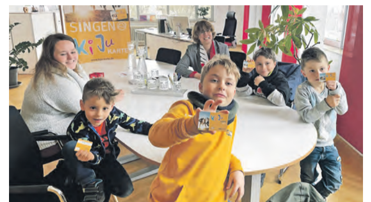
In Singen gibt es ein enges Netz an Aktivitäten gegen Kinderarmut wie hier die „Kiju-Card“, die kürzlich im neuen Format vorgestellt werden konnte. Für eine zentrale Prävention soll nun eine neue Stelle eingerichtet werden.

Erweiterung in diesem Bereich notwendig geworden, wurde den RätInnen in der Sitzung vermittelt. Geplant ist eine 50-Prozent-Stelle, die nun auch schnell ausgeschrieben und besetzt werden soll. Das Land Baden-Württemberg fördert zudem örtliche Präventionsnetzwerke gegen Kinderarmut sehr umfassend im Rahmen der Strategie „Starke Kinder – chancenreich“, wovon auch zum Beispiel der Verein „Kinderchancen“ in der Stadt profitiert. Für die Stadt Singen winken bei Kosten von 38.000 Euro Landeszuschüsse von bis zu 30.000 Euro, also 70 Prozent, wurde dem Gemeinderäten die Zustimmung in der Sitzung schmackhaft gemacht. Die Bezuschussung der Stelle durch das Land ist allerdings erst mal auf zwei Jahre befristet. Ein zentraler Baustein ist dabei nun die Entwicklung von lückenlosen Präventionsketten, die auch schon sehr früh einsetzen und auch für eine Entstigmatisierung von Armut wirken sollen, vor allem der von Kindern. Singen ist aufgrund der sozialen Strukturen die Stadt im Landkreis, in der das Thema Kinderarmut am stärksten aufschlägt. Auch für die Akquise weiterer Fördermittel sei die Präventionsstelle ein wichtiger Faktor. Oliver Fiedler