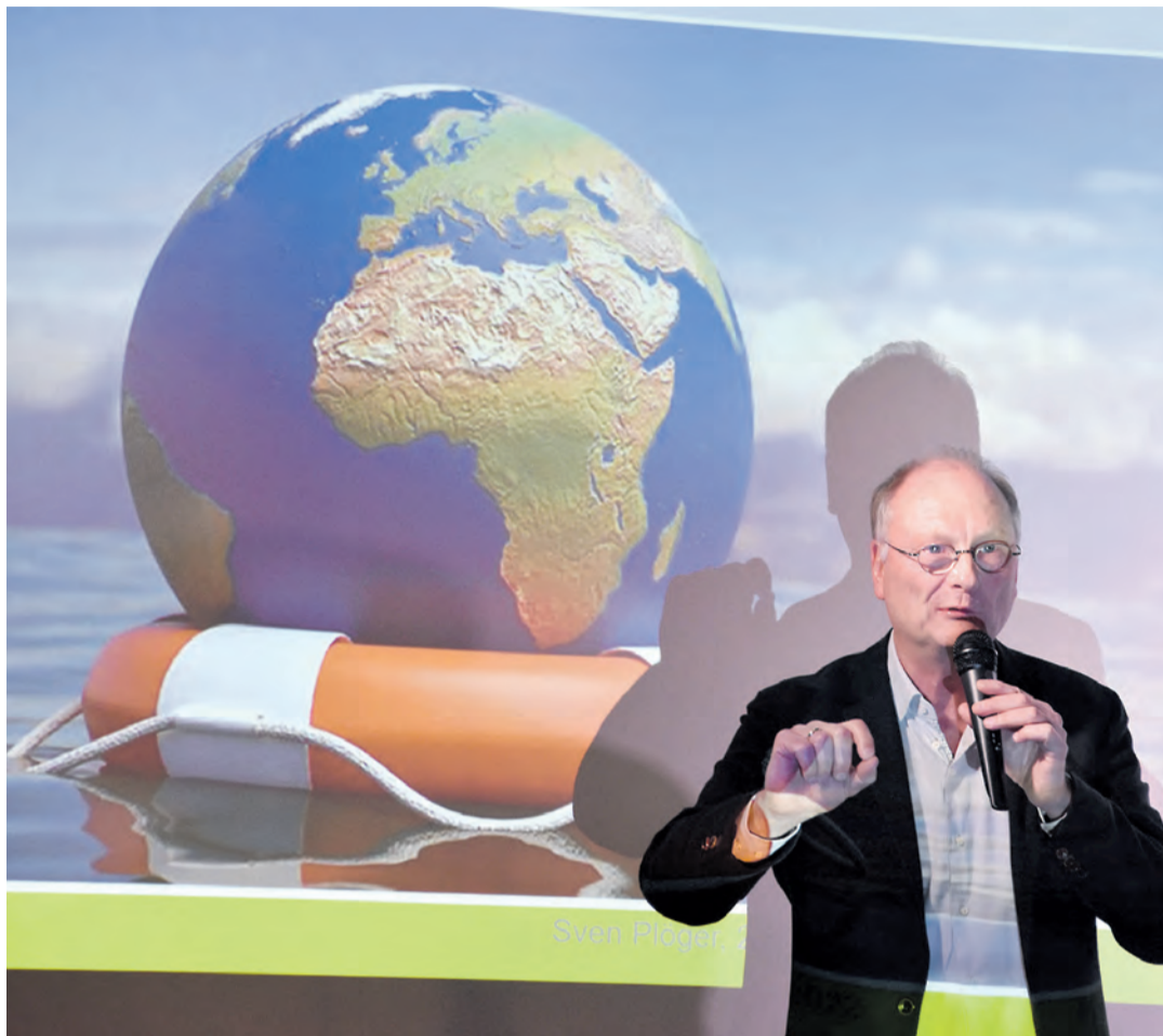
„Der Planet braucht nicht uns, wir brauchen ihn!“, betonte ARD-Wettermoderator Sven Plöger bei seinem Vortrag in der Buchhandlung Rupprecht in Radolfzell.

Auf den Veranstaltungsort habe er sich sehr gefreut, so studierte er für einige Semester Meteorologie im Appenzeller Land nahe des Bodensees und begann dort mit seinen ersten Wettervorhersagen. „Es ist einfach spannend zu verstehen, was im Wetter passiert und wie es funktioniert“, beschrieb er die Faszination für seinen Beruf.