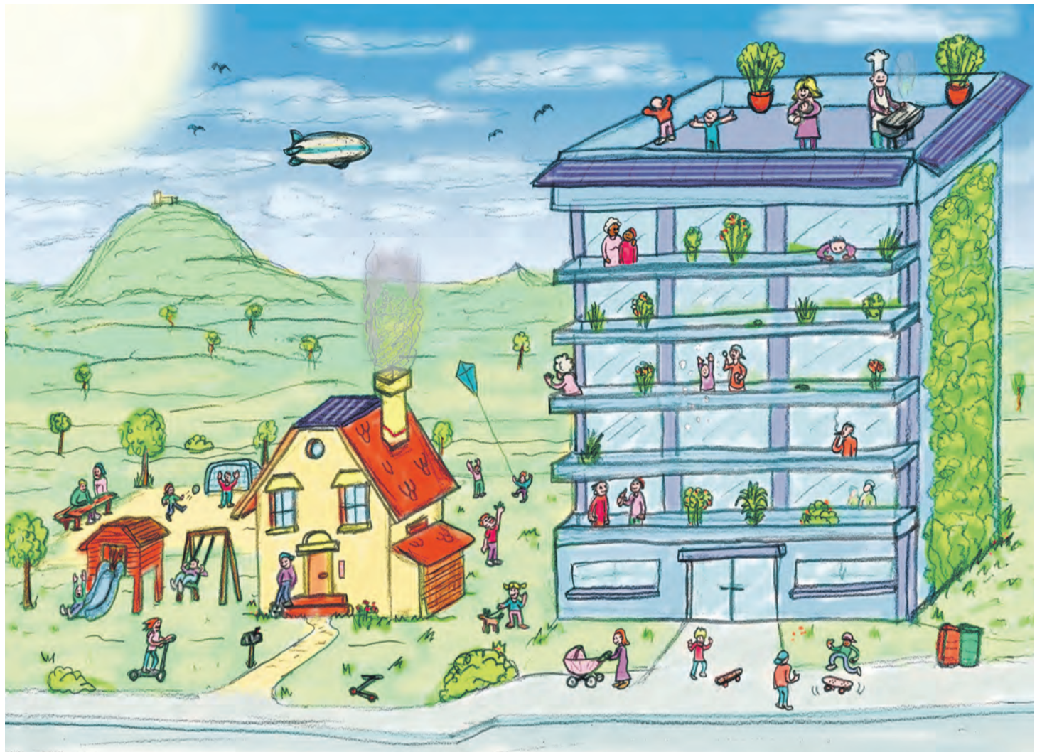
Die Zukunft des Wohnens ist gemischt: Die Zeiten der Baugebiete nur für Einfamilienhäuser sind wohl vorbei. Denn Kommunen setzen vermehrt auf eine Mischung mit Mehrfamilienhäusern.