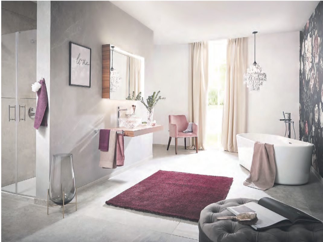
Mit fachkundiger Beratung verhilft Pfeiffer & May seinen Kunden ihr individuelles Traumbad zu verwirklichen.