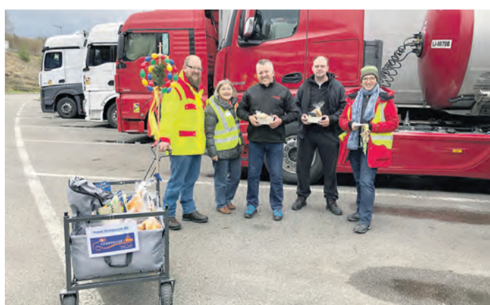
Das Lenkpause-Team überreichte süße und geistige Ostergrüße am Karsamstag an den Raststätten Hegau bei Engen. Die dort „gestrandeten“ Fahrer müssen dort die ganzen Osterfeiertage verbringen.