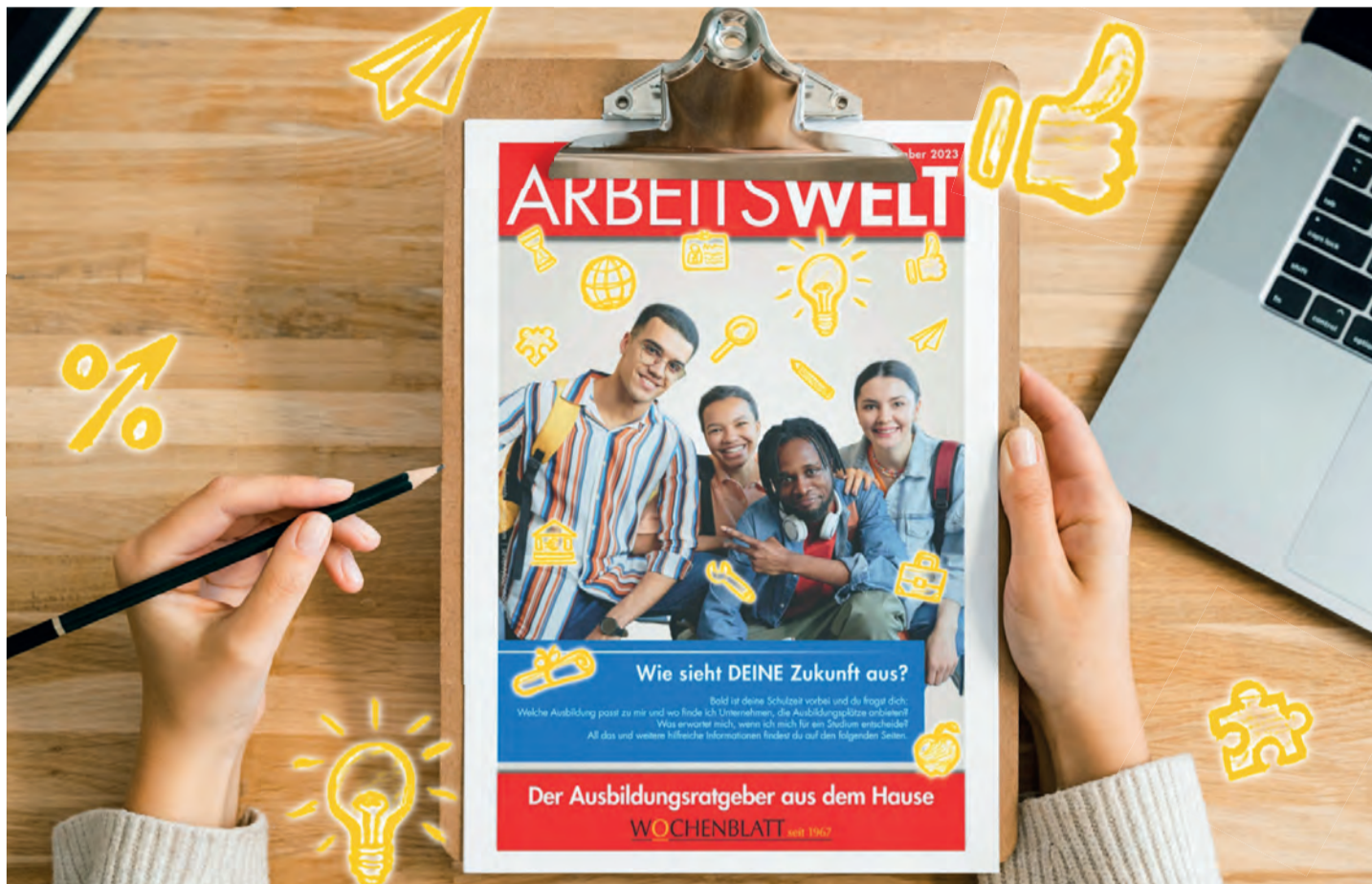
Für den Einstieg in die Arbeitswelt bietet unsere heutige Beilage jungen Menschen, die vor diesem neuen Lebensabschnitt stehen, wertvolle Tipps und Informationen.

Zu einem Wohnungsbrand in einem Mehrfamilienhaus wurden Polizei und Rettungskräfte am Montagabend um 21.50 Uhr nach Singen in die Worblinger Straße 27 gerufen. Bereits bei Eintreffen der ersten Kräfte stand eine Wohnung im ersten Obergeschoss in Vollbrand. Durch die Hitzeeinwirkung wurde auch die darüber liegende Wohnung in Mitleidenschaft gezogen. Alle zwölf Bewohner des Hauses konnten sich glücklicherweise unverletzt ins Freieretten. Die Freiwillige Feuerwehr Singen, welche durch die Feuerwehren Beuren, Überlingen am Ried, Rielasingen und Engen unterstützt wurde, konnte eine weitere Ausweitung des Feuers