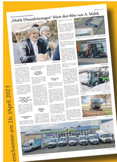
erschienen am 26. April 2023

„Das Ziel der Veröffentlichung war unseren Vater und sein 20jähriges Lebenswerk zu würdigen und sichtbar zu machen. Nach der Erscheinung haben uns viele unserer Kunden begeistert angesprochen. Dies hat unsere Präsenz verstärkt und gefestigt.“