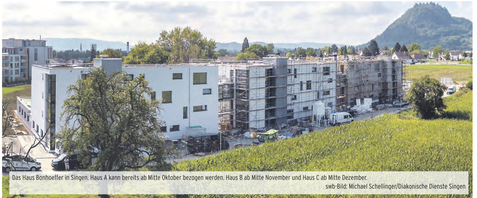
Das Haus Bonhoeffer in Singen. Haus A kann bereits ab Mitte Oktober bezogen werden. Haus B ab Mitte November und Haus C ab Mitte Dezember.

»Das Besondere am Haus Bonhoeffer ist, dass es diese Wohnform gibt, die gewährleistet, dass bis zur Schwerstpflege ein Verbleib in den eigenen vier Wänden möglich ist.«