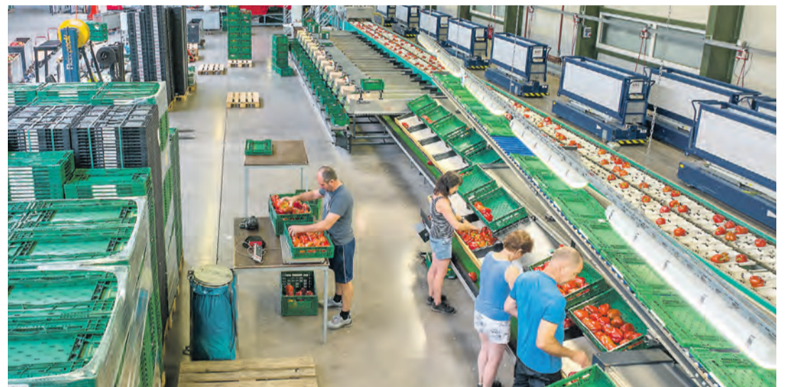
Die Paprikas werden in der Sortieranlage für die Weiterverarbeitung vorbereitet.

Nachhaltigkeit spielt in unserer heutigen Gesellschaft eine entscheidende Rolle. Immer mehr Menschen setzen auf Regionalität und möchten wissen, woher ihre alltäglichen Lebensmittel stammen und unter welchen Bedingungen sie hergestellt werden, bevor sie auf unseren Tellern landen. In diesem Kontext findet am 30. September der Tag der offenen Tür des Gewächshauses der Paprikafelder in der Engener Straße 30 in Beuren an der Aach statt. Die Reichenauer Gärtnersiedlung öffnet ihre Türen von 11 bis 18 Uhr und Besucher können sich auf vielfältige Veranstaltungen freuen. Sie erhalten außerdem die Möglichkeit, einen Blick hinter die Kulissen des Gewächshauses zu werfen, in dem nachhaltig Gemüse wie Paprika, Spitzpaprika, Auberginen, Tomaten und Gurken in Verkaufseinheiten verpackt werden.