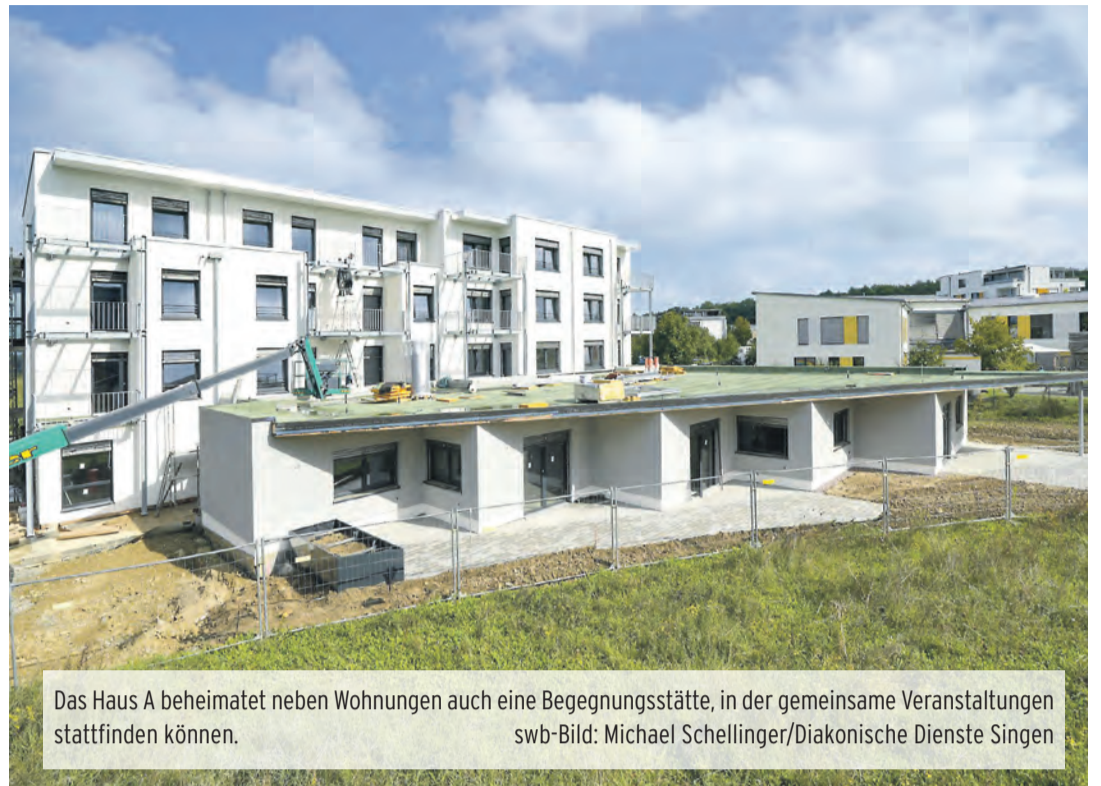
An der von der Straße abgewandten Seite ist das Haus Bonhoeffer mit Balkonen ausgestattet.