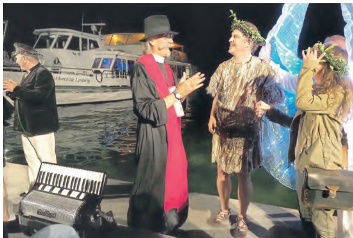
Da trafen sich sogar „Steinzeit“ und Gegenwart für die große Liebe im Bodman-Hafen und zeigten, was aus so einer Butterfahrt sich alles entwickeln kann, wenn man auch noch dem Gesang der Sirenen widersteht.

Ein schriller „Cruise Direktor“, ein höchst merkwürdiger Bordpfeifer, eine Frau mit TV-Gerät um den Bauch, die TänzerInnen der Färbe, „Donnergott“ Thor“ mit Rollat(h)or, eine Schar voller Sirenen, eine Piratenbande, die auch Kinderchor war, eine Forscherin auf Zeitreise auf der