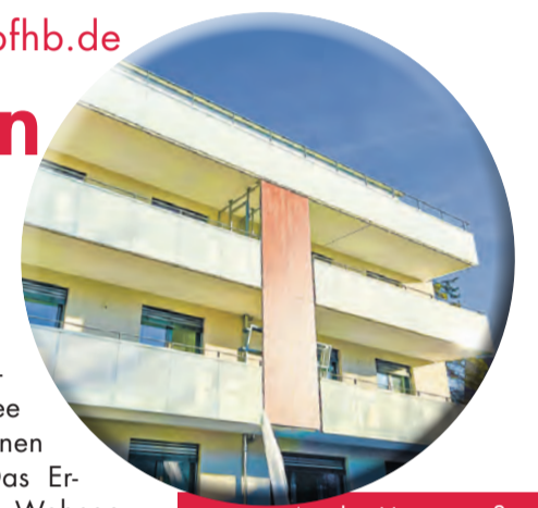
An der Hauptstraße in Hilzingen hat die Baugenossenschaft Familienheim Bodensee 22 Mietwohnungen realisiert.

Wasserqualität verbessert wird. In das Projekt hat die Baugenossenschaft Familienheim Bodensee rund 6,7 Millionen Euro investiert. Das Ergebnis sind zwei Wohngebäude mit drei Geschossen plus Dachgeschoss in guter Lage mitten im Ort. Geschäfte des täglichen Bedarfs sind fußläufig zu errei-