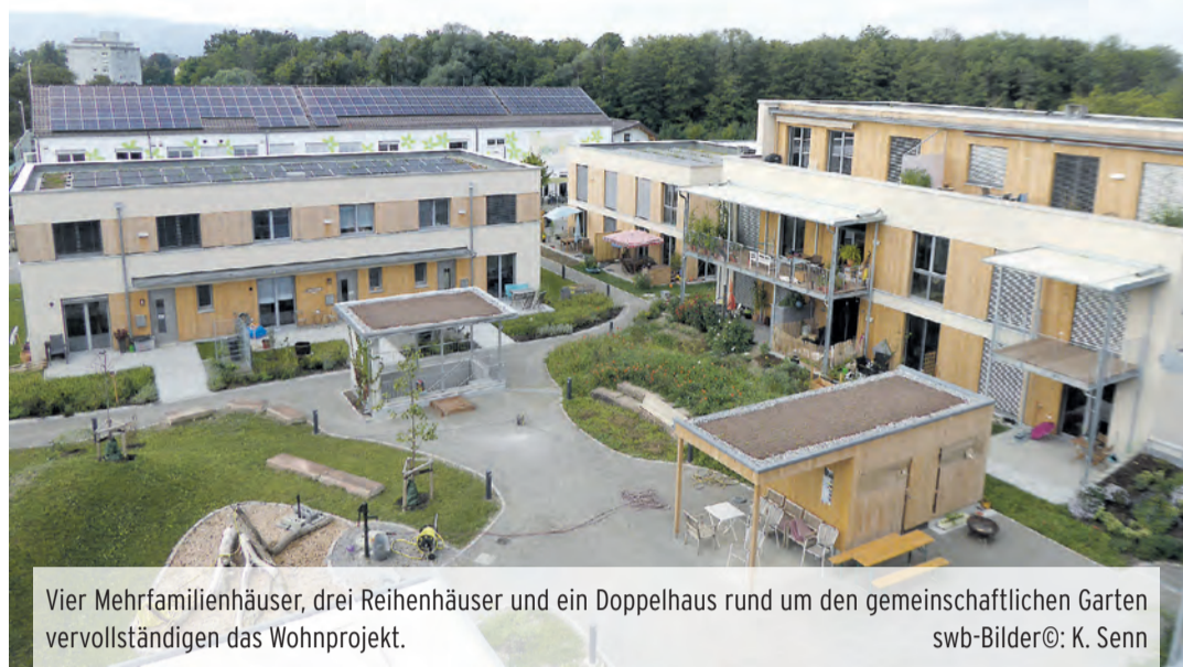
Vier Mehrfamilienhäuser, drei Reihenhäuser und ein Doppelhaus rund um den gemeinschaftlichen Garten vervollständigen das Wohnprojekt.