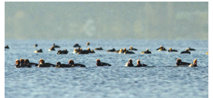
Das nun ausgerufen Naturschutzgebiet Markelfinger Winkel gilt deutschlandweit als der wichtigste Rast- und Nahrungsplatz für die Kolbenente.

Der offene und konstruktive Austausch mit den verschiedenen Nutzergruppen bereits im frühen Planungsstadium habe zu der nun vorliegenden Verordnung geführt, die den unterschiedlichen Interessen vom Naturschutz über die Freizeitnutzung bis zur Fischerei möglichst weitgehend gerecht werde, so Schäfer.