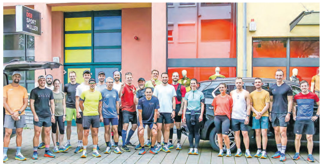
Start des „Vulkanlaufs“ war der Sport Müller.