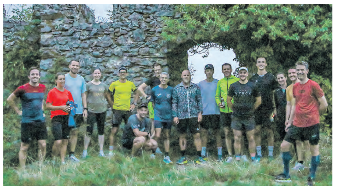
Auf dem Mägdeberg wartete auf die Läufer eine kleine Stärkung.