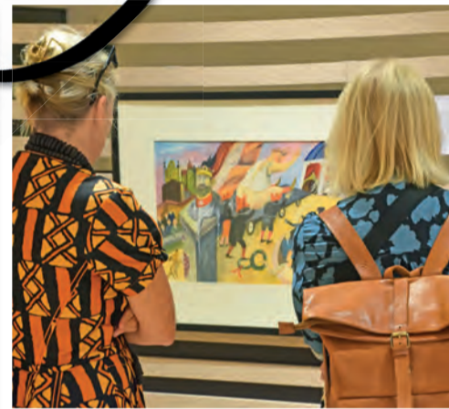
Interesse weckten die vielen künstlerischen Beiträge - wie hier die Boleslav Kvapil-Ausstellung im Büro Storz.