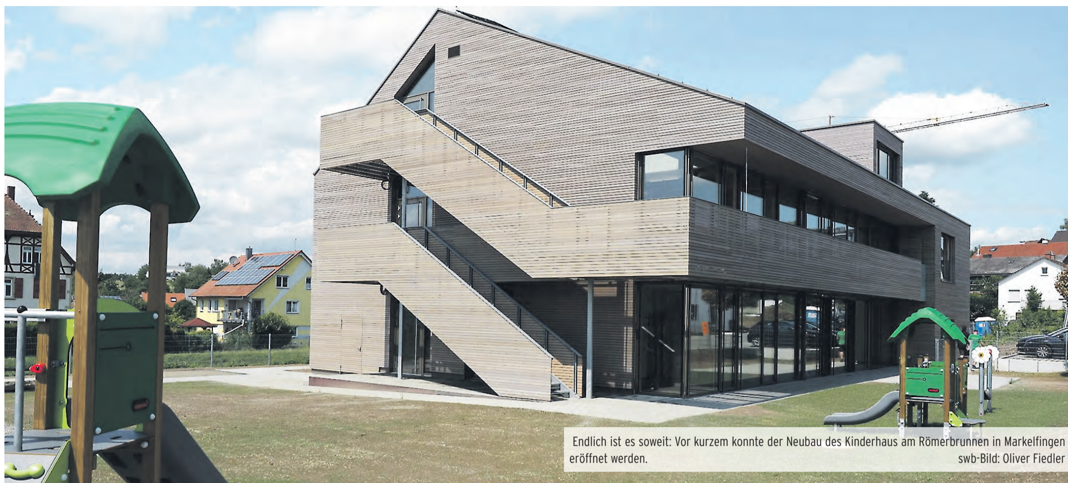
Endlich ist es soweit: Vor kurzem konnte der Neubau des Kinderhaus am Römerbrunnen in Markelfingen eröffnet werden.