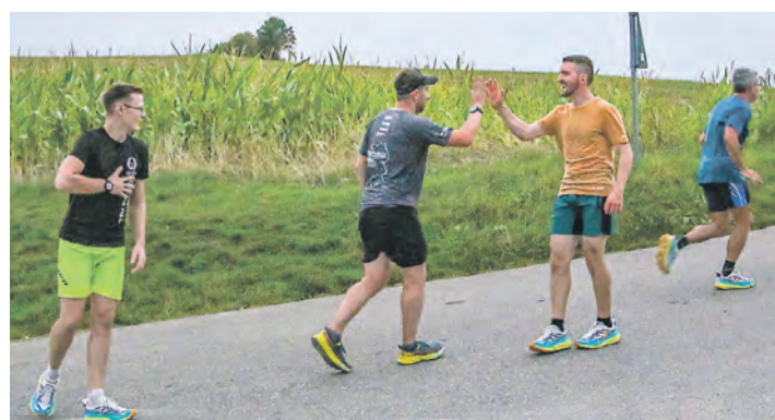
Die Läufer feiern die Ankunft am Mägdeberg.