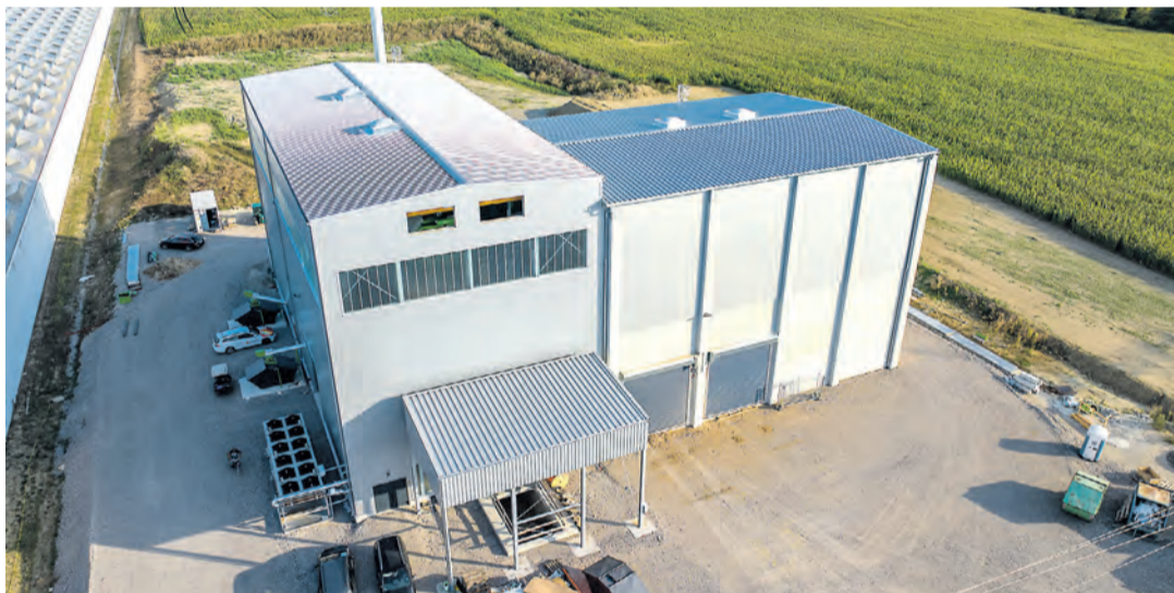
Das neue Biomasse-Heizwerk in Beuren an der Aach.