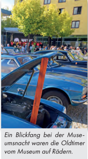
Ein Blickfang bei der Museumsnacht waren die Oldtimer vom Museum auf Rädern.