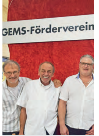
Im Rathaus begrüßten die fleißigen Helfer des GEMS-Fördervereins die Gäste.