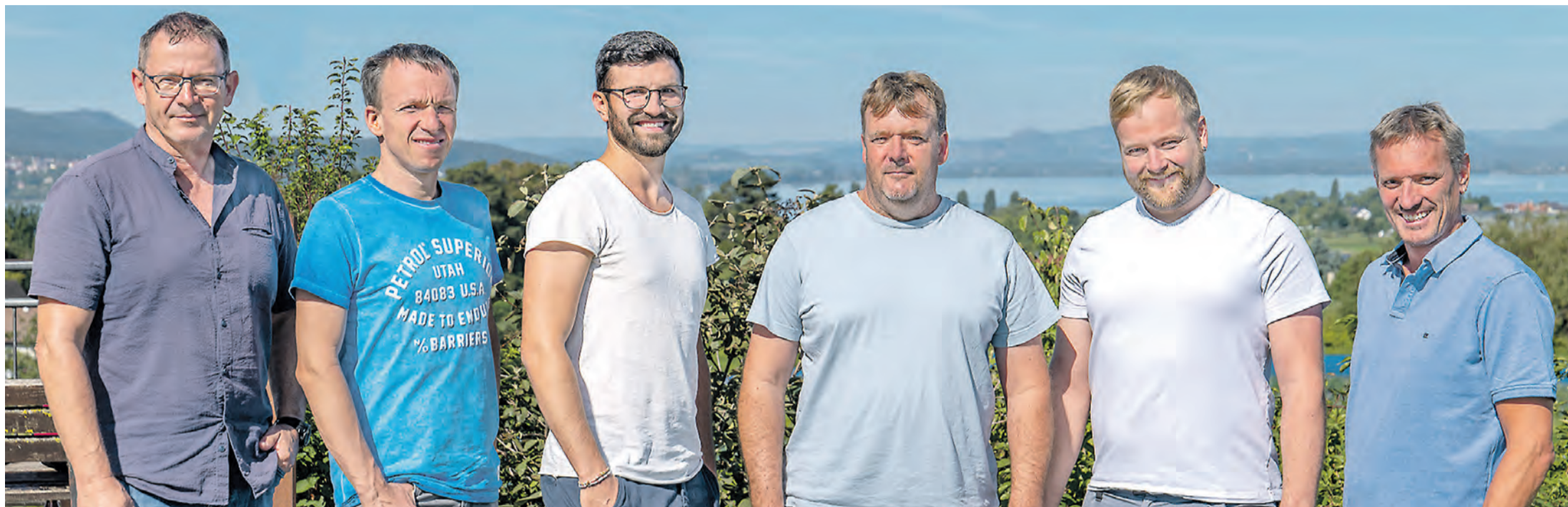
Die Geschäftsführung der Reichenauer Gärtnersiedlung.