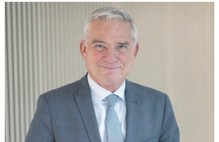
Thomas Strobl, Minister des Inneren und für Digitalisierung, wird beim Schätzele-Markt in Tengen sprechen.