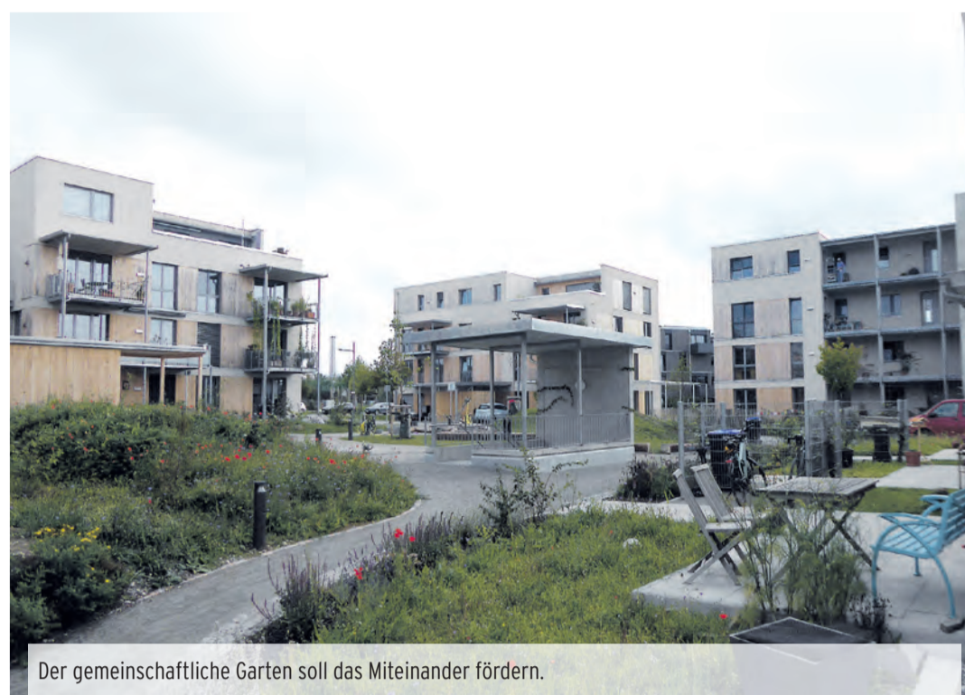
Der gemeinschaftliche Garten soll das Miteinander fördern.