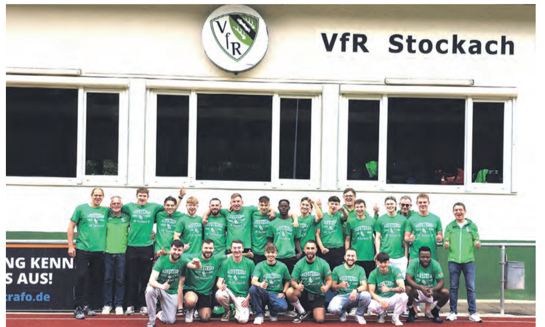
Die zweite Mannschaft des VfR Stockach spielt in der kommenden Saison erstmals in der Kreisliga A.