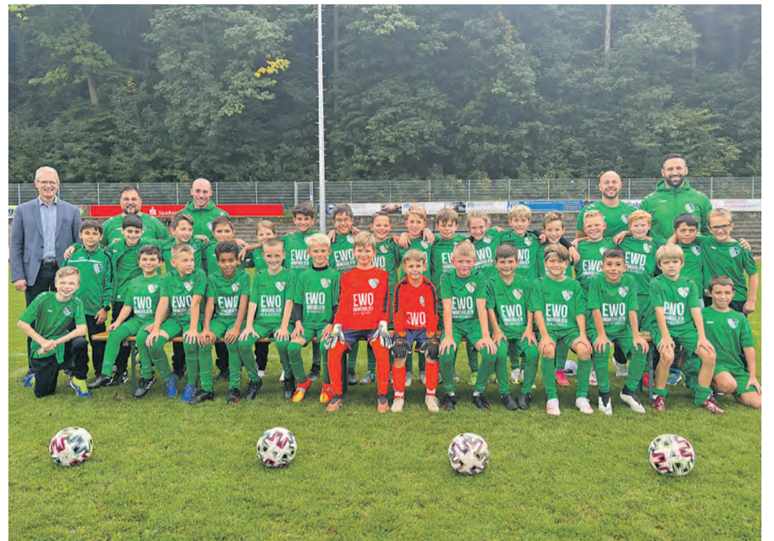
Die intensive Nachwuchsförderung wie beispielsweise hier die E-Junioren liegt dem Verein sehr am Herzen.