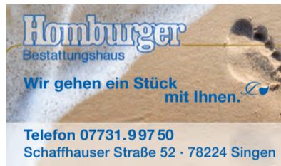
Telefon 07731.99750 Schaffhauser Straße 52 · 78224 Singen