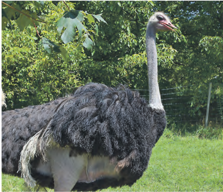
Über 200 Strauße leben in Airach.