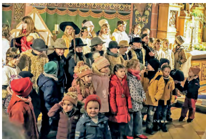
Als Hirten, Engel und Könige erzählten die Kinder aus Liggeringen bei ihrem Weihnachtsmusical die Weihnachtsgeschichte.