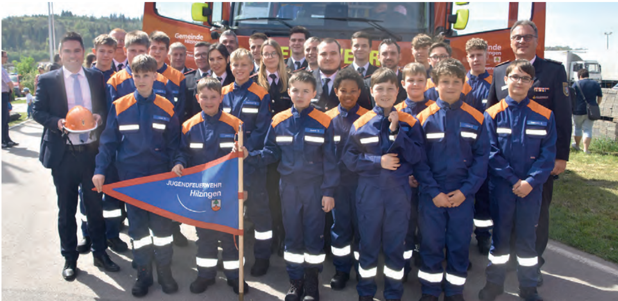
Eine Lücke in der Jugendarbeit konnte die Feuerwehr Hilzingen im April schließen: Hier konnte die Gründung einer Jugendfeuerwehr gefeiert werden. Das Fest folgte einen Tag nach der Einweihung eines neuen Einsatzfahrzeugs HLF20, was natürlich auch gebührend zelebriert worden war.

Mo, 23. Dezember 2024 Seite 6 www.wochenblatt.net