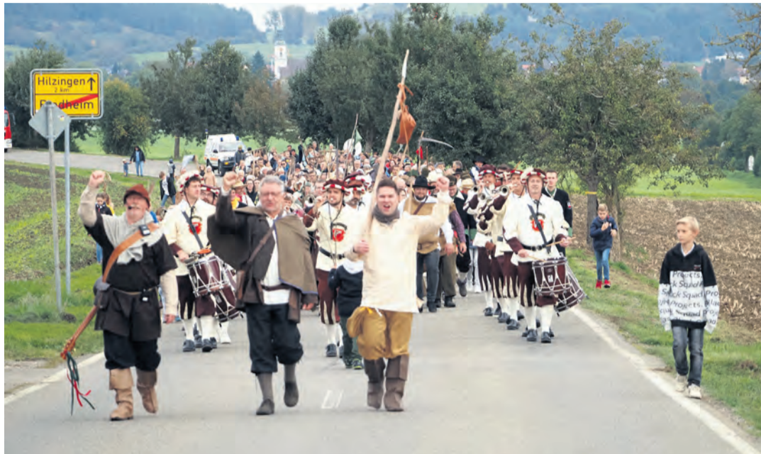
Mit der Hilzinger Kirche und dem Machtzentrum Hohentwiel im Rücken zog im Rahmen der Feierlichkeiten zu 500 Jahren Bauernaufstand in Hilzingen am 6. Oktober der „Freiheitszug“ der Hilzinger Bauern in Riedheim ein, um dort als Theaterstück mit der Obrigkeit im Gericht zu verhandeln.