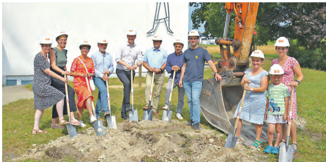
Die Beteiligten freuten sich sehr über den endlich erfolgten Spatenstich für die Erweiterung der Grundschule Markelfingen.

Ein wenig aufatmen können die Schülerinnen und Schüler der Grundschule Markelfingen . Bis sie ihre neuen Klassenzimmer betreten können, wird es zwar noch ein Jahr dauern, doch wurde am Mittwoch, 31. Juli, mit dem Spatenstich der Beginn der Bauarbeiten eingeläutet. Was höchste Zeit wurde, denn die Schule platzt aus allen Nähten. Momentan muss ein Teil des Unterrichts sogar im Markelfinger Rathaus stattfinden. Durch das Neubaugebiet mit zahlreichen Grundstücken wird für die nächsten Jahre allerdings noch ein weiterer Anstieg der Schülerzahlen erwartet. Deswegen soll bis zum Schuljahreswechsel 2025 ein Ausbau des Schulhauses vorgenommen