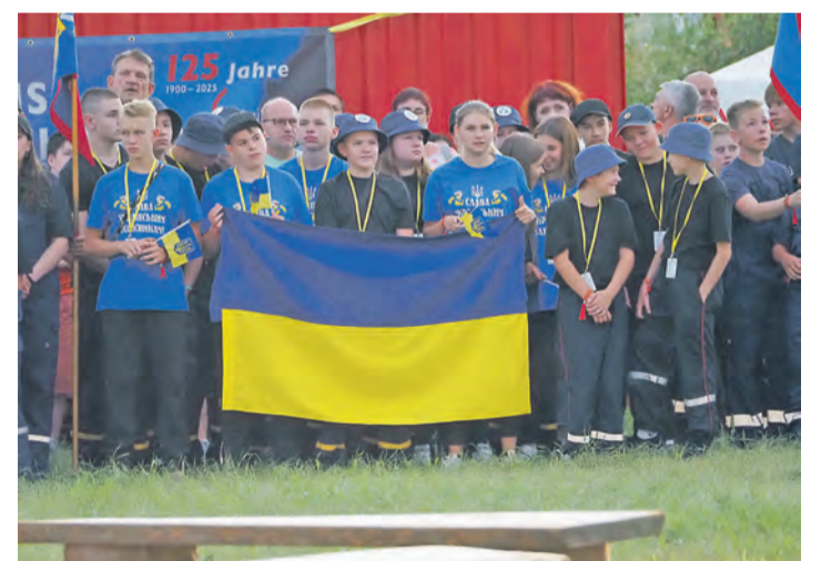
Auch eine Delegation aus der Singener Partnerstadt Kobeljaky war beim Kreisjugendfeuerwehr-Zeltlager in Engen mit dabei, die hier einige unbeschwerte Tage verbrachten.