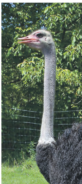
Auch hier in der Region gibt es einige tierische Exoten zu finden.