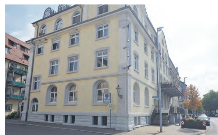
Das Hebammen-geleitete Gesundheits-Zentrum „radofine“ steht noch immer vor vielen Zukunftsfragen.