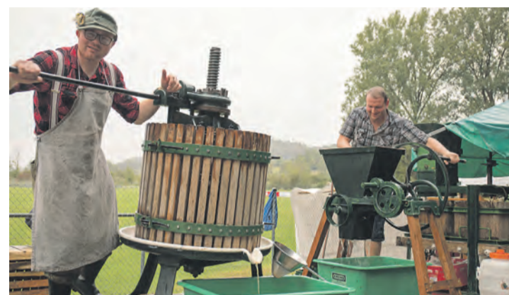
Auf der ländlichen Marktgasse können die Festgäste historischen Handwerksvorführungen, wie hier dem vom Narrenverein angebotenen Mosten, beiwohnen.