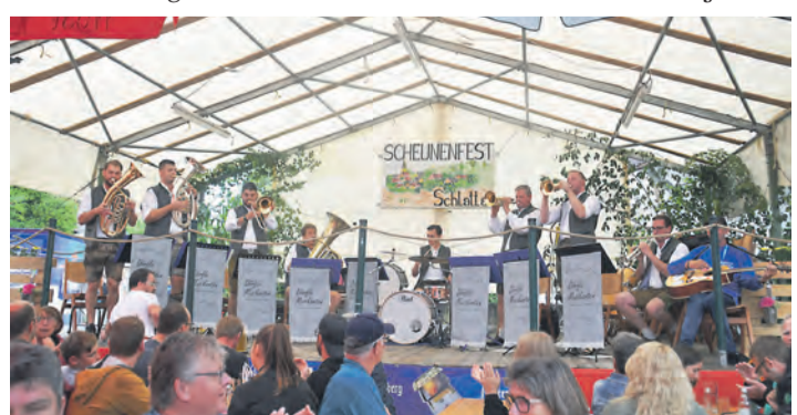
Am Sonntagnachmittag spielten vor der Scheune in Schlatt die 2023 gegründeten Dörfle Musikanten auf.

seit vielen Jahren reichte auch hier die namensgebende Scheune nicht für die BesucherInnen aus. Auf der Bühne sorgten der MV Kolbingen, der Fanfarenzug Castellaner aus Riedheim und die Dörfle-Musikanten für den musikalischen Rahmen. Auch dem Nachwuchs des Musikvereins Schlatt am Randen sowie der Tanzgruppe „Dynamite“ aus Überlingen am Ried gehörte die Bühne für einen Auftritt, ehe „Die Feierei“ für Stimmung am Abend sorgte. Einen Mix aus Seniorennachmittag und einem stimmungsvollen Abschied bis in die Nacht brachte der Montag, mit dem beliebten „Großen Bierabend“. Anja Kurz