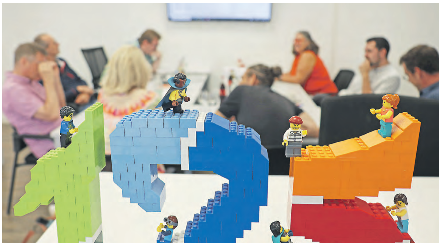
Alles andere als leicht war die Aufgabe der siebenköpfigen Jury, die die eingegangenen LEGO®-Modelle bewertete und schließlich ihre zehn Favoriten kürte.

Dabei waren der Fantasie (fast) keine Grenzen gesetzt: Gebaut werden konnte alles, was die Teilnehmerinnen und Teilnehmer mit der Stadt Singen verbindet. Und nicht nur die Jury, sondern das ganze Team des WOCHENBLATTs staunte über den Einfallsreichtum, der sich in den abgegebenen Werken zeigte. Von sechs bis 68 Jahren waren Jung und Alt beim Wettbewerb vertreten. Zunächst erstaunlich war, dass sage und