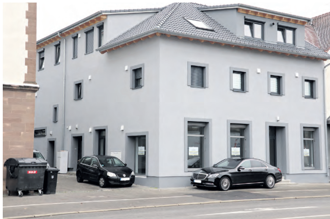
Nach der Kernsanierung des Altbaus strahlt dieser im neuen Glanz.