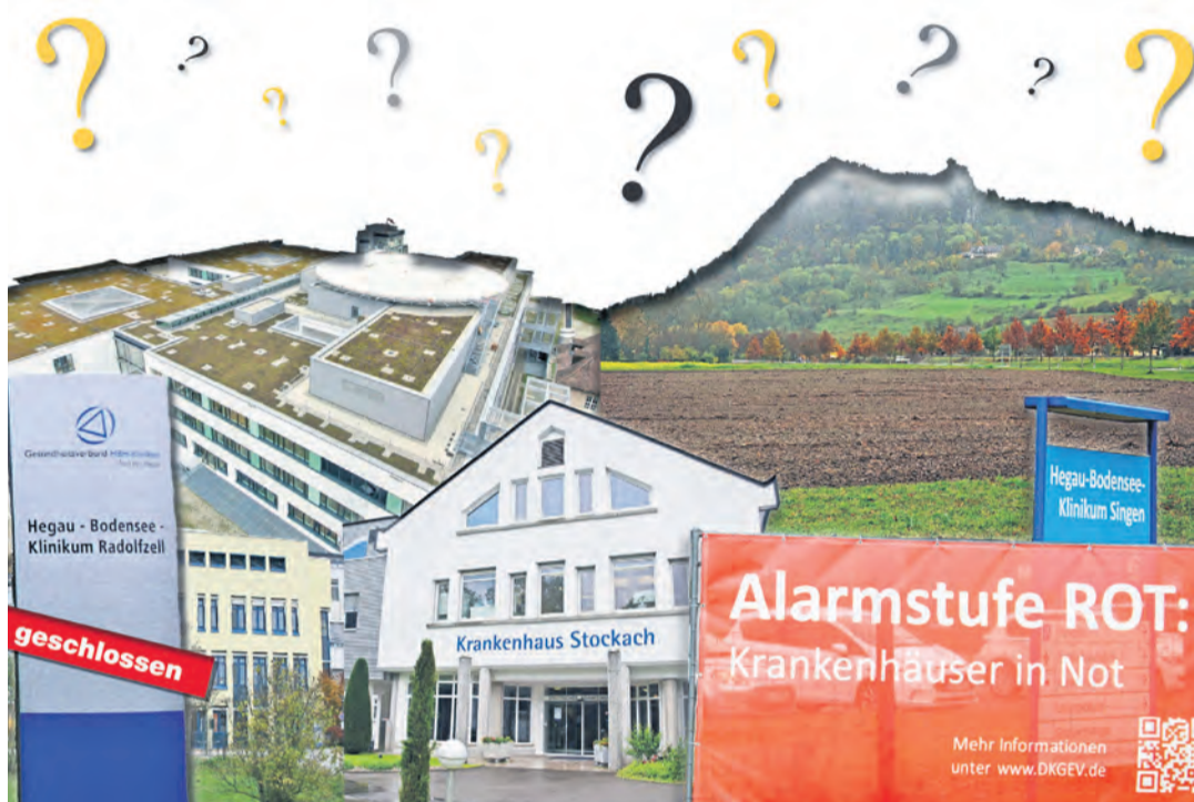
Die Klinikregion ist ohnehin im Umbruch, durch die Neubaupläne in Singen und die Schließung des Radolfzeller Krankenhauses. Schon deshalb bleiben derzeit noch viele Fragezeichen darüber, was sich nun durch die vergangenen Donnerstag in Berlin beschlossene Krankenhausreform verändern, verbessern oder verschlechtern wird.

„Unser Ziel muss es sein, Krankenhausstrukturen in Stadt und Land zukunftsfest zu machen,