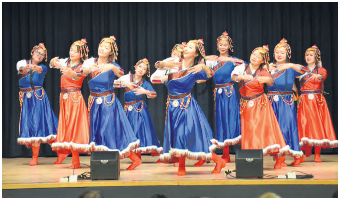
Zum zweiten Mal mit dabei war die Deutsch-Chinesische Gesellschaft Bodensee, die traditionelle Tänze vorführte.