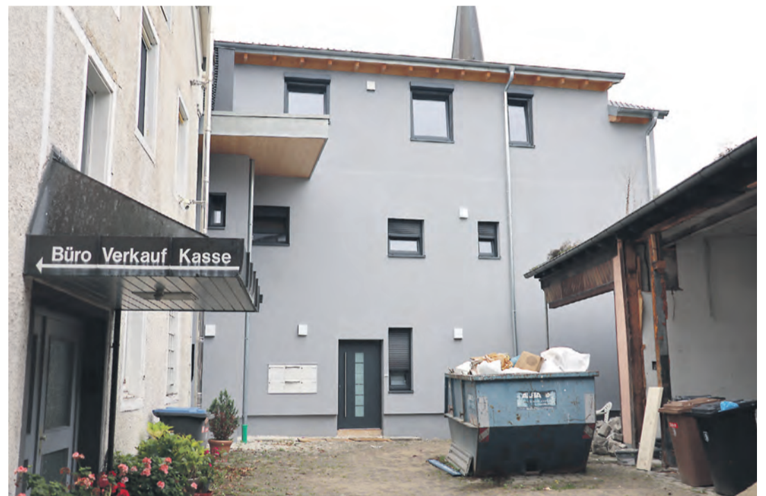
Der Innenhof des Altbaus bietet nach Fertigstellung einen Platz zum Verweilen an.