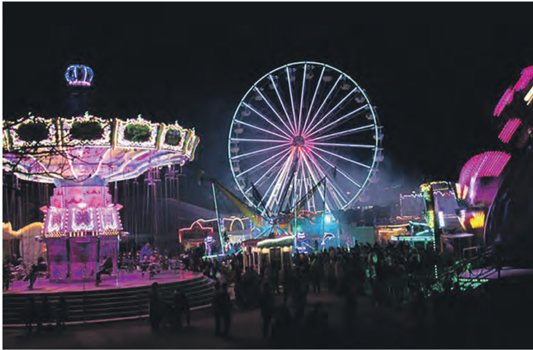
Schätzele-Markt von Freitag, den 25. Oktober 2024 bis Montag, den 28. Oktober 2024 in Tengen. Der Markt ist mit über 100.000 Besuchern das größte Volksfest der Region und eines der wichtigsten in Südbaden. Er lebt von seiner Vielfalt. Der Volksfestplatz bietet Jung und Alt aus Nah und Fern ein unermessliches Vergnügen. An vier Tagen wird im über 2.000 Personen fassenden Festzelt Unterhaltung, Musik und Tanz geboten. Weitere Infos unter www.tengen.de .