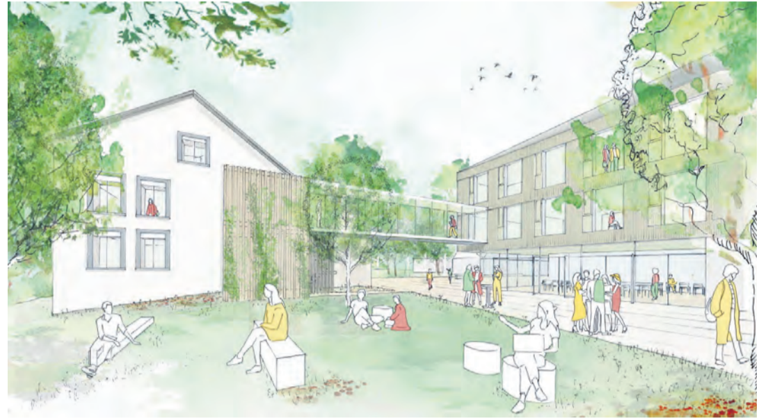
Wenn das „alte-neue“ Rathaus rückgebaut ist, soll es einen „Grünhof“ geben. Sichtbar auch die Verbindung zwischen der alten Rathaus-Villa und dem Neubau. swb-Bild: Architekturbüro Schaudt

Das „neue Rathaus“ in Rielasingen-Worblingen soll vom Konstanzer Architekturbüro Schaudt geplant werden. Über diese Entscheidung aus den nichtöffentlichen Sitzungen der Jury wurde nun im Gemeinderat und per Medienmitteilung der Gemeinde informiert.