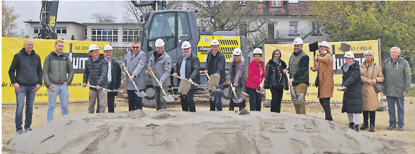
Für die vielen bereits jetzt am Bau beteiligten Personen reichten die zehn vorbereiteten Spaten beim Spatenstich bei Weitem nicht aus.

Das Haus am Mühlebach als Sonderpädagogisches Bildungs- und Beratungszentrum (SBBZ) wächst weiter: Mit dem symbolischen Spatenstich für ein neues Internatsgebäude wurde ein erster Schritt getan, um den rund 30 dort wohnenden Kindern und Jugendlichen ein neues Wohnumfeld bieten zu können.