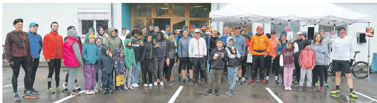
Einer der Laufgruppen beim letztjährigen Volksbank BENEFIZlauf die demonstrierte, wie viel gute Laune ein Läuferchen rund ums Obstbaudort Wahlwies machen kann.