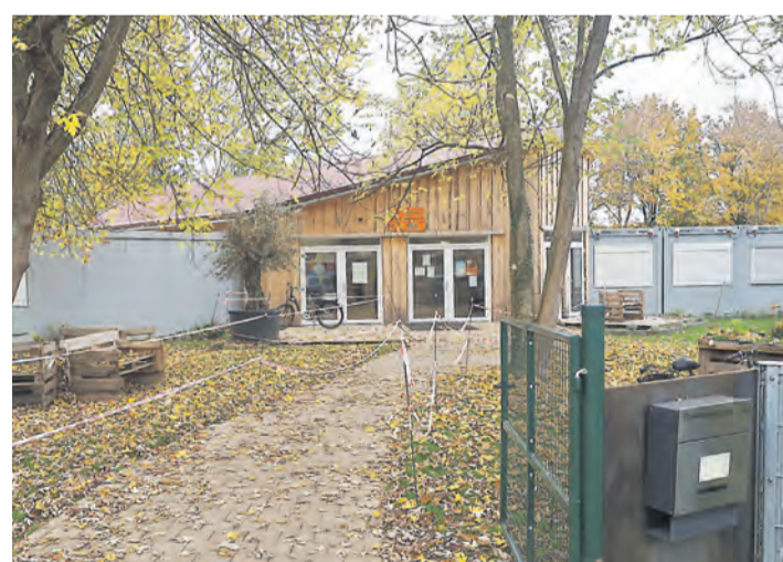
Die freie Schule Rheinklang soll nun in der Containersiedlung zwischen dem städtischen Containerkindergarten „Weltenbummler“ und dem Kinderkulturzentrum „Lollipop“ einen festen Standort bekommen.