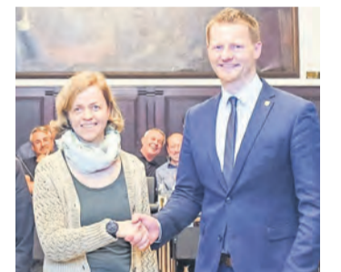
Gratulation nach der Wahl: Sindy Bublitz und OB Simon Gröger.