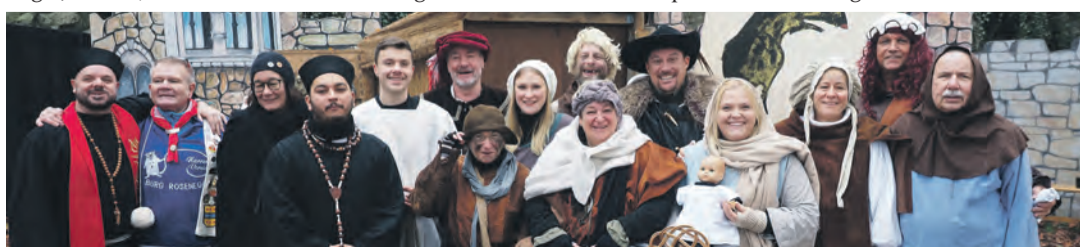
Die Schauspieler des Martinispiels konnten sich über viel Applaus für ihr Martinispiel freuen, mit dem die „Rattlinger“ ihre Fasnet eröffneten.

digd und die Pflicht zur Beichte, dann sollten die Wunder des Herrn schon wirken. Aber auch das ging erst mal schief, und der Haarlosen wuchs erst nur ein Bart, dem Junker tat die andere Backe weh, die Jungfrau gebar schon ihr Brutzele mit Schmerzen und der einäugige Bauer bekam sein fehlendes Auge auf die Backe. Erst eine gehörige Weihwasserduche und Einräucherung konnte nach Drohungen des Burgvogts mit seinem Degen das fehlgeschlagene Wunder wieder in die richtige Bahn lenken und am Ende konnte doch tatsächlich wieder auf die Fasnet 2025 gemeinsam angestoßen werden. Dankbar konnten die Narren für die Findigkeit des Schützenvereins sein, der mangels Schießgenehmigung für die Kanone mit Riesenhöllern das Signal zum Start in die Fastnacht gab. Oliver Fiedler