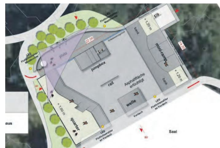
Die Pläne für die neue Skateranlage im Pestalozzi-Kinderdorf sind schon weit gediehen. Der Bau könnte schon bald beginnen.

den Volksbank BENEFIZlauf.