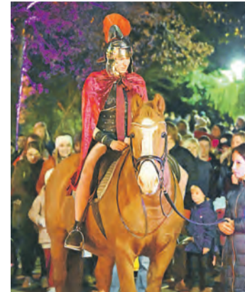
St. Martin, hoch zu Ross.