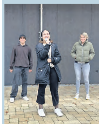
swb-Bild: Oliver Fiedler

Am Vorabend des historisch bedeutsamen 9. November wurde an vielen Orten in Deutschland musiziert. Auch auf der Hörli kamen über 100 Menschen zum musikalischen Friedensgebet mit dem Chor Höriluja zusammen. Das Datum war bewusst gesetzt, am Vorabend des Gedenkens an die Zerstörung jüdischer Gebetshäuser, Friedhöfe, Geschäfte und Wohnungen durch die Nazis 1938. Und am Vorabend des Gedenkens an den Fall der Berliner Mauer 1989. Über 100 Menschen versammelten sich in der Wangener Kirche zu einem bewegenden Gottesdienst, um gemeinsam zu beten und zu reflektieren. Begrüßt wurden sie von einer aus Kerzen gestalteten großen Friedenstaube. Die musikalischen Beiträge des Chors Höriluja umfassten sowohl bekannte als auch neue Lieder, die Frieden und Hoffnung thematisierten. Gemeinsame Gesänge, treffende Texte und der stimmungsvoll beleuchtete Kirchenraum trugen zur ergreifenden Atmosphäre des Gedenkens bei und setzten ein Zeichen für Zusammenhalt in einer Zeit, die von Spannungen geprägt ist.