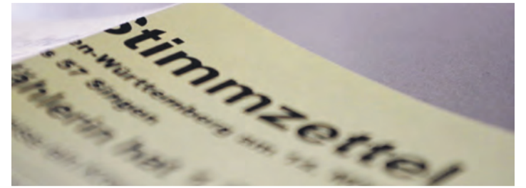
Noch bis Sonntag, 17. November, können junge Menschen ihre Kreisvertreter wählen.

Wahlbeteiligung der insgesamt über 23.500 jungen Menschen zwischen 14 und 21 Jahren im Landkreis Konstanz. Informationen zu den Kandidierenden gibt es bei Instagram unter @jugendkreisrat_konstanz sowie auf www.jkr.coolzap.de . Pressemeldung Quelle: Landratsamt Konstanz