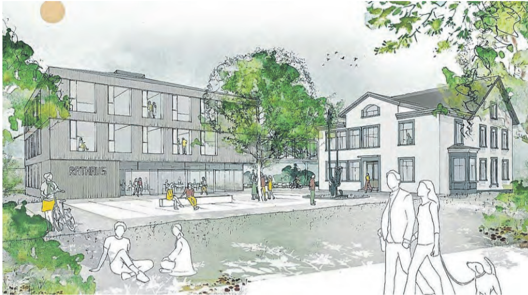
Eine der Ansichten des Rathausneubaus des Konstanzer Architekturbüros Schaudt, der an der Stelle des bisherigen Sitzungssaals entstehen wird.