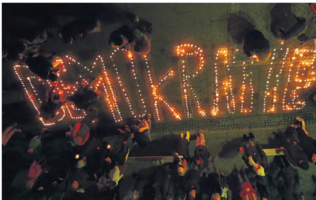
Rund 1.500 Menschen haben sich am zu einer Kundgebung für Demokratie und die Wahrung der Menschenwürde am 31. Januar auf dem Radolfzeller Münsterplatz eingefunden. Mit dieser Aktion wollten sich die Teilnehmer für Offenheit, Vielfalt und Miteinander einsetzen