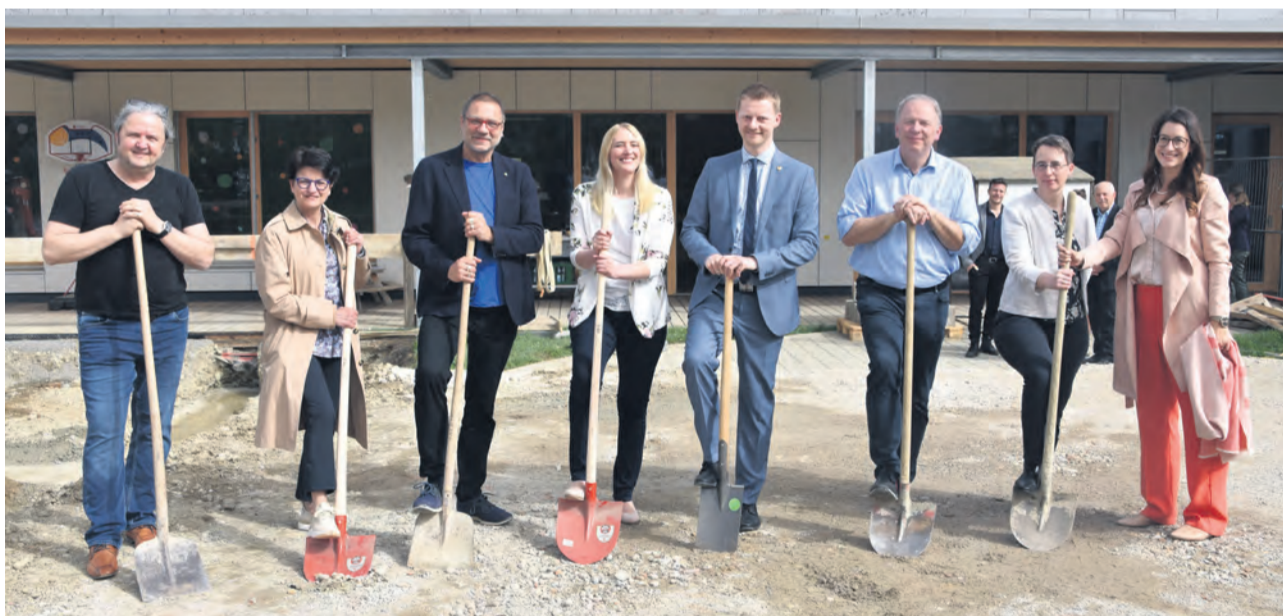
Die Lage in Sachen Kinderbetreuung hat sich in Radolfzell in letzter Zeit stabilisiert. Ein weiterer Schritt wurde am 8. April beim Spatenstich zur Erweiterung des im Oktober 2020 errichteten Kinderhaus Böhringen gemacht.