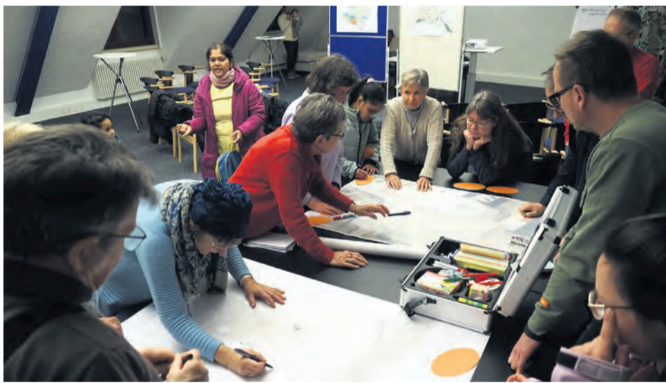
Nach langen Verhandlungen, zahlreichen Beschlüssen im Gemeinderat so wie unter anderem Bürgerworkshops wie hier Ende Januar war es Mitte Oktober vollbracht. Der Pocket Park, Radolfzells Pilotprojekt für eine grünere und umweltfreundlichere Innenstadt, bekam endlich grünes Licht.