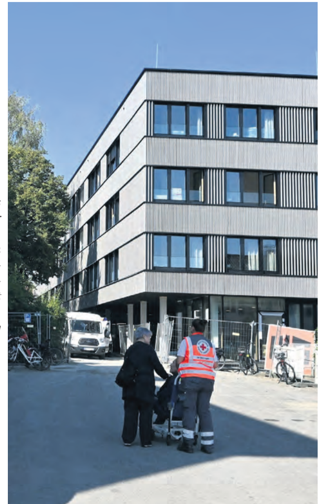
Drei Jahre hat es gedauert, bis das neue Pflegeheim auf der Mettnau fertig wurde. Am 21. September konnte gemeinsam mit dem DRK und den Pflegekräften der Umzug der Bewohner in deren neue Heimat vollzogen werden.