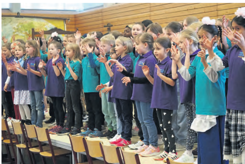
Mit einem Jahr Verspätung, dafür aber mit einer großen Feier und zahlreich erschienenen Gästen konnte die Teggingerschule am 27. April ihren 125. Geburtstag feiern.