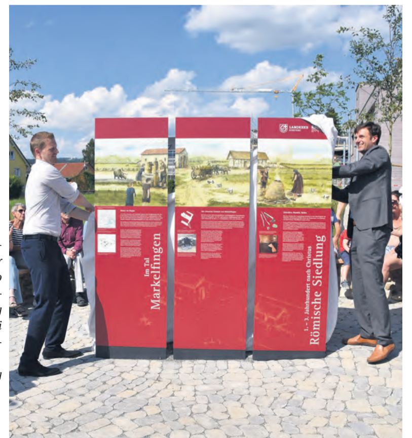
Ein ganz großes Jubiläum konnte in diesem Jahr der Radolfzeller Stadtteil Markelfingen feiern. So blickte man mit einigen Höhepunkten wie hier der Enthüllung der Jubiläumsstele Anfang Juni auf stolze 1300 Jahre Ortsgeschichte zurück.