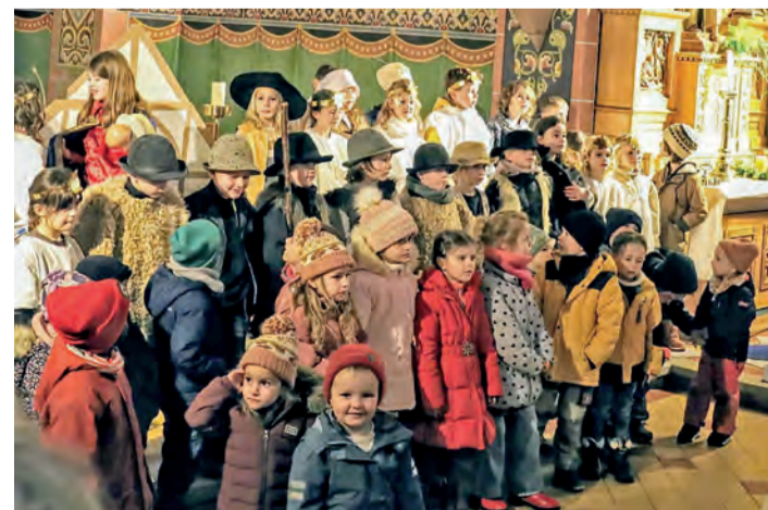
Als Hirten, Engel und Könige erzählten die Kinder aus Liggeringen bei ihrem Weihnachtsmusikal die Weihnachtsgeschichte.