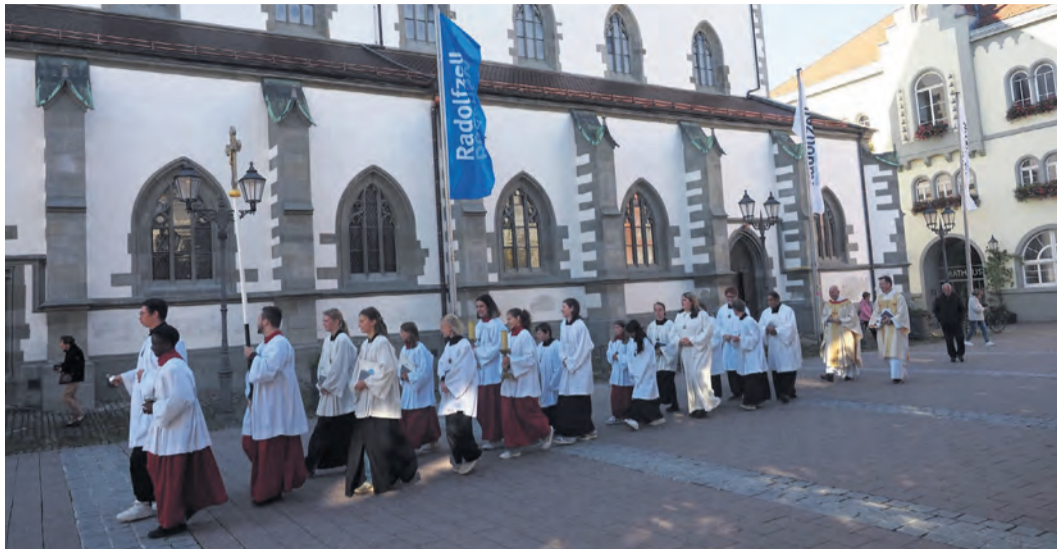
Nach fünf Jahren Baustelle war es vollbracht: Mit einem großen Festgottesdienst am 29. September konnte die Kirchengemeinde in Radolfzell den Abschluss der Sanierungsarbeiten am Münster feiern.

Mo, 23. Dezember 2024 Seite 5 www.wochenblatt.net