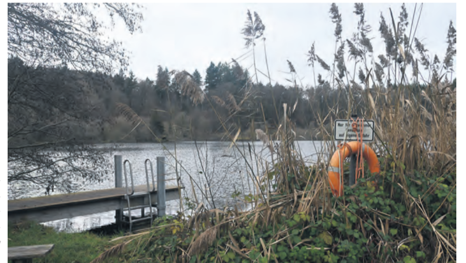
Ein ereignisreiches und turbulentes Jahr war 2024 auch für das Güttinger Buchenseebad. Nachdem aufgrund einer fehlenden Badeaufsicht das Bad im Sommer schließen musste, wird nun für die kommende Saison der/die Pächter/in neu ausgeschrieben.