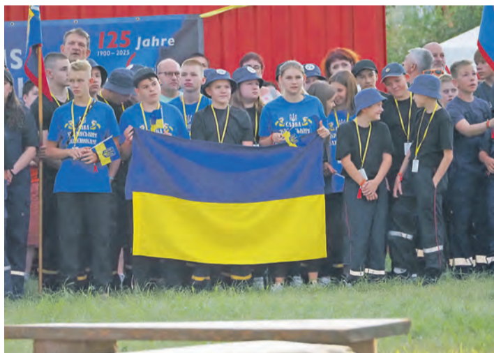
Auch eine Delegation aus der Singener Partnerstadt Kobeljaky war beim Kreisjugendfeuerwehr-Zeltlager in Engen mit dabei, die hier einige unbeschwerte Tage verbrachten.

Da war groß angerichtet. Genau 909 Mitglieder der Jugendfeuerwehren aus dem Landkreis, dieses Jahr sogar verstärkt durch eine Delegation der Feuerwehr aus der Singener Partnerstadt Kobeljaky , waren beim diesjährigen Jugendfeuerwehrlager in Engen. Das wurde am Mittwochabend, 24. Juli, feierlich mit dem Entzünden des Lagerfeuers und dem Hissen der Fahne durch die Jugendfeuerwehr Engen eröffnet, die damit ihren 50. Geburtstag feierte.