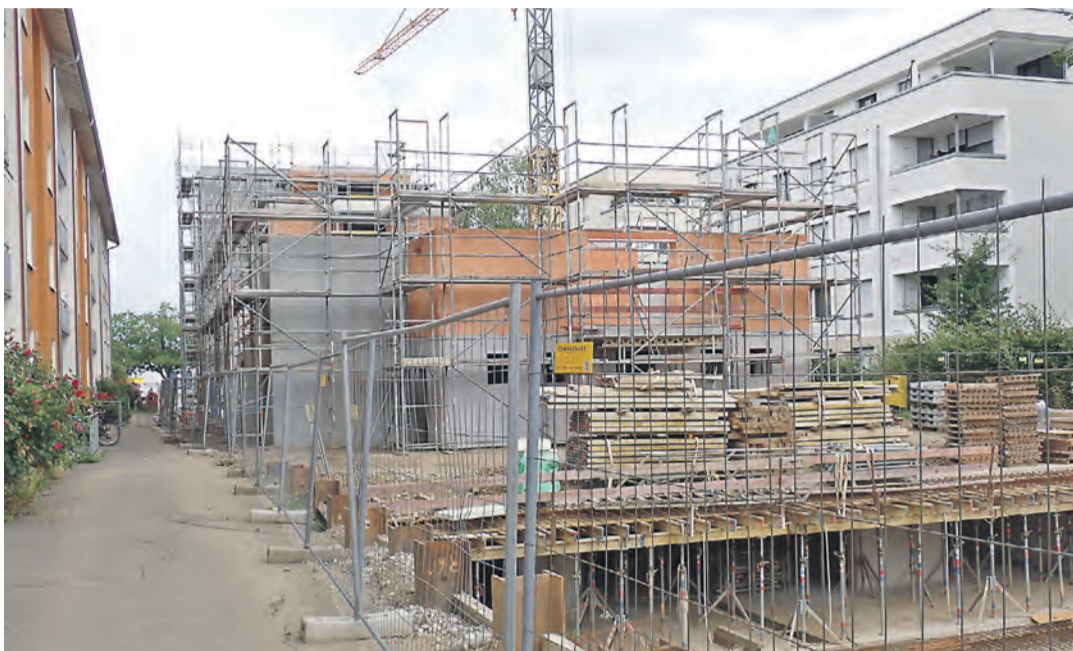
Wenn Baugenossenschaften derzeit noch bauen, geschieht das fast durchweg als Nachverdichtung, wie hier durch die Baugenossenschaft Familienheim Bodensee am Malvenweg in Singen. Grundstückskosten würden die Investitionen nochmals in unermessliche Höhen treiben.

Die Zahlen lassen einen schnell erschrecken: In Baden-Württemberg sank die Zahl der genehmigten Bauten in 2023 um 33 Prozent, in der ersten Jahreshälfte kommt man gar auf ein Minus von über 40 Prozent gegenüber dem langjährigen Mittel. Aber das hat einen klar definierbaren Grund.