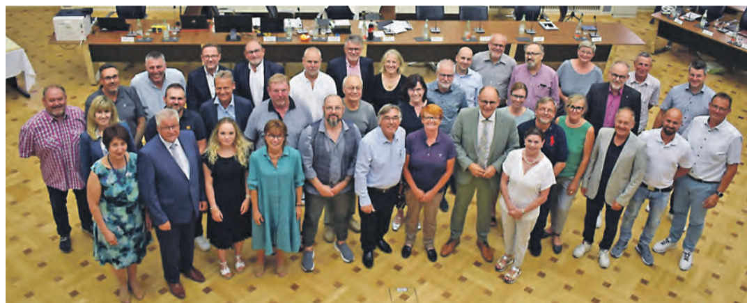
Der neue Singener Gemeinderat fast vollständig nach seiner Konstituierung im Ratssaal des Singener Rathauses.

Die Sitzung war indes gut vorbereitet und durch die Abstimmung kamen einvernehmliche Entscheidungen zur Besetzung der sechs Ausschüsse des Gemeinderats wie der 14 Kommissionen, Verbandsversammlungen, Aufsichtsräte und Gesellschafterversammlungen und dem Partnerschaftskomitee zustande. Geheim mussten die ehrenamtlichen Vertreter des OBs durch die Gemeinderäte gewählt werden. Hier wurden wie vorge-