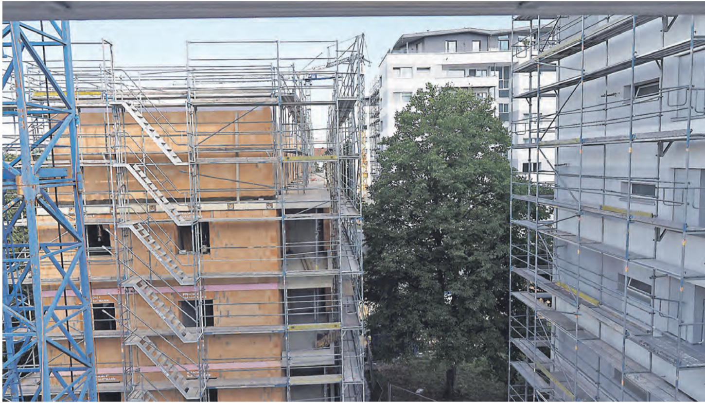
Auch die Baugenossenschaft Hegau kann derzeit Wohnungen nur schaffen, wenn bestehende Grundstücke massiv nachverdichtet werden, wie hier an den „Überlinger Höfen“ in Singens Süden. Die Baugenossenschaft hätte dieses Projekt aufgrund gekürzter Förderungen trotz

Selbst die große WOBAG in Konstanz als städtische Baugesellschaft verkündete bei ihrem Spatenstich in der Leipziger Straße für eine Obdachlosenunterkunft, dass jetzt angesichts der negativen Rahmenbedingungen erstmal Schluss sei mit neuen Projekten. Doch gerade in Konstanz ist der