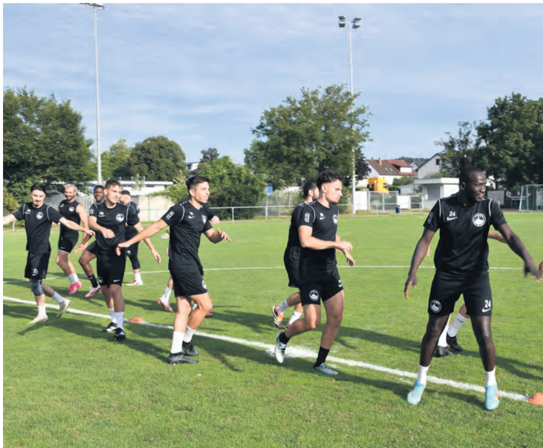
Schon seit einigen Wochen läuft die Saisonvorbereitung des Türkischen SV Singen auf Hochtouren.