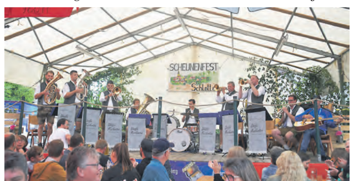
Am Sonntagnachmittag spielten vor der Scheune in Schlatt die 2023 gegründeten Dörfle Musikanten auf.

seit vielen Jahren reichte auch hier die namensgebende Scheune nicht für die BesucherInnen aus. Auf der Bühne sorgten der MV Kolbingen, der Fanfarenzug Castellaner aus Riedheim und die Dörfle-Musikanten für den musikalischen Rahmen. Auch dem Nachwuchs des Musikvereins Schlatt am Randen sowie der Tanzgruppe „Dynamite“ aus Überlingen am Ried gehörte die Bühne für einen Auftritt, ehe „Die Feierei“ für Stimmung am Abend sorgte. Einen Mix aus Seniorennachmittag und einem stimmungsvollen Abschied bis in die Nacht brachte der Montag, mit dem beliebten „Großen Bierabend“. Anja Kurz