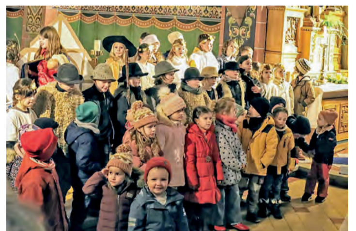
Als Hirten, Engel und Könige erzählten die Kinder aus Liggeringen bei ihrem Weihnachtsmusical die Weihnachtsgeschichte.