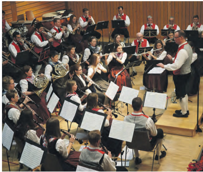
Einen beachtlich guten Auftritt legte der Musikverein Nenzingen bei seinem Jahreskonzert am letzten Samstagabend in der Rebberghalle unter der Leitung von Christian Senger hin.

Und nach der Pause nahm der Musikverein mit seiner Interpretation von „Madagaskar“ nach Hans