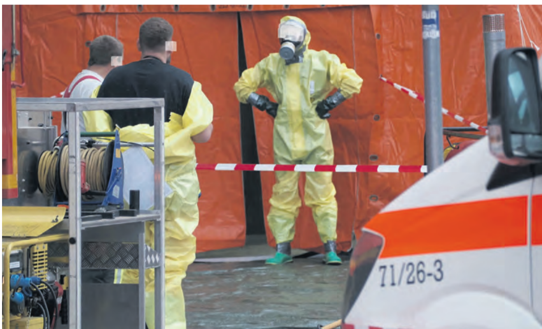
Hunderte von Einsatzkräften waren am 16. Mai aufgrund des Austritts eines Gefahrstoffes in der ganzen Singener Innenstadt im Einsatz. Dieser Vorfall erregte auch überregional große Aufmerksamkeit.

diese das erste Mal so richtig greifen müssen. Der Geburtstag unseres Grundgesetzes war in diesem Jahr nicht das einzige Jubiläum hier im Landkreis, so konnten viele Institutionen, Ortsteile, Kommunen oder auch Veranstaltungen große Jubiläen ihrerseits begehen, was in unseren Jahresrückblicken der jeweiligen Lokalgebiete bildreich aufgezeigt wird. Das Jahr 2024 war jedoch nicht nur geprägt von Jubiläen und großen Bewegungen, sondern auch von zahlreichen Abschieden, Neuanfängen und bedeutenden Ereignissen in den Bereichen Sport, Kultur, Politik und Wirtschaft. Für die Rubrik „Wer kommt, wer geht“, die wie die Rückblicke im politischen und wirtschaftlichen Bereich in unserer Ausgabe am 30. Dezember zu lesen sein wird, sowie bei allen weiteren Jahresrückblicken sei noch gesagt, dass hierauf kein Anspruch auf Vollständigkeit besteht.