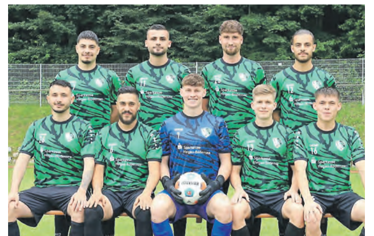
Die Neuzugänge des VfR Stockach wurden unlängst im Osterholzstadion des VfR Stockach vorgestellt.