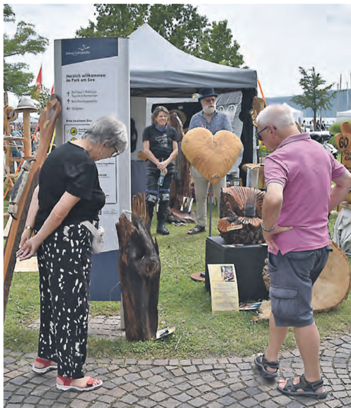
Rund 80 AusstellerInnen zeigten beim nun schon zwölften Kunsthandwerkermarkt „Sommer-Augenweide“ rund um das Ludwigshafener Zollhaus ihre vielfältigen Waren und Kunstwerke.