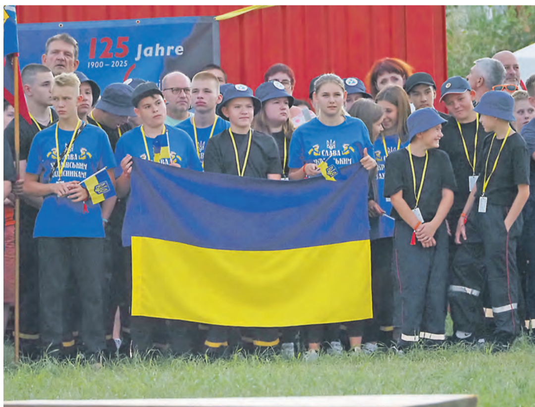
Auch eine Delegation aus der Singener Partnerstadt Kobeljaky ist beim Kreisjugendfeuerwehr-Zeltlager in Engen mit dabei, die hier einige unbeschwerte Tage verbringen soll.

Da war groß angerichtet. Genau 909 Mitglieder der Jugendfeuerwehren aus dem Landkreis, dieses Jahr sogar verstärkt durch eine Delegation der Feuerwehr aus der Singener Partnerstadt Kobeljaky , waren beim diesjährigen Jugendfeuerwehrlager in Engen. Das wurde am Mittwochabend, 24. Juli, mit dem Entzünden des Lagerfeuers und dem Hisen der Fahne durch die Jugendfeuerwehr Engen eröffnet.