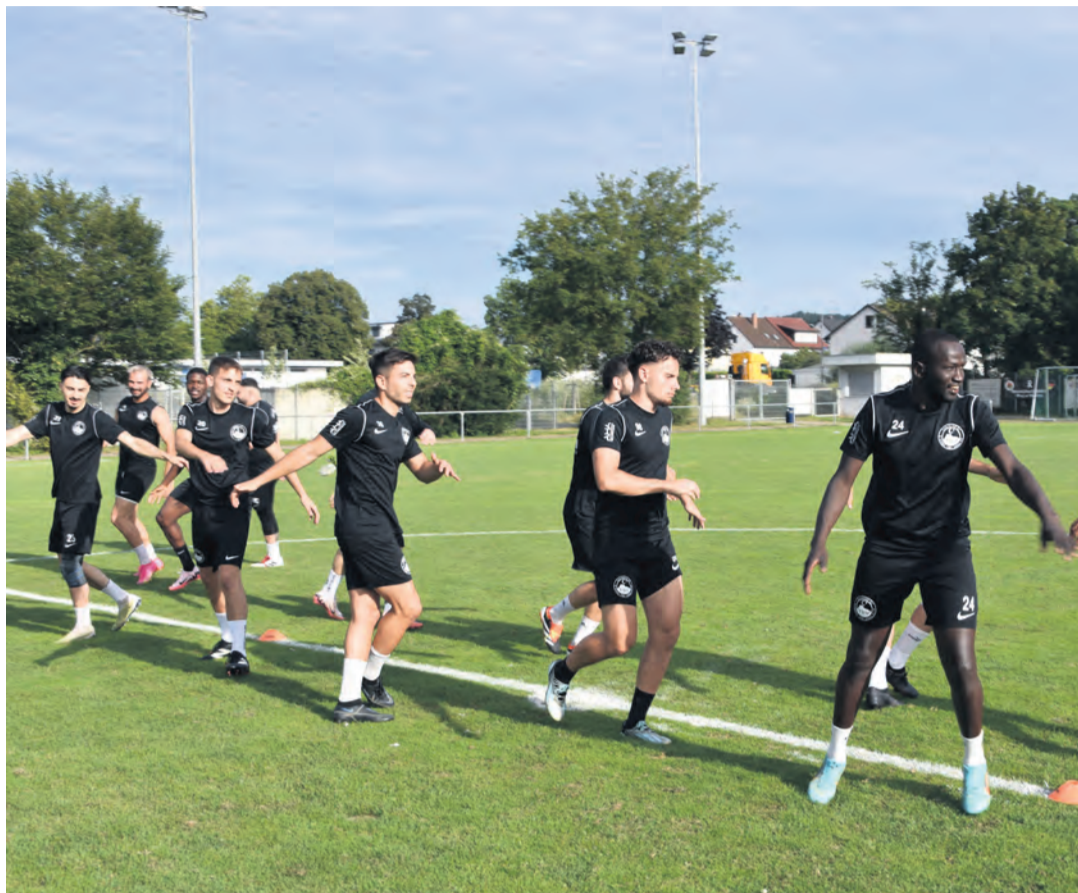
Schon seit einigen Wochen läuft die Saisonvorbereitung des Türkischen SV Singen auf Hochtouren.