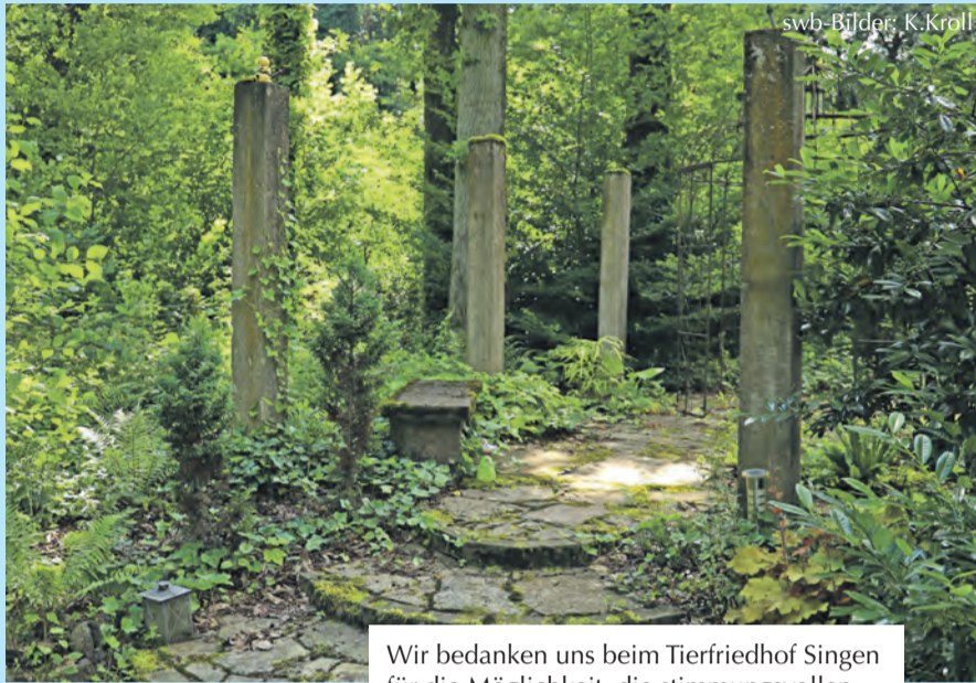
Wir bedanken uns beim Tierfriedhof Singen für die Möglichkeit, die stimmungsvollen Aufnahmen machen zu können. Verwaltung Tierfriedhof: 07731 / 92 11 11

Ihre Anzeigenberaterin für Familienanzeigen: