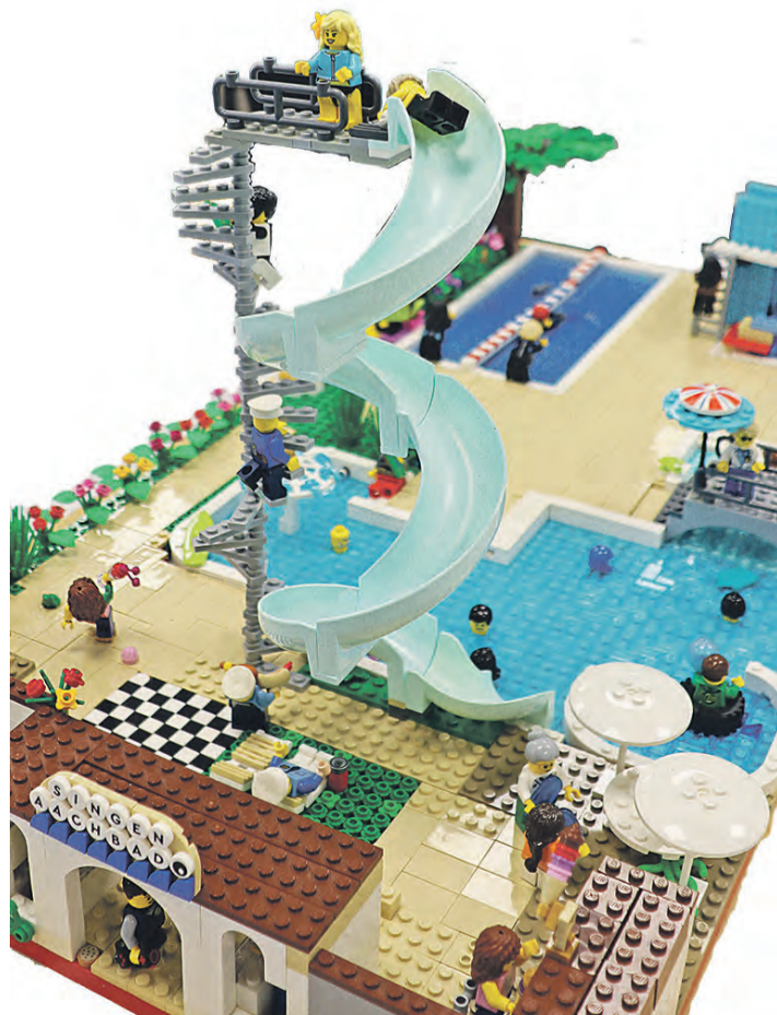
Mit einem Nachbau des Aachbads erreichte Celine Schmid beim Bauwettbewerb einen verdienten vierten Platz.