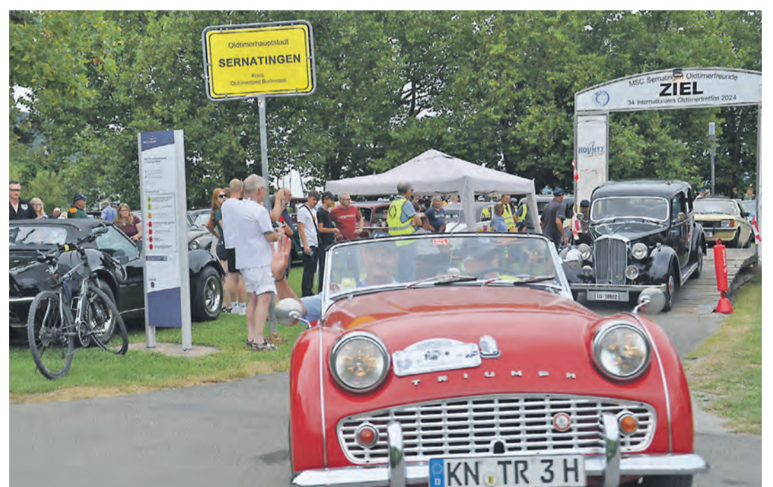
Um 13 Uhr ging es für die Oldtimer-Liebhaber los zur gemeinsamen Ausfahrt. Start- und Zielpunkt: die „Oldtimerhauptstadt Sernatingen“.

Jänicke zeigte sich sehr froh, dass die Oldtimer-Freunde den Termin durchgezogen und nicht wie andere Vereine komplett abgesagt haben. Die Veranstaltung sei ein voller Erfolg: Kurz vor Start der gemeinsamen Oldtimer-Ausfahrt um 13 Uhr, zu der alle teilnehmenden Oldtimer-Fahrer eingeladen waren, waren bereits rund 420 Fahrzeuge auf dem Gelände zu finden. Mit Autos, Nutzfahrzeugen und Motorrädern bietet der Spaziergang durch die „Oldtimer-