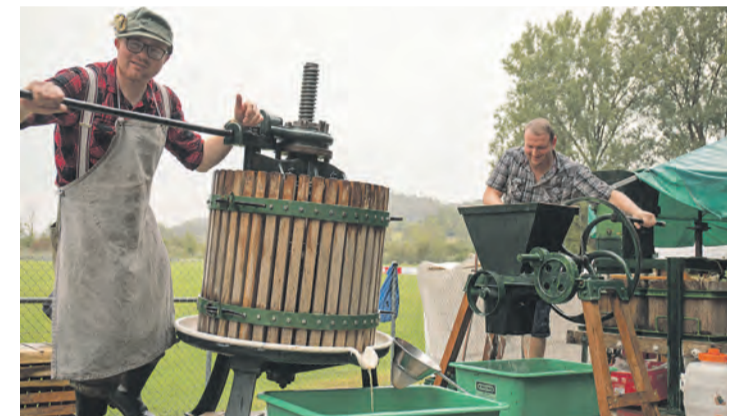
Auf der ländlichen Marktgasse können die Festgäste historischen Handwerksvorführungen, wie hier dem vom Narrenverein angebotenen Mosten, beiwohnen.