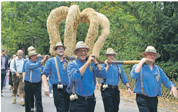
Zum bereits 64. Mal steigt in diesem Jahr die traditionelle Bohliger Sichelhenke.