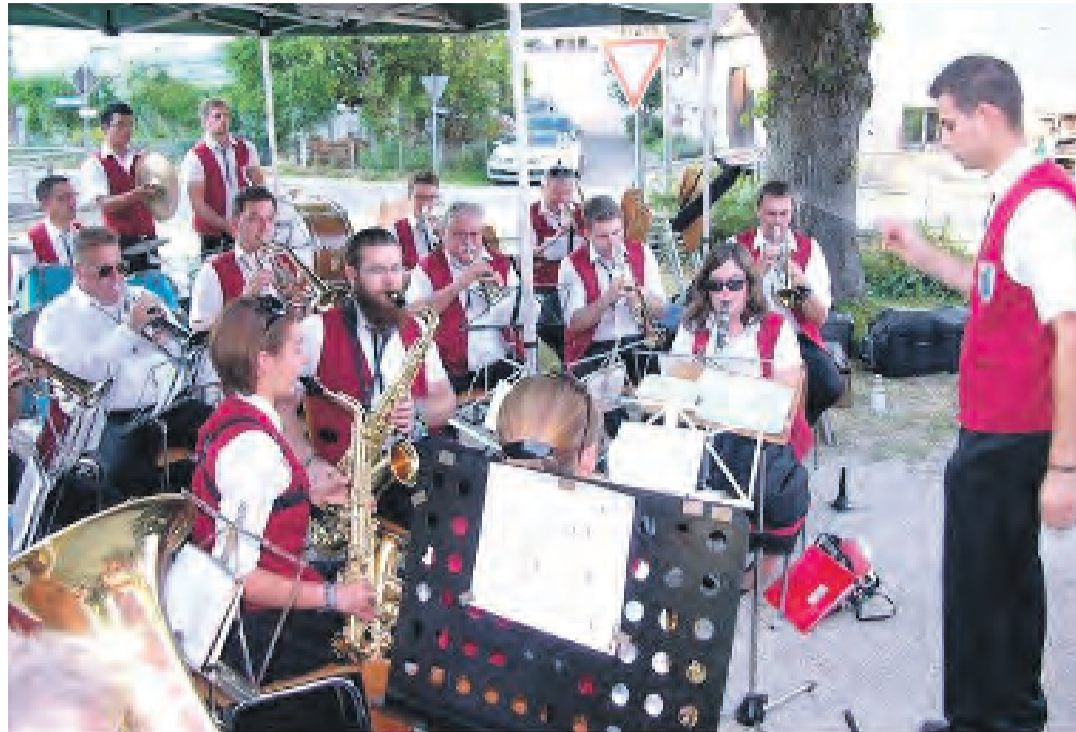
Apfelküchäfescht am Freitag, den 23. August 2024 ab 18:00 Uhr, am Samstag, den 24. August 2024 ab 15:00 Uhr und am Sonntag, den 25. August 2024 ab 9:30 Uhr auf dem Dorfplatz Engen-Zimmerholz. Fest mit Blasmusik und kulinarischen Spezialitäten rund um den Apfel. Weitere Infos unter www.engen.de.

Hesse Haus und Hesse Garten. Hermann-Hesse-Weg 2. Hesses historischer Garten. Fam. Hesse im eigenen Haus und Garten.Der histo-