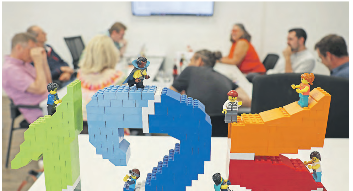
Alles andere als leicht war die Aufgabe der siebenköpfigen Jury, die die eingegangenen LEGO®-Modelle bewertete und schließlich ihre zehn Favoriten kürte.

Dabei waren der Fantasie (fast) keine Grenzen gesetzt: Gebaut werden konnte alles, was die Teilnehmerinnen und Teilnehmer mit der Stadt Singen verbindet. Und nicht nur die Jury, sondern das ganze Team des WOCHENBLATTs staunte über den Einfallsreichtum, der sich in den abgegebenen Werken zeigte. Von sechs bis 68 Jahren waren Jung und Alt beim Wettbewerb vertreten. Zunächst erstaunlich war, dass sage und