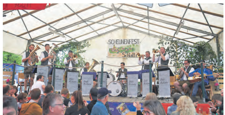
Am Sonntagnachmittag spielten vor der Scheune in Schlatt die 2023 gegründeten Dörfle Musikanten auf.

seit vielen Jahren reichte auch hier die namensgebende Scheune nicht für die BesucherInnen aus. Auf der Bühne sorgten der MV Kolbingen, der Fanfarenzug Castellaner aus Riedheim und die Dörfle-Musikanten für den musikalischen Rahmen. Auch dem Nachwuchs des Musikvereins Schlatt am Randen sowie der Tanzgruppe „Dynamite“ aus Überlingen am Ried gehörte die Bühne für einen Auftritt, ehe „Die Feierei“ für Stimmung am Abend sorgte. Einen Mix aus Seniorennachmittag und einem stimmungsvollen Abschied bis in die Nacht brachte der Montag, mit dem beliebten „Großen Bierabend“. Anja Kurz