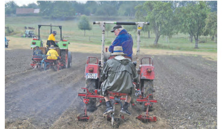
Besonderes Highlight des Traktortreffens bei der Homburg war die Live-Vorführung der Kartoffelernte aus verschiedenen Epochen.

Traktoren von uralt bis brandneu, andere Landmaschinen und Nutzfahrzeuge: Das und mehr gab es am Sonntag, 18. August, nahe der Festungsrue der Homburg zu bestaunen. Die Traktortreunde Stahringen hatten wieder zum Treffen der Szene eingeladen und stießen dem Regenwetter zum Trotz auf eine sehr gute Resonanz. Insbesondere bei der Vorführung der Kartoffelernte von damals bis heute war gut bedient, wer Gummistiefel, anderes wetterfestes Schuhwerk oder einen Schirm dabei hatte. Direkt auf dem Feld wurde Besucherinnen und Besuchern erklärt und vorgeführt, wie einst Kartoffeln gepflanzt und geerntet wurden, egal ob mit Pferd, vor dem Pflug oder mit einem Traktor. Als kleines Extra konnte man sich hier auch einen Sack Kartoffeln selbst sammeln und günstig kaufen. Der Einladung nach Stahringen