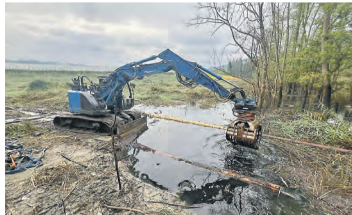
Ein Fichtenstamm wurde am Schluss der Pumpaktion dazu genutzt, den Abfluss frei zu stochnern. Schon der erste Versuch war geglückt.