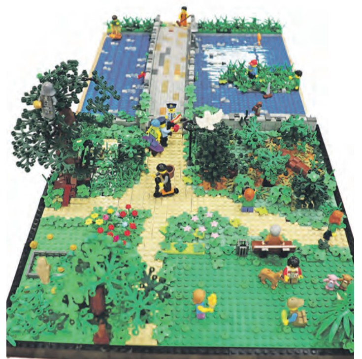
Tom Iwan und Ben Plennert bauten ein Stück des Stadtgartens nach und holten sich damit Platz zwei.

geheurer Aufwand, allein die richtige Größe und dafür die richtigen Teile zu bestimmen“, betonte Lange. Das Team des WOCHENBLATTs möchte sich an dieser Stelle noch einmal recht herz-