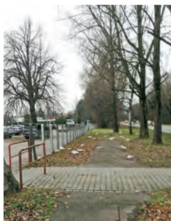
Unbekannte haben Zeitungen in der Landschaft verteilt.

Am Mittwoch, 11. Dezember, hat der Unbekannte den Alusingen-Platz in Singen sowie einen Bereich bei der Abfahrt Steißlingen und der Bundesstraßenbrücke verwüstet. Die Tat hat sich vermutlich zwischen 3 und 8 Uhr, ereignet. Das WOCHENBLATT bittet Zeugen, sich bei verwaltung@wochenblatt.net zu melden.