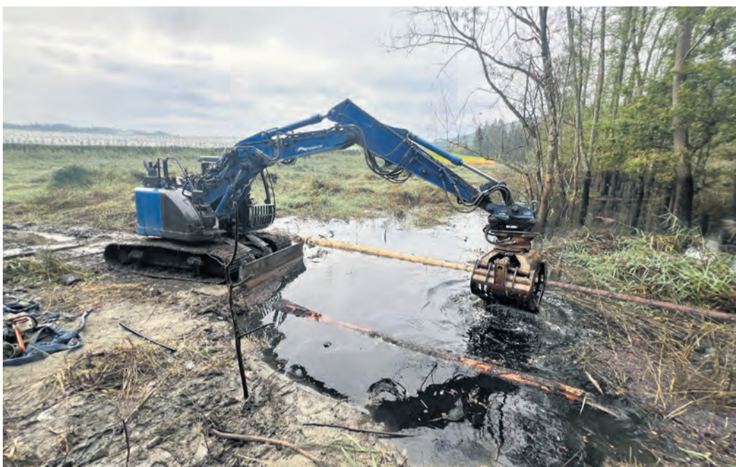
Ausgerechnet ein Biber sorgte im August für eine Überschwemmung und einen Großeinsatz neben der A 98 bei Ludwigshafen. Hierbei mussten sogar Bagger anrücken, um mit großen Holzstämmen als eine Art Zahnstocher die Löcher vom Gehölz und Dreck zu befreien.