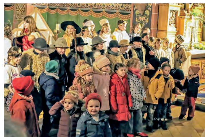
Als Hirten, Engel und Könige erzählten die Kinder aus Liggeringen bei ihrem Weihnachtsmusical die Weihnachtsgeschichte.