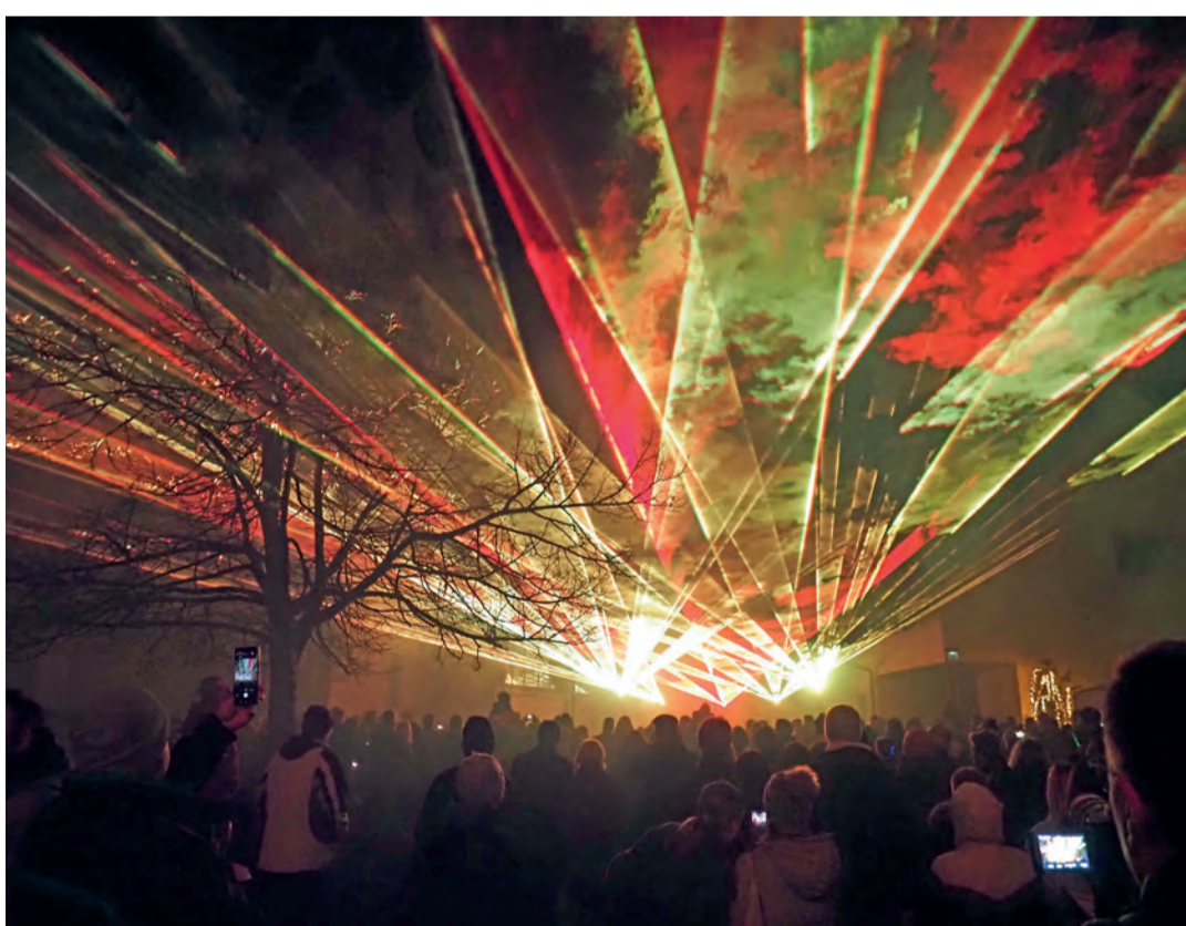
Die Lichter der Laser durchbrachen am Silvesterabend die Nacht und wurden insbesondere durch den Nebel in Szene gesetzt.

Es war ein besonderes Jubiläum für die BohlingerInnen gewesen, denn das ganze Jahr wurde gefeiert in den verschiedensten Formaten. Und zum Abschluss am Silvesterabend gab es noch einen ganz großen Kracher: Mit zwei Aufführungen einer Lasershow „J&C Veranstaltungstechnik“ auf dem Kirchplatz