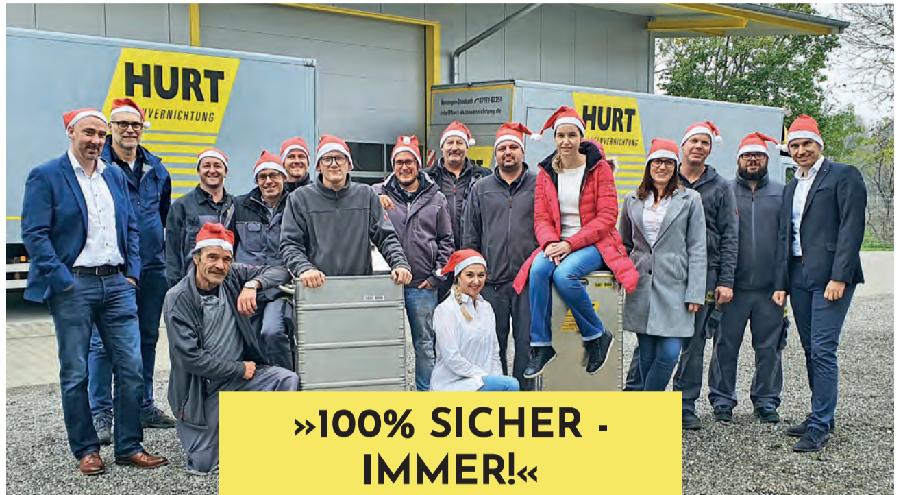
Das Team von HURT Aktenvernichtung - dem Spezialisten für professionellen und gesetzeskonformen Umgang mit analogen und digitalen Daten sowie Datenträgern, deren Vernichtung, Recycling und Remarketing.

Kontaktieren Sie uns info@hurt-aktenvernichtung.de Telefon: 077 71 / 62351