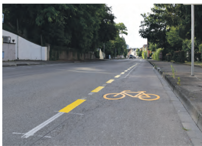
Das Singener Radwegkonzept wird weitergeführt. Das hat der Gemeinderat mehrheitlich beschlossen.

Heike Prahlow von der Planungsgemeinschaft Verkehr PGV-Alrutz war per Video aus Hannover zugeschaltet und gab eine Zusammenfassung des Sachstands und der potenziellen Maßnahmen. „Singen ist auf einem guten Weg“, fasste sie zusammen. Sie stellte einige