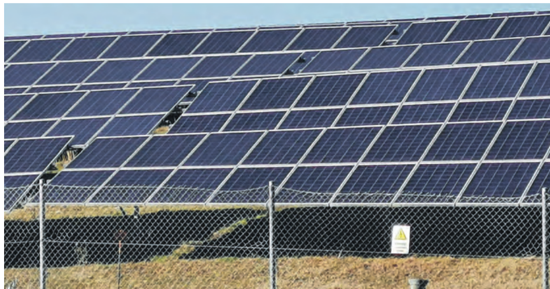
Ein Solarpark ähnlich dem bei Rickelshausen soll demnächst in den ehemaligen Worblingen Kiesgruben aus dem Gewinn „Krumme Reute“ entstehen.

Das Gelände wird von den Vorhabensträgern, wie auch vom Landratsamt in seiner