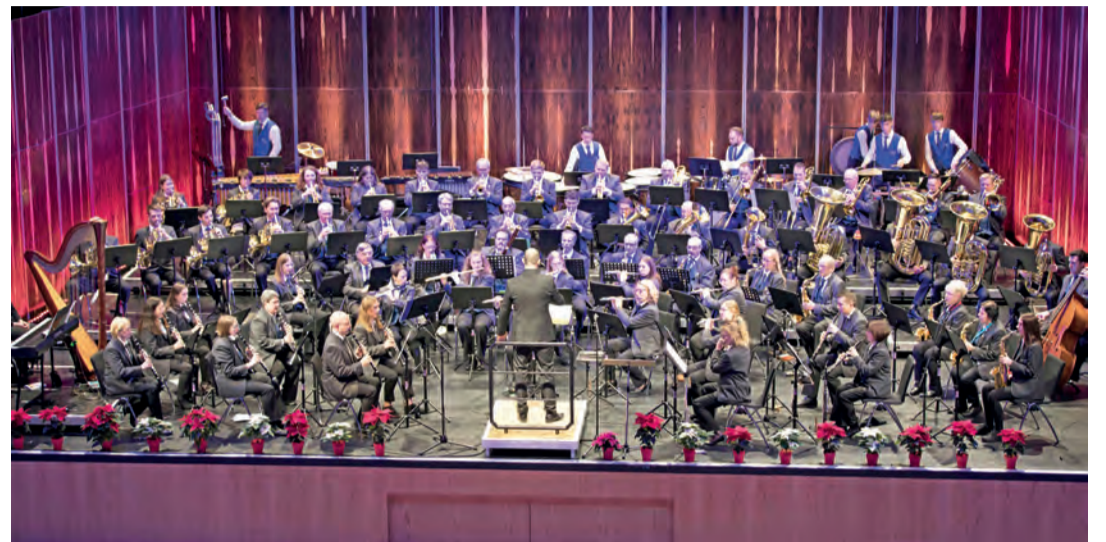
Mit dem Programm „Vermächtnisse“ spielten sich die Musizierenden des Blasorchesters mit einem Highlight nach dem Anderen in die Herzen des Publikums.

Nach der Pause wurden drei langjährige Mitglieder des Blasmusikverbands Hegau-Bodensee mit einer goldenen Eh-