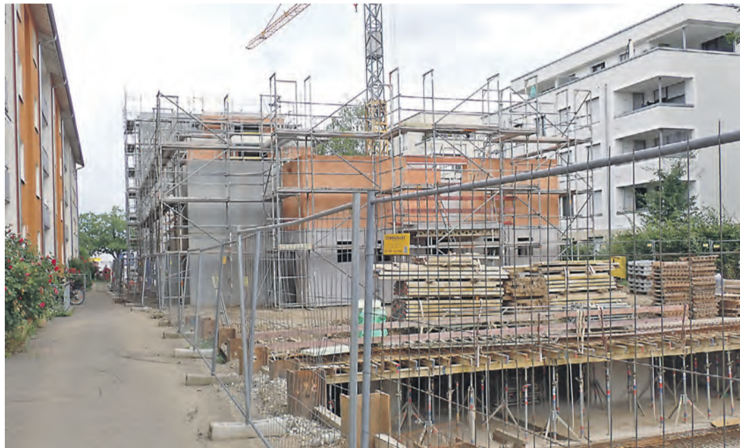
Wenn Baugenossenschaften derzeit noch bauen, geschieht das fast durchweg als Nachverdichtung, wie hier durch die Baugenossenschaft Familienheim Bodensee am Malvenweg in Singen. Grundstückskosten würden die Investitionen nochmals in unermessliche Höhen treiben.

Hohe Zinsen, die Grundstückspreise und vor allem eine schier unendliche Zahl an Auflagen, für private wie öffentliche Bauherren, wirken schon seit Jahren wie ein Bremsklotz. Gerade die Baugenossenschaften (BG), die sich schon als Grundidee den bezahlbaren Wohnraum auf die Fahnen geschrieben haben, sehen sich in ihrem Bemühen, die drückende Wohnungsknappheit zu mildern, blockiert. Vor über zwei Jahre hatte bereits ein Krisentreffen mit der Bundesbauministerin Klara Geywitz (SPD) und den Vertretern der regionalen BG in