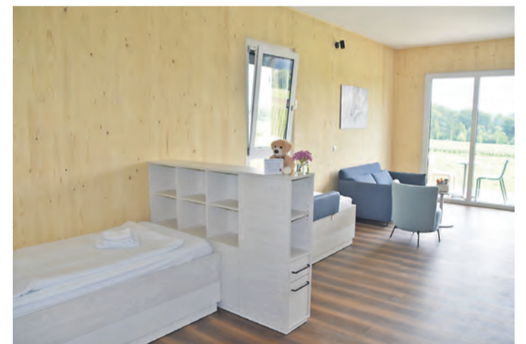
So sehen die Zimmer des neuen Eltern-Kind-Hauses des Hegau-Jugendwerks aus.