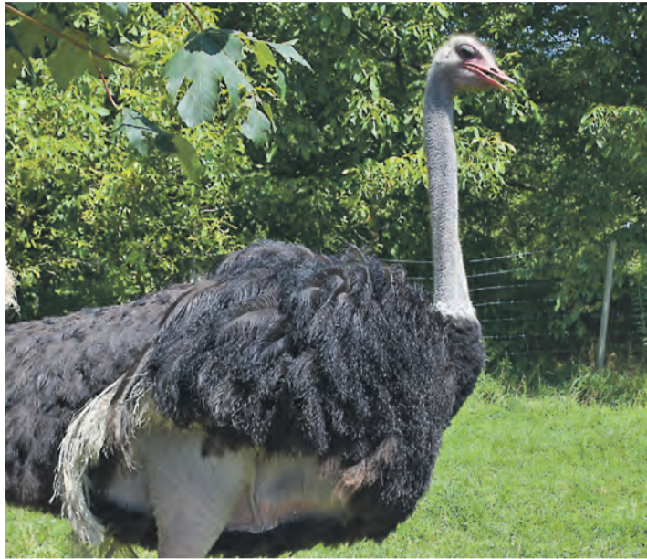
Über 200 Strauße leben in Airach.