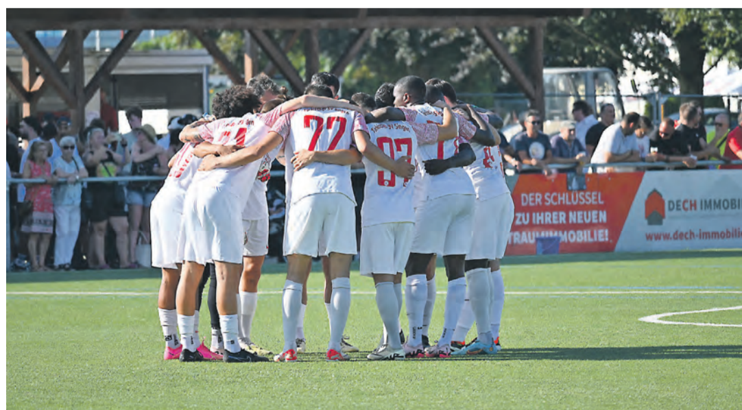
Ein Traumaufakt für den Türkischen SV Singen: Zum Saisonstart fegte der Aufsteiger die Heimmannschaft aus Rielasingen mit 0:4 vom Platz.