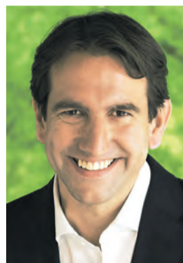
Andreas Jung, CDU

2. »Eine sinnvolle Lockerung wäre die Entkopplung des Normungsprozesses vom Bauordnungsrecht. Die aktuellen Bauvorschriften in Deutschland sind zu komplex und haben die Baukosten erhöht, ohne die Qualität wesentlich zu verbessern. Statt technischer maximaler Anforderungen sollten kostengünstige, auf Gefahrenabwehr beschränkte Standards im Fokus stehen. Dies würde die Baukosten senken und die Realisierung von Bauprojekten beschleunigen. Es dürfen außerdem keine neuen Regelungen eingeführt werden, die sich Baukosten-treibend auswirken. Mit dem neuen Gebäudetyp E-Gesetz wird es künftig möglich sein, von bestimmten Komfortstandards abzuweichen, was den Bauprozess vereinfacht.«