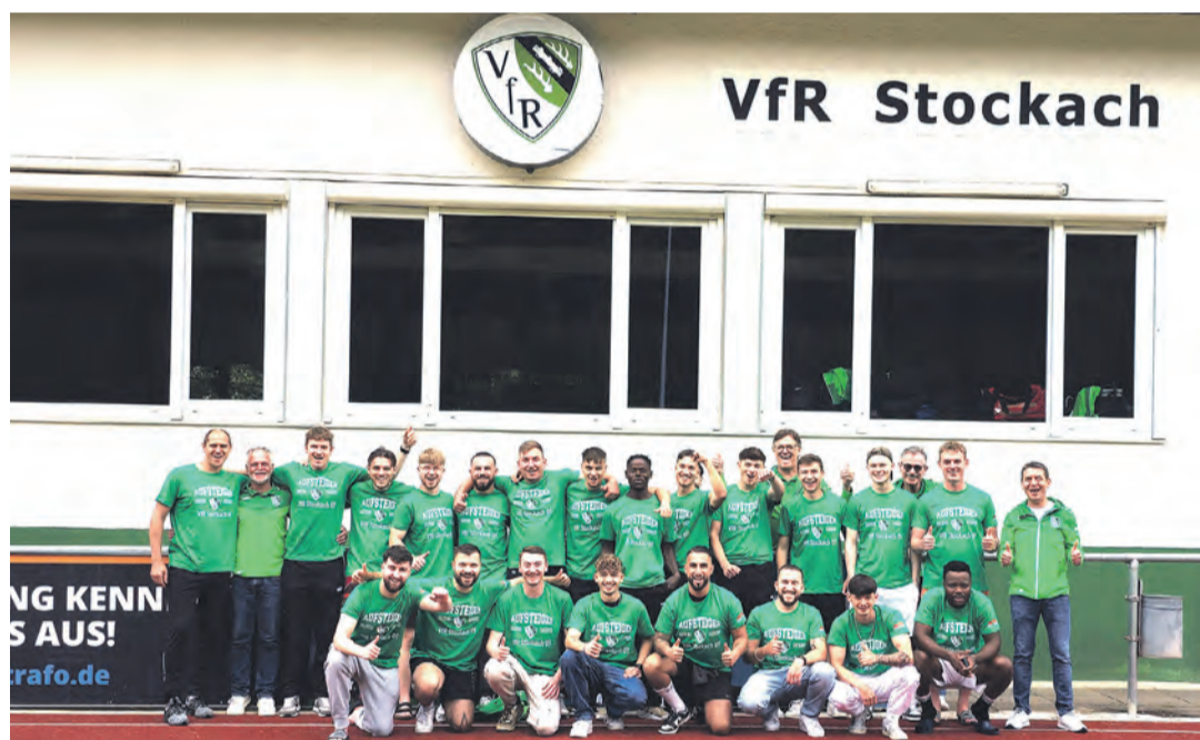
Die zweite Mannschaft des VfR Stockach spielt in der kommenden Saison erstmals in der Kreisliga A.