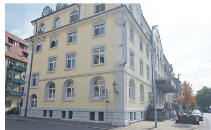
Das Hebammen-geleitete Gesundheits-Zentrum „radofine“ steht noch immer vor vielen Zukunftsfragen.