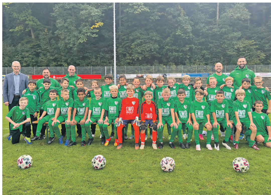
Die intensive Nachwuchsförderung wie beispielsweise hier die E-Junioren liegt dem Verein sehr am Herzen.