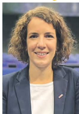
Dr. Lina Seitzl, SPD