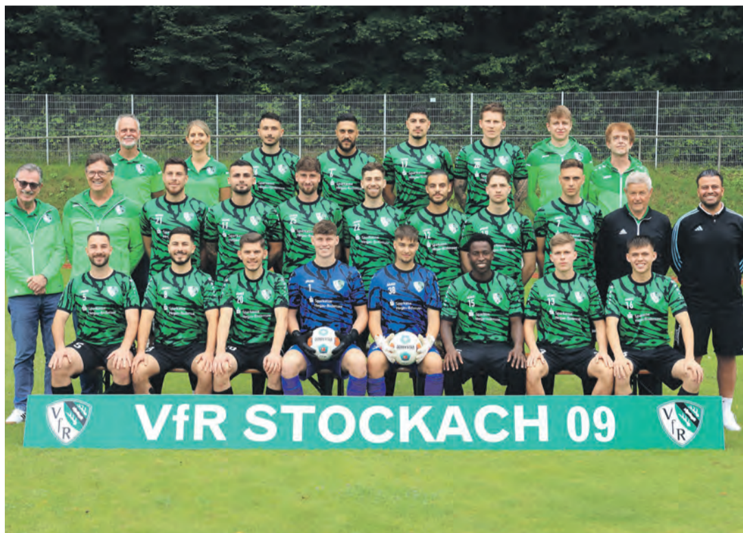
Auch in der Saison 2024/25 ist es für die erste Mannschaft des VfR Stockach das Ziel, im oberen Drittel mitzuspielen.