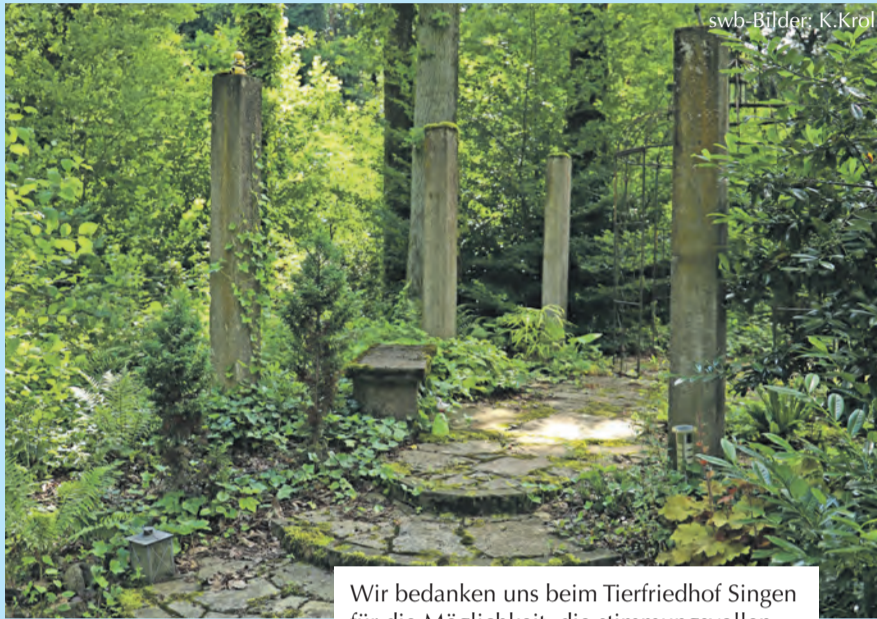
Wir bedanken uns beim Tierfriedhof Singen für die Möglichkeit, die stimmungsvollen Aufnahmen machen zu können. Verwaltung Tierfriedhof: 07731 / 92 11 11

Ihre Anzeigenberaterin für Familienanzeigen: