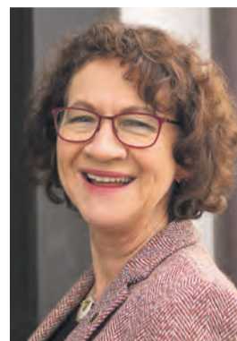
Dorothea Wehinger, Die Grünen

2. »Um dem entgegenzuwirken, hat die Landesregierung in Baden-Württemberg daher die finanziellen Mittel über die letzten Jahre deutlich erhöht. Allein für 2024 stehen knapp 551 Millionen Euro bereit. Zudem hat das Kabinett ein großes Maßnahmenpaket vorgelegt, das unter anderem die Schaffung von Wohnraum erleichtern soll. Durch die Beschleunigung der Genehmigungsverfahren und die Angleichung von baulichen Standards an Praktikabilität wird die Bautätigkeit stärker angekurbelt. Es gibt noch große Potenziale, wie beispielsweise durch Aufstockung, Umnutzung und Umnutzung von bestehenden Flächen. Hierfür haben wir die Landesbauverordnung so reformiert, dass die Umnutzung von Büro- zu Wohnräumen im Innenbereich verfahrensfrei möglich ist. Es ist aber auch klar, dass wir noch mehr tun müssen, um besser voranzukommen.«