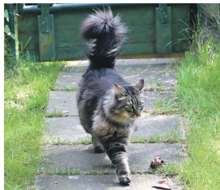
Eine Norwegische Waldkatze

stimmt – egal ob mit Tier oder Mensch. Zu den Tieren hat sie eine sehr enge Bindung aufgebaut: „Manche darf ich anfassen, aber wild ist wild.“ Für die Haltung mancher Tiere, wie den Servalen, gibt es gesetzliche Vorgaben, etwa zur Größe der Gehege und dass es Rückzugsmöglichkeiten geben muss. „Wenn sie schon in Gefangenschaft sind, soll es ihnen gut gehen, sollen sie Platz haben, um zu laufen.“ Bei Lange in Hohenfels leben die Katzen in beheizbaren Hütten, fast alle einzeln in durch Gitter und Türen abgegrenzten Zimmern. Zu ihrem eigenen Freigehege haben sie immer Zutritt. Nur die Norwegischen Waldkatzen – alle Geschwister – leben wie ein Rudel zusammen und die Serval-Katze Ayomi hat einen Hauskater als Kumpel bei sich. Aus ganz Deutschland erreichen Nada Lange Anfragen, ob sie weitere Katzen unterbringen könne. Dazu habe sie allerdings nicht genug Platz. Also noch nicht: Der Bauernhof und das zugehörige Grundstück bieten massig Platz und der Bau weiterer Gehege stehe quasi kurz bevor. Außerdem will sie eine gemeinnützige Stiftung aufbauen, die den Schutz und die Versorgung der Tiere auf dem Grundstück langfristig sichern soll. Einbringen können sich Privatpersonen oder Unternehmen durch (finanzielle) Unterstützung. Auch für die Zukunft will sie vorsorgen: „Ich suche nach einem Nachfolger, der zu 100 Prozent Tierfreund ist.“ Anja Kurz