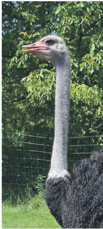
Auch hier in der Region gibt es einige tierische Exoten zu finden.