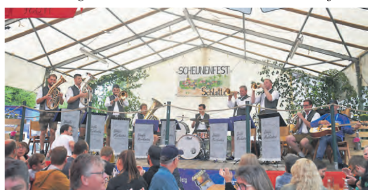
Am Sonntagnachmittag spielten vor der Scheune in Schlatt die 2023 gegründeten Dörfle Musikanten auf.

seit vielen Jahren reichte auch hier die namensgebende Scheune nicht für die BesucherInnen aus. Auf der Bühne sorgten der MV Kolbingen, der Fanfarenzug Castellaner aus Riedheim und die Dörfle-Musikanten für den musikalischen Rahmen. Auch dem Nachwuchs des Musikvereins Schlatt am Randen sowie der Tanzgruppe „Dynamite“ aus Überlingen am Ried gehörte die Bühne für einen Auftritt, ehe „Die Feierei“ für Stimmung am Abend sorgte. Einen Mix aus Seniorennachmittag und einem stimmungsvollen Abschied bis in die Nacht brachte der Montag, mit dem beliebten „Großen Bierabend“. Anja Kurz