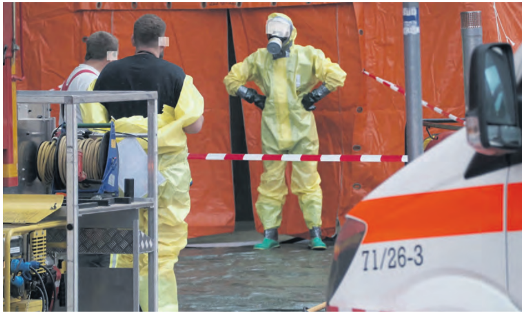
Hunderte von Einsatzkräften waren am 16. Mai aufgrund des Austritts eines Gefahrstoffes in der ganzen Singener Innenstadt im Einsatz. Dieser Vorfall erregte auch überregional große Aufmerksamkeit.

diese das erste Mal so richtig greifen müssen. Der Geburtstag unseres Grundgesetzes war in diesem Jahr nicht das einzige Jubiläum hier im Landkreis, so konnten viele Institutionen, Ortsteile, Kommunen oder auch Veranstaltungen große Jubiläen ihrerseits begehen, was in unseren Jahresrückblicken der jeweiligen Lokalgebiete bildreich aufgezeigt wird. Das Jahr 2024 war jedoch nicht nur geprägt von Jubiläen und großen Bewegungen, sondern auch von zahlreichen Abschieden, Neuanfängen und bedeutenden Ereignissen in den Bereichen Sport, Kultur, Politik und Wirtschaft. Für die Rubrik „Wer kommt, wer geht“, die wie die Rückblicke im politischen und wirtschaftlichen Bereich in unserer Ausgabe am 30. Dezember zu lesen sein wird, sowie bei allen weiteren Jahresrückblicken sei noch gesagt, dass hierauf kein Anspruch auf Vollständigkeit besteht.