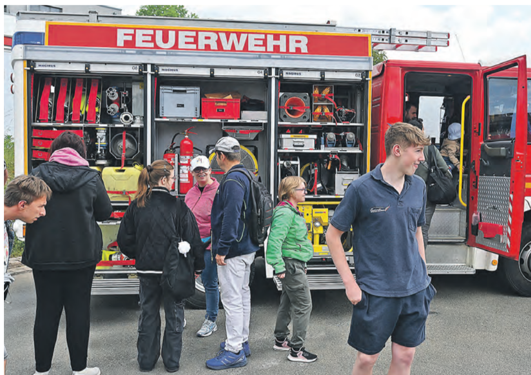
Großes Interesse weckten die Feuerwehrfahrzeuge, die man sich beim Tag der offenen Tür aus der Nähe ansehen konnte.