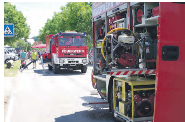
Auch die Feuerwehr ist beim Dorffest wieder am Start mit Vorführung, Fahrzeugen und Spielen.

fahrzeuge. Zudem baut sie eine Spielstraße auf, mit der junge Besucherinnen und Besucher ihren Spaß haben werden. Ihre Zielsicherheit können Gäste bei der Torwand des Sportvereins Aach-Eigeltingen unter Beweis stellen. Die Helfer-vor-Ort-Gruppe gibt Einblicke in ihre wichtige Arbeit, die im Ernstfall Leben retten kann. Das Novum des Festes - die Jobmesse - findet am Sonntag von 11 Uhr bis 16 Uhr in der Krebsbachhalle statt. Hier