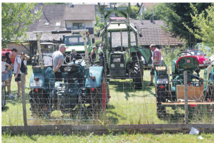
Auch beim 21. Eigeltinger Dorffest ist die beliebte Oldtimerausstellung mit dabei.