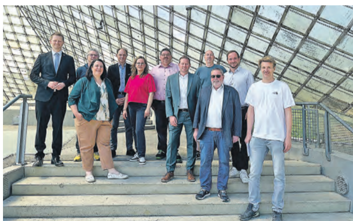
Veranstalter und Beteiligte am Radolfzeller Konzertsegel, wo vom 4. bis 7. Juni wieder das Seefestival stattfindet.

Zum Auftakt am 4. Juni werden fast 100 MusikerInnen des Jugendblasorchesters und des Kammerorchesters+ der Musikschule Radolfzell das Bodenseeufer in eine unvergleichliche Atmosphäre tauchen. Mit ihrem Programm „Filmklassik in Concert“ knüpfen sie an ihre überaus erfolgreiche Premiere im Milchwerk an und präsentieren Highlights wie „Star Wars“, „James Bond“ und „The Typewriter“ auf der Open-Air-Bühne. Am Donnerstag wird der irische Weltstar Ronan Keating die Bühne betreten und mit seiner unverkennbaren Stimme das Publikum verzaubern. Mit Hits wie „When You Say Nothing at All“ und „Life is a Rollercoaster“ wird er für Gänsehautmomente sorgen. Der Freitag gehört der mehrfach ausgezeichneten österreichischen