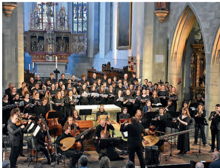
Mehr als epochal wirkte der gesamte Klangkörper zu Monteverdis Marienvesper, das am 18. Mai im Radolfzeller Münster zur Auf-führung kam.