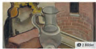
11. März 2025 um 14:00 Städtisches Museum + Galerie · Engen

Sonderausstellung "Sachlich - Kritisch - Magisch. Der neue Realismus um 1925" Aus der Sammlung Frank Brantzt