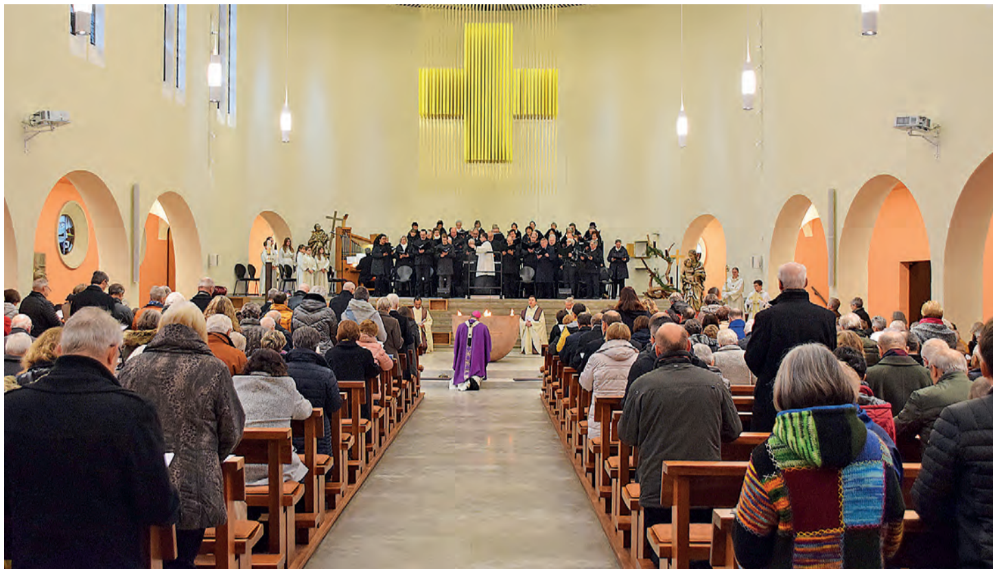
Der Gottesdienst zur Altarweihe in der damals neu renovierte Kirche St. Oswald im Jahr 2022. So gut besucht sind Gottesdienste heute eher selten.