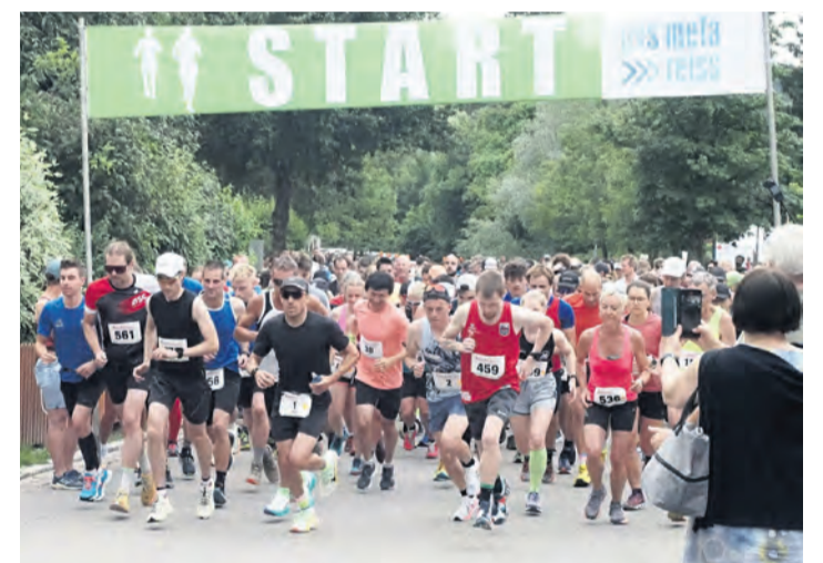
Zum ersten Mal wird der Schienerberglauf in diesem Jahr über die Halbmarathondistanz gehen.