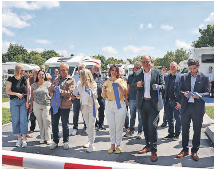
Der Wohnmobilstellplatz wurde feierlich von OB Bernd Häusler gemeinsam mit den französischen Partnern von Camping-Car Park und Vertreterinnen und Vertretern der Stadt Singen, die mitgewirkt haben, eröffnet.

Die Idee zum Bau des neuen Stellplatzes basiert auf den kontinuierlich steigenden Besucherzahlen und dem zunehmenden Wunsch vieler Reisender nach zentral gelegenen Stellflächen. Bereits im Jahr 2000 – nach dem Ende der Landesgartenschau – hatte die Stadt Singen erste Stellplätze nahe der Offwiese eingerichtet. Damals noch mit einfacher Entsorgungsstation, wurde die Infrastruktur über die Jahre schrittweise erweitert, unter anderem durch eine Stromversorgung. Die wachsende Beliebtheit des Urlaubs mit dem Wohnmobil hat die Stadt nun zum Anlass genommen, das Angebot umfassend zu modernisieren und den neuen Stellplatz mit Blick auf Komfort, Digitalisierung und Nachhaltigkeit umzusetzen. Besonders die