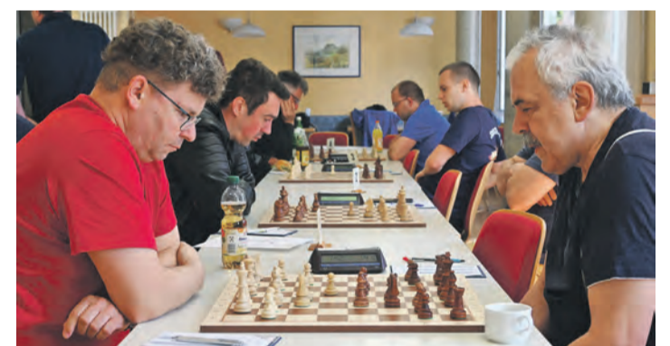
Beim letzten Spiel der Saison konnte der Schachclub Singen seine Siegesserie fortsetzen.

Mit einem klaren 6,5 :1,5-Erfolg gegen Meßkirch machte die erste Mannschaft des Schachclubs Singen den Meistertitel perfekt gemacht. Dennoch gaben sich die Schachspieler aus Meßkirch nicht kampfflos geschlagen und konnten den Singenern immerhin einen Sieg und ein Remis abringen.