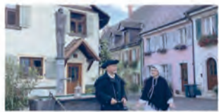
11. März 2025 um 19:00 Freilichtbühne hinterm Rathaus · Engen