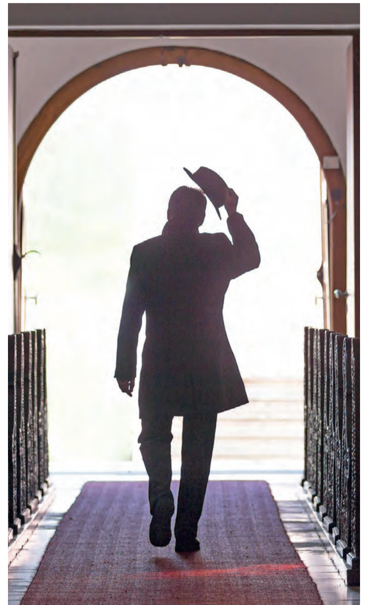
Das Thema Kirchaustritt beschäftigt derzeit viele Glaubensgemeinschaften.