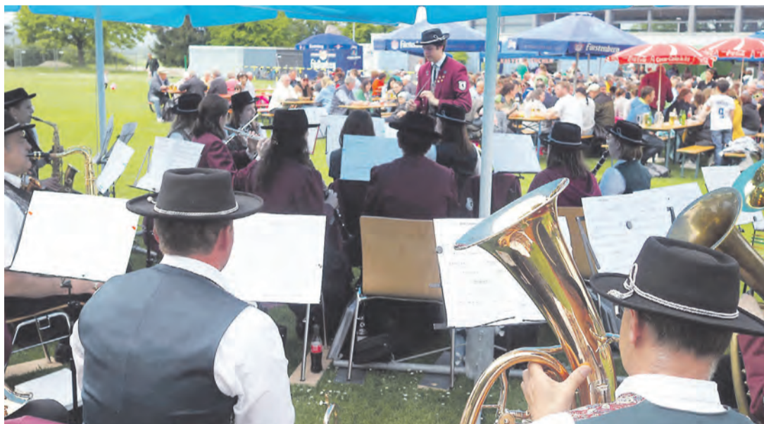
Auch in diesem Jahr hofft der Musikverein Friedingen beim Frühlingsfest am 29. Mai auf zahlreiche Besucher auf dem Sportplatz vor der Schlossberghalle.

Der Vatertag ist für viele Menschen auch hier in der Region bei vielen Menschen ein fester Brauch in jedem Jahreskalender, hat er sich seit vielen Jahrhunderten schon mittlerweile etabliert.