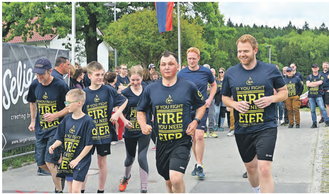
Die einen ließen es beim „Fit for firefighting“, mit dem das Fest der Feuerwehr Hoppetenzell eröffnet wurde, etwas ruhiger angehen. Andere machten sich - wie hier gezeigt - zügiger auf den Weg.