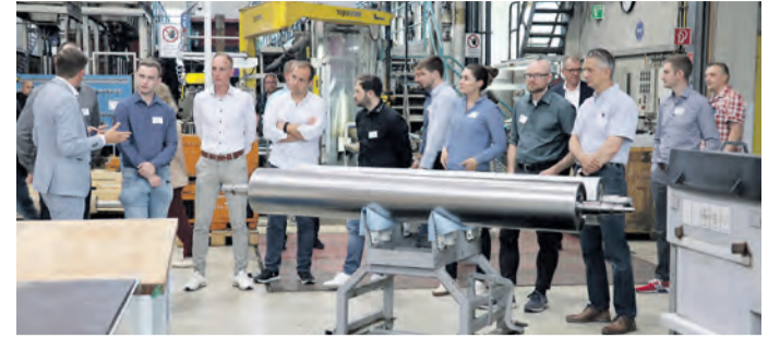
Praxisnahe Einblicke konnten die Gäste bei der diesjährigen Fachtagung gewinnen.

Bereits zum sechsten Mal fand am 15. Mai die Fachtagung der Topocrom GmbH statt. Über 50 Kunden aus verschiedenen Industriebetrieben hatten am Vormittag im Zollhaus Ludwigshafen die Gelegenheit, einen genaueren Einblick in die Produktions- und Arbeitsprozesse des Unternehmens zu erhalten. Im Zollhaus Ludwigshafen lauschten die Gäste verschiedenen Fachvorträgen von Referentinnen und Referenten aus unterschiedlichen Branchen. Neben den externen Vorträgen präsentierte auch die Topocrom GmbH eigene Inhalte. Nach einer gemeinsamen Mittagspause in Stockach, standen Networking