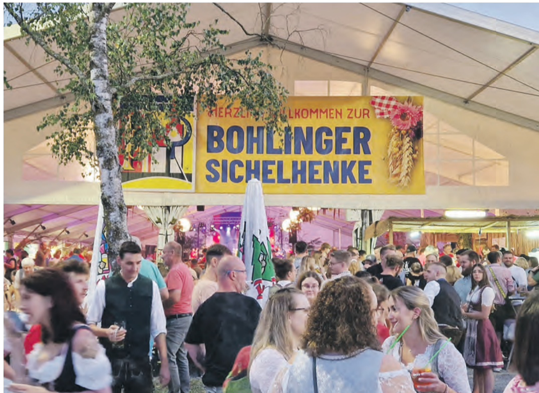
Bohlinger Sichelhenke von Freitag, den 22. August bis Montag, den 25. August auf dem Festplatz, Zum Espen 27, Singen. Es ist wieder soweit. Nun schon zum 65. mal lockt die Bohlinger Sichelhenke zahlreiche Festgäste auf den Festplatz im Singener Stadtteil. Neben einigen musikalischen Highlights steht das Programm auch in diesem Jahr wieder ganz im Zeichen der Tradition. Weitere Infos unter www.sichelhenke.de .

Stadtmuseum, Salmannswilerstraße 1 | 14:00 Uhr | KLICK – Fotografieren einer verlorenen Zeit. Unter sachkundiger Begleitung verfolgen die Besucher den Weg Gustavs im Ersten Weltkrieg und erhalten bewegende Einblicke in die Briefe an seine Familie daheim in Stockach. Info: www.stadtmuseum-stockach.de .