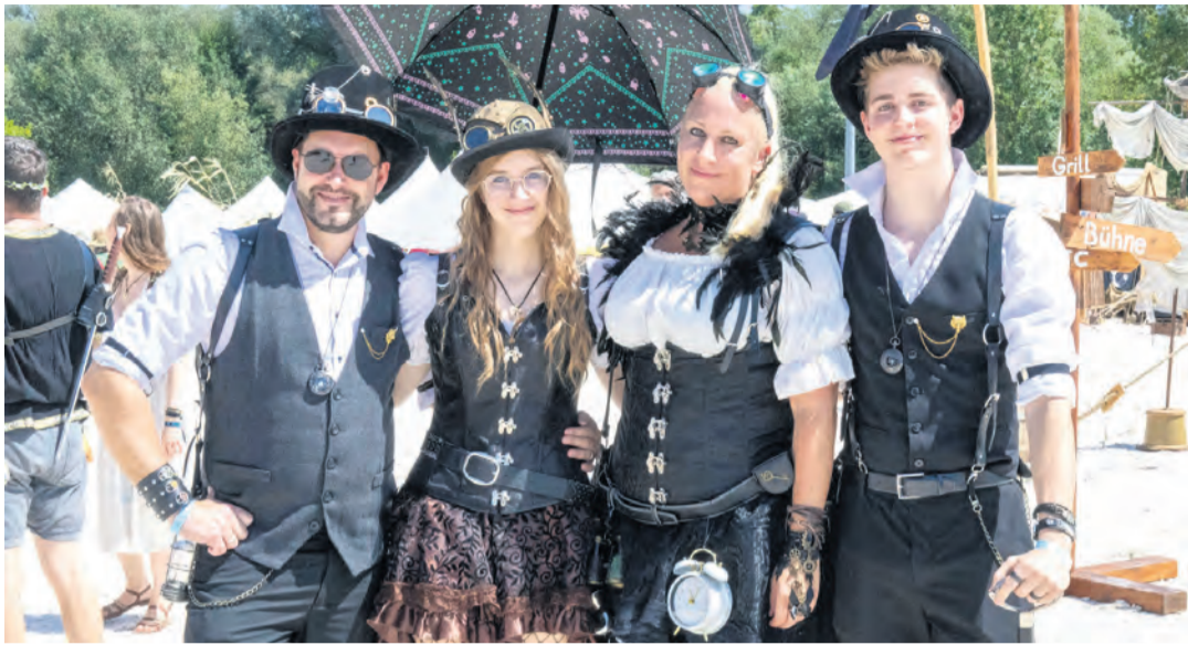
Edle Rittersleut und wilde Nordmänner, postapokalyptische Kriegerinnen und verwegene Piraten, finstere Schurken und ehrenvolle Heroen - dies und mehr gab es auf dem Großen Treffen zu sehen.