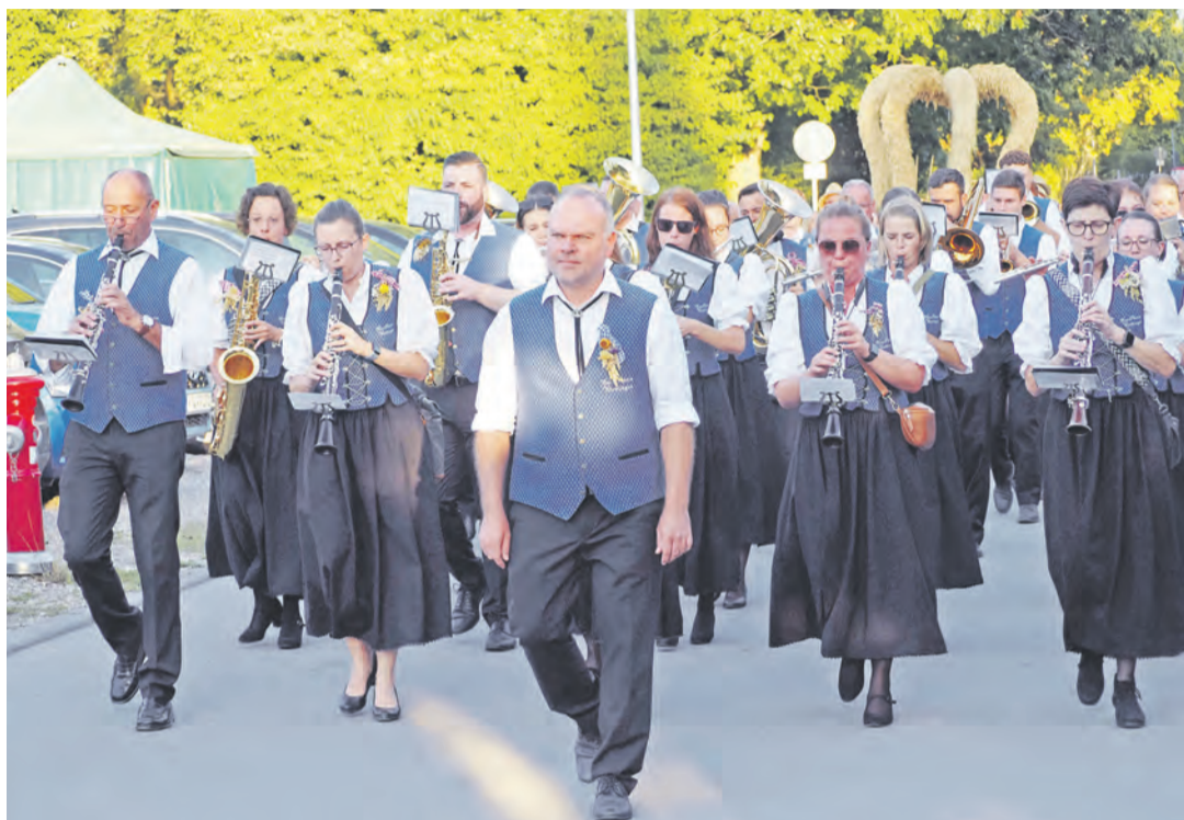
Tradition bei der in diesem Jahr 65. Bohlinger Sichelhenke wird auch wieder der Einzug der Erntekrone haben.