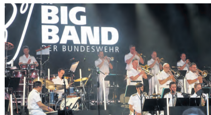
Auch in diesem Jahr wird die Big Band der Bundeswehr am 21. August die Besucher mit ihrer flotten Musik beim Benefizkonzert der Bürgerstiftung Radolfzell am Konzertsegel begeistern.