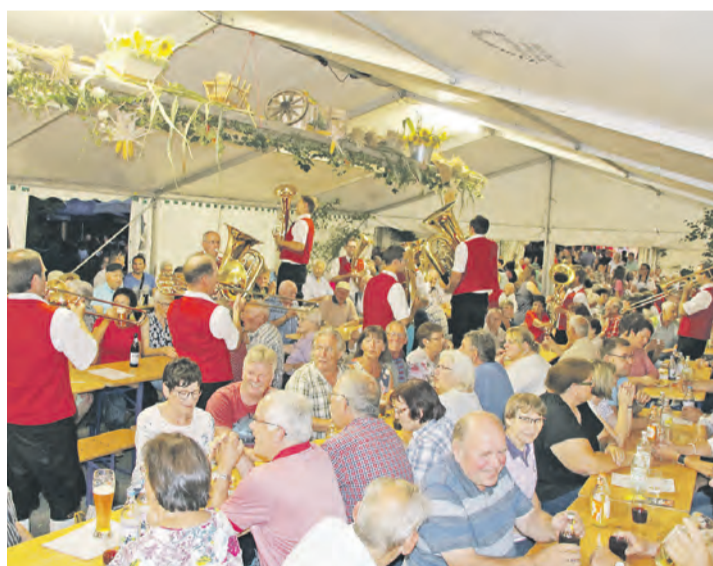
Willkommen geheißen wird man in Weil immer - insbesondere gilt das vom 23. bis zum 25. August, wenn wieder das traditionelle Weiler Dorffest zum Mitfeiern einlädt.

Weil's so schön ist, wird weiter gefeiert: Nach dem Musikfest der Stadtkapelle Tengen und dem Geburtstagsfest zum 50-Jährigen der Gemeinde lädt nun die Dorfgemeinschaft Weil wieder ein zum Dorffest, das in diesem Jahr zum 34. Mal stattfindet und sogar einen Tag früher startet. Vom 23. bis zum 25. August erwartet die Besucher wieder ein Potpourri an Angeboten.