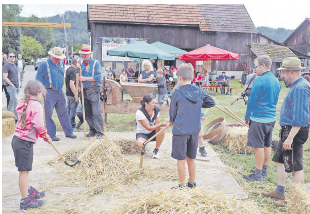
Bei der historischen Marktasse kann wieder traditionelles Handwerk bestaunt und selbst ausprobiert werden.

Vom 22. Bis 25 August ist es im Singener Stadtteil Bohlingen wieder so weit. Dann nämlich wird die 65. Bohlinger Sichelhenke zahlreiche Festgäste auf den großen Festplatz locken. Neben einigen musikalischen Highlights ist auch in diesem Jahr der Fokus auf jede Menge Tradition.