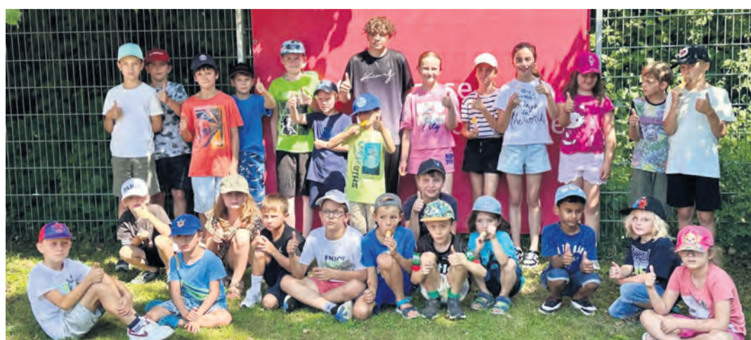
Zahlreiche Kinder und Jugendliche konnten bei den Stadtjugendmeisterschaften des BGC Singen und der Stadtjugendpflege ihr ganzes Minigolf-Können unter Beweis stellen.