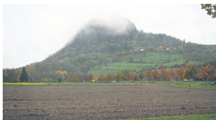
Auf diesem Grundstück in Singen-Nord soll das neue Klinikum entstehen.

Inhalt des Vorentwurfs ist auch die verkehrliche Erschließung, die Sonja Martin zufolge über die umgebenden Straßen, die L191 und die Nordstadtanbindung und über den geplanten beidseitigen Schienenhaltepunkt als Anbindung an den Seehas erfolgen. „Grün- und Erholungsflächen, die auch als Ausgleichsflächen dienen, bieten