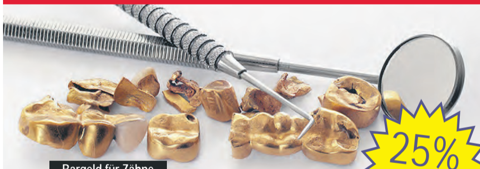
Bargeld für Zähne