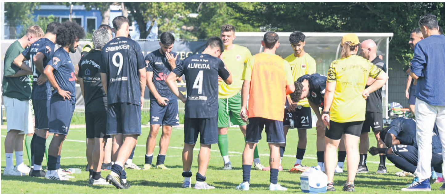
Die Enttäuschung beim Türkischen SV Singen war nach der knappen Heimmiederlage gegen den SV Oberachern sichtlich groß.

„Hut ab vor eurer Leistung, ihr habt richtig gekämpft und uns das