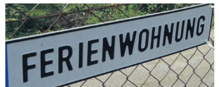
Anträge zur Umnutzung von Wohnraum in Ferienwohnungen beschäftigen den Mooser Gemeinderat immer häufiger.

So stand auch in der letzten Gemeinderatssitzung vor der Sommerpause gleich drei solcher Nutzungsänderungsanträge zur Verfügung. Dem Rat ist wohl bewusst, dass die Förderung des gewinnbringenden Tourismus nicht aus den Augen verlieren dürfen und pflegen daher akribisch den Übersichtsplan aller gemeldeten Ferienwohnungen. Dieser hilft