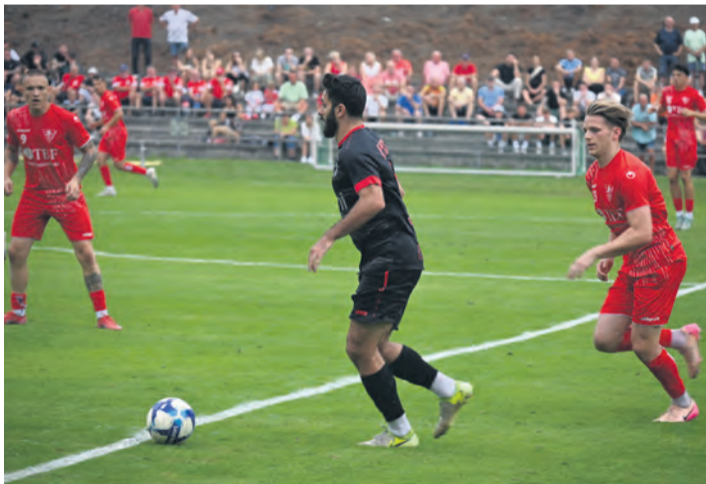
Zum Auftakt der neuen Verbandsliga-Saison trennten sich der ESV Südster Singen und der 1. FC Rielasingen-Arlen mit einem 1:1-Remis.