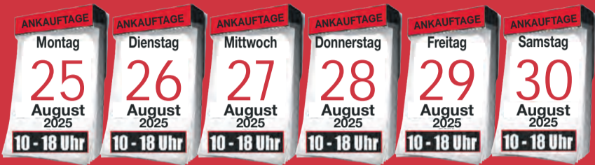
Ankauf von Krokotaschen

BARES FÜR WAHRES - DIE EXPERTEN SIND FÜR SIE VOR ORT