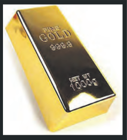
Ankauf Goldbarren Inhaber: W.