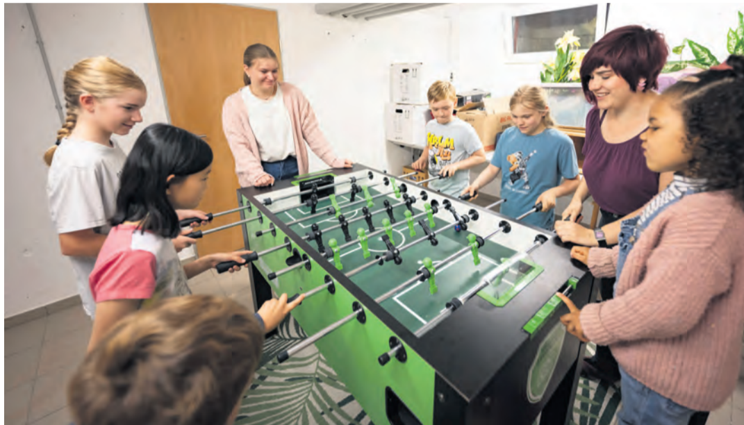
Gemeinsame Aktivitäten gehören zum Alltag der jungen Schützlinge im Pestalozzi Kinder- und Jugenddorf. Seien es Ausflüge, gemeinsames Kochen oder spannende Tischfußball-Duelle.

Singen. Dass Autos neue Besitzer an der Zulassungsstelle in Singen finden, ist erstmal nicht unüblich, doch am Samstag, 16. August, haben sich bisher unbekannte Täter dort eigenmächtig ein Fahrzeug genommen, wie das Polizeipräsidium in einer Pressemeldung mitteilt. Kurios ist auch, dass die Unbekanntesten geradezu zu einem Diebstahl eingeladen wurden. Die Täter haben in der Nacht auf den Sonntag ein graues Auto von dem Parkplatz der Zulassungsstelle mit dem Kennzeichen „KN-BR 976“ gestohlen. Seltsam ist, dass laut der Pressemitteilung der Polizei das Auto nicht nur unverschlossen war, sondern auch der Schlüs-