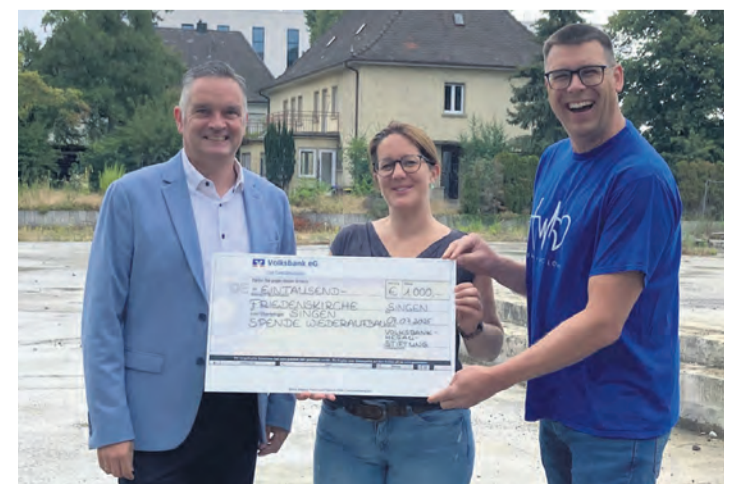
Glückliche Gesichter trotz bewölktem Himmel bei der Spendenübergabe der Volksbank-Hegau-Stiftung für die Freikirche.