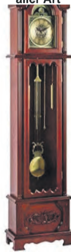
Ankauf von Uhren aller Art

ACHTUNG! Letzter Aufruf für Pelze vor Saisonschluss. Die Nachfrage ist groß, wir zahlen bis zu 8.500 €