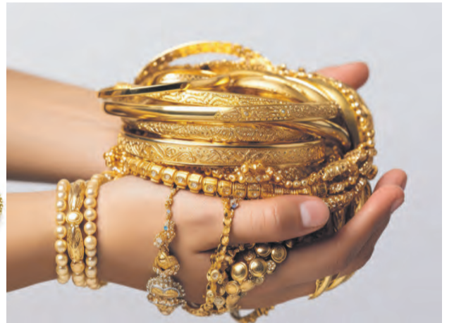
Ankauf von Goldschmuck