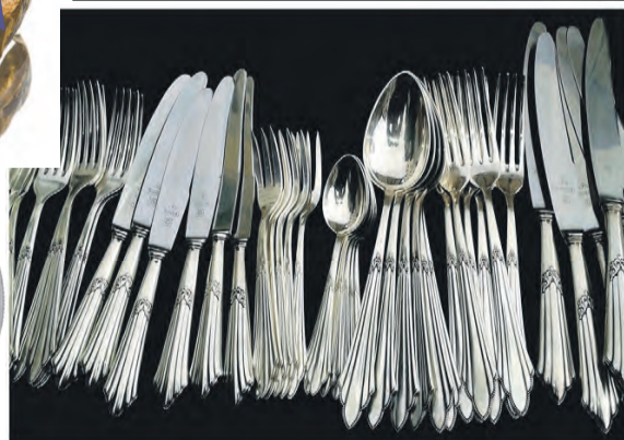
Besteck auch versilbert