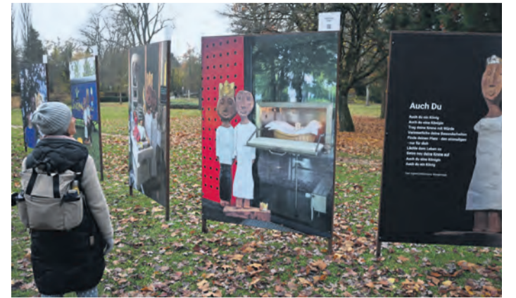
Schon am ersten Tag sorgten die Bilder zur Ausstellung „Würde - unantastbar“ für großes Interesse.