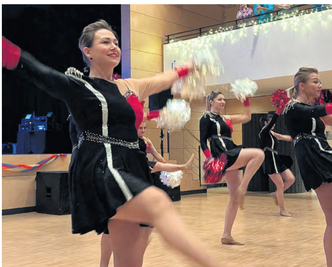
Die Cheerleader des TV Rielasingen boten nur eine von vielen spektakulären Shows am Abend des Jubiläums.