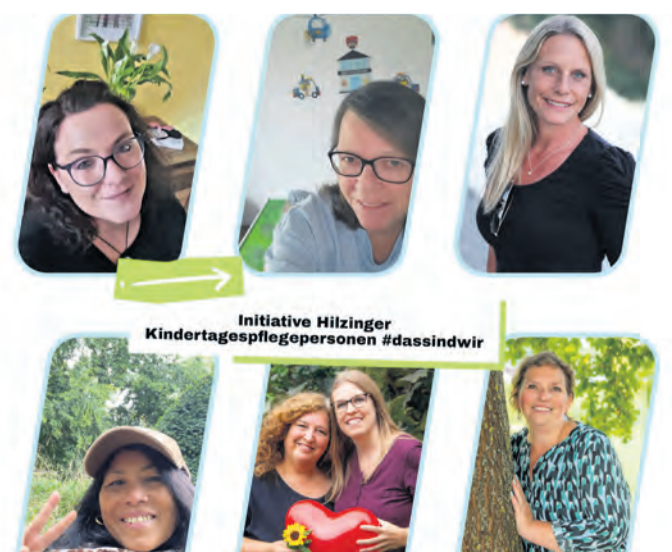
Die Initiative Hilzinger Kindertagespflegepersonen sind in diesem Jahr zum ersten Mal auf dem Hilzinger Weihnachtsmarkt vertreten.