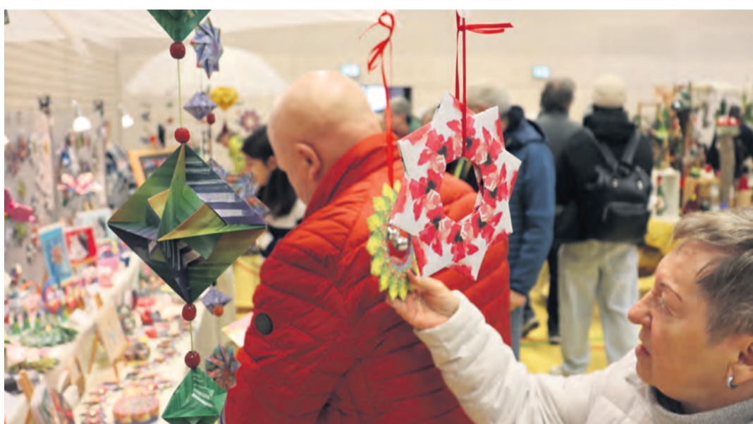
swb-Bilder: Sebastian Ridder

Rielasingen-Worblingen. Keramik, Stoff, Münzen oder Holz. Die Händler auf dem Kreativmarkt am Samstag, dem 22. November, in der Hardberghalle in Worblingen boten Schmuck, Dekoration und vieles mehr in den verschiedensten Materialien an. Darunter auch Krippen, Weihnachtskränze und weitere Weihnachtsdekorationen, die Lust auf die bevorstehende Adventszeit machen. Viele Besucher reiheten sich aneinander wie die unzähligen Stände, die die Halle ausfüllten. Sebastian Ridder