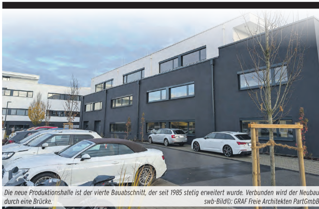
Die neue Produktionshalle ist der vierte Bauabschnitt, der seit 1985 stetig erweitert wurde. Verbunden wird der Neubau durch eine Brücke. swb-Bild©: GRAF Freie Architekten PartGmbH