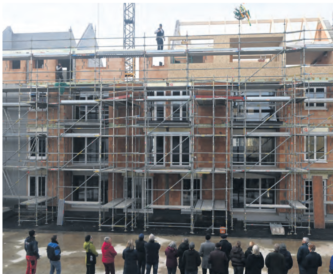
Ein neues Gebäude nimmt Form an in der Fliederstraße in Gottmadingen. Zum traditionellen Richtfest für den Neubau mit 22 Wohneinheiten blickten die Gäste gespannt in die Höhe.