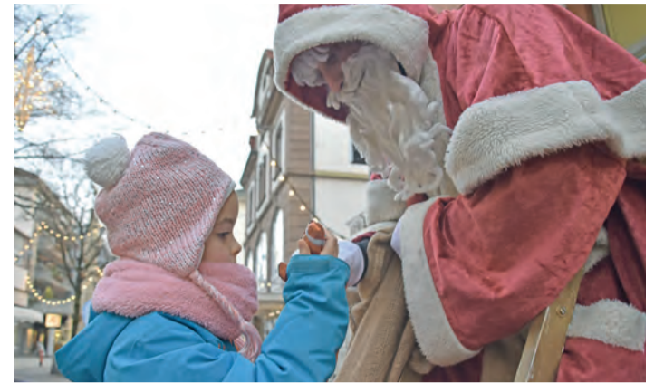
Auch der Nikolaus wird wieder in der Sternengstadt Singen erwartet.

Am Freitag bekommt Singen dann Besuch vom Nikolaus. Beim Weihnachtsbaum, Ecke August-Ruf-Straße und Hegaustraße, erwartet er kleine und große Kinder mit süßen Überraschungen. Zudem sind die Eisfeen in der Innenstadt unterwegs und auch Ekke Halmer ist wieder da, um beim Haco in der Scheffelstraße zusammen mit den Besuchern zu singen und Gedichte aufzusagen. Für Musik sorgt das Bodensee-Alphorntrio beim Heikorn.