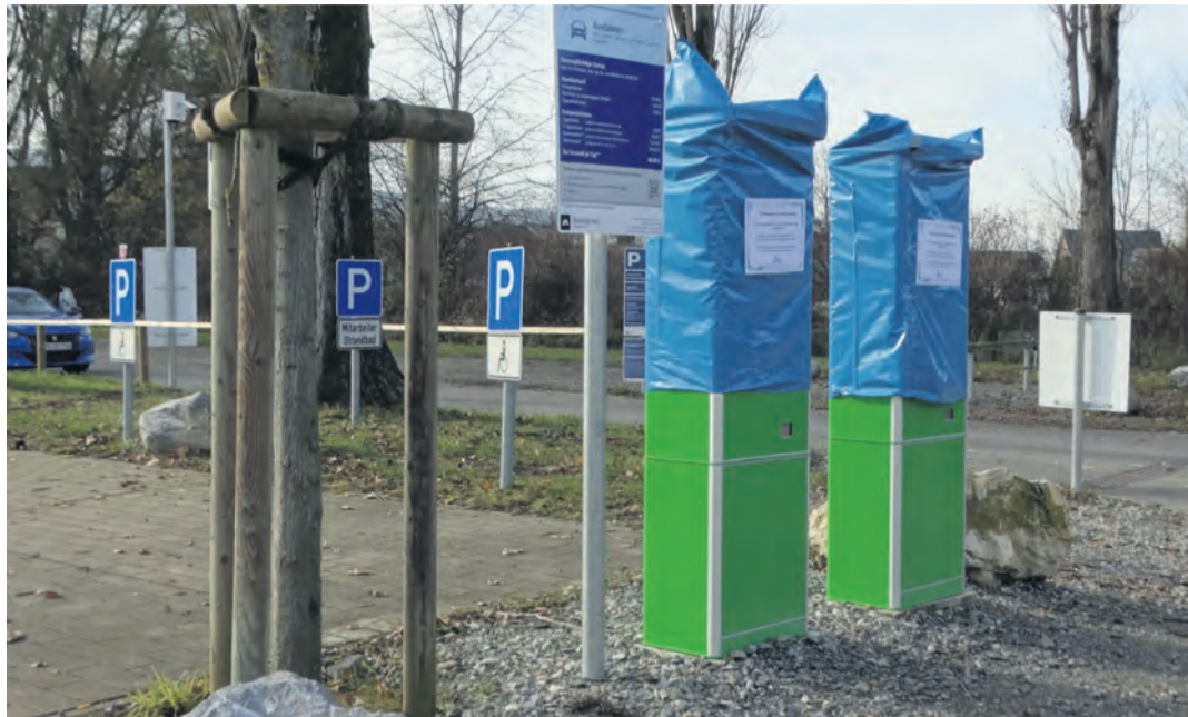
Die Parkautomaten in Moos sind derzeit in Winterruhe. Bei einem Bürgerforum wurde kürzlich über die bisherigen Ergebnisse und mögliche Verbesserungen gesprochen.

Moos. Zumindest das Letztere ist auf jeden Fall eingetreten. Mit deutlich mehr als 100.000 Euro Einnahmen konnte in der Grundschule Weiler eine längst überfällige neue Küche für Schul- und Mittagsbetriebsbetrieb ermöglicht werden. Dies konnte die Gemeindeverwaltung im Rahmen eines Bürgerdialogs den gut 30 anwesenden Gästen präsentieren. Den Bürgerinnen und Bürgern