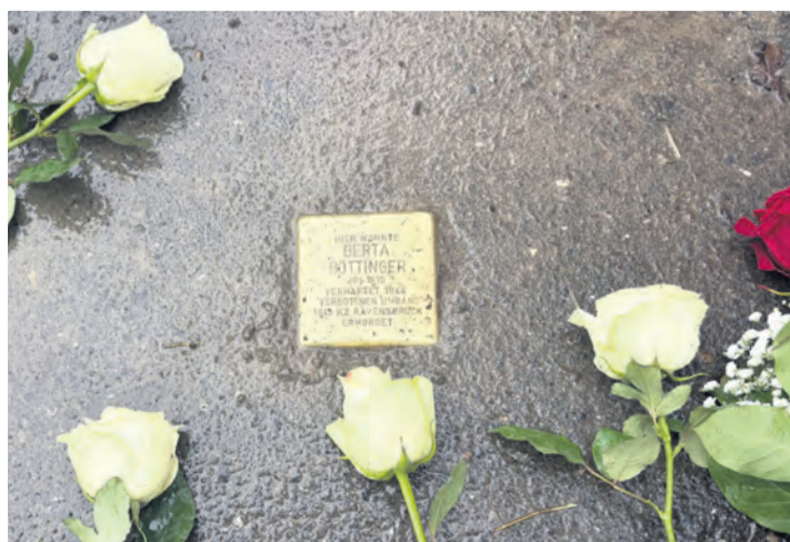
Der Stolperstein für Berta Böttinger, bei strömendem Regen an der Hauptstraße 43a.