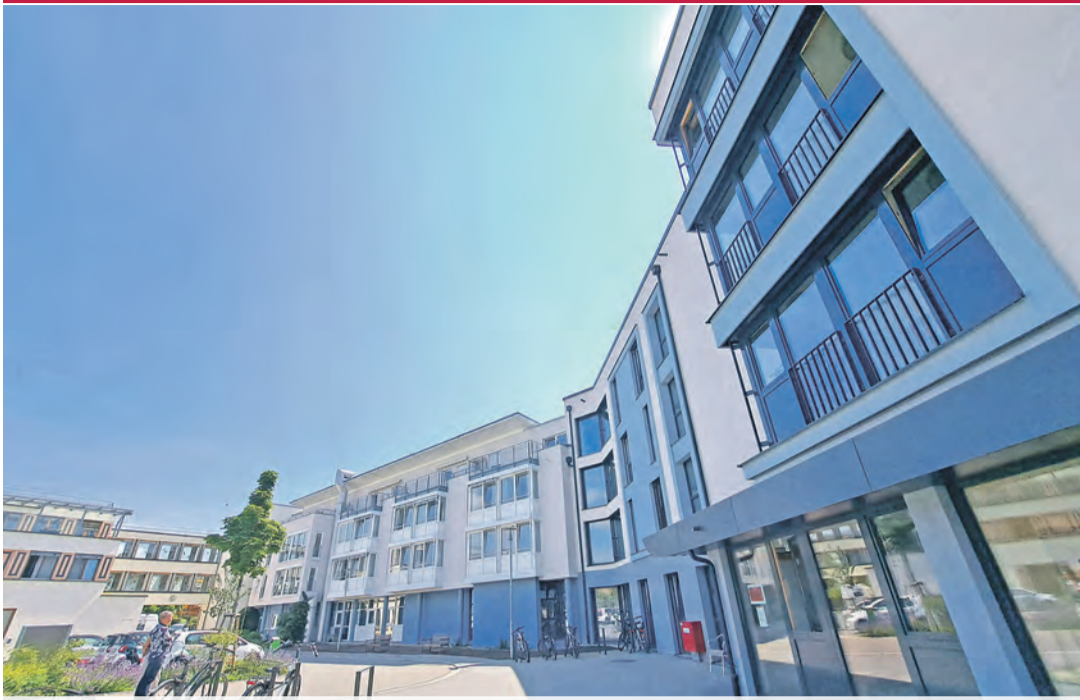
Der Anbau rechts, geht nahtlos in den Bestand über.