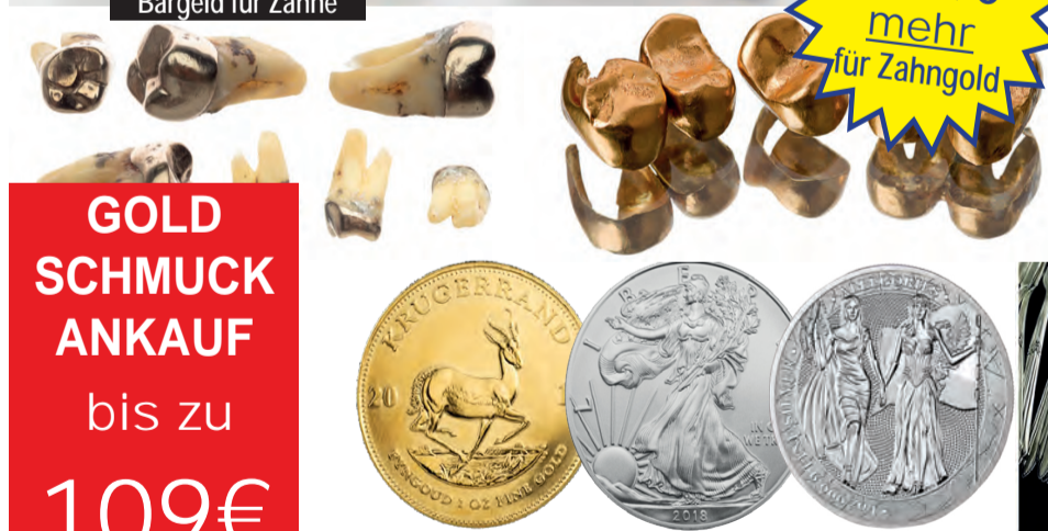
Ankauf von Münzen