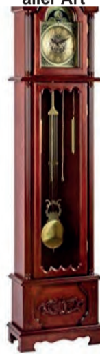
Ankauf von Uhren aller Art

ACHTUNG! Letzter Aufruf für Pelze vor Saisonschluss. Die Nachfrage ist groß, wir zahlen bis zu 8.500 €