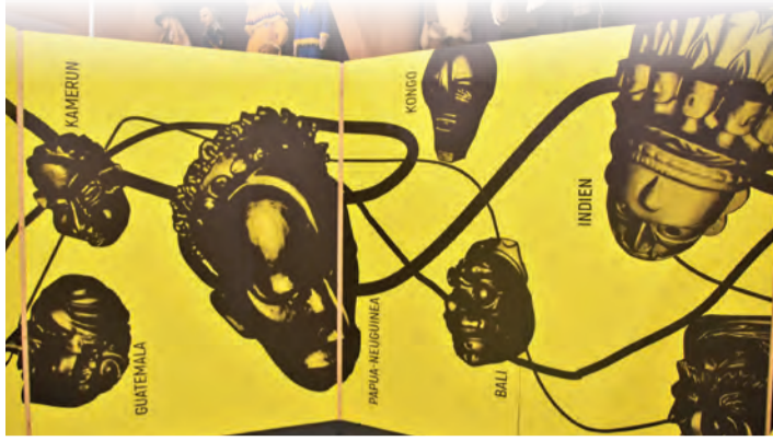
Nicht nur Masken der hiesigen Fasnet, sondern auch solche aus allen Teilen der Welt können im neuen Fasnachtsmuseum bewundert werden.