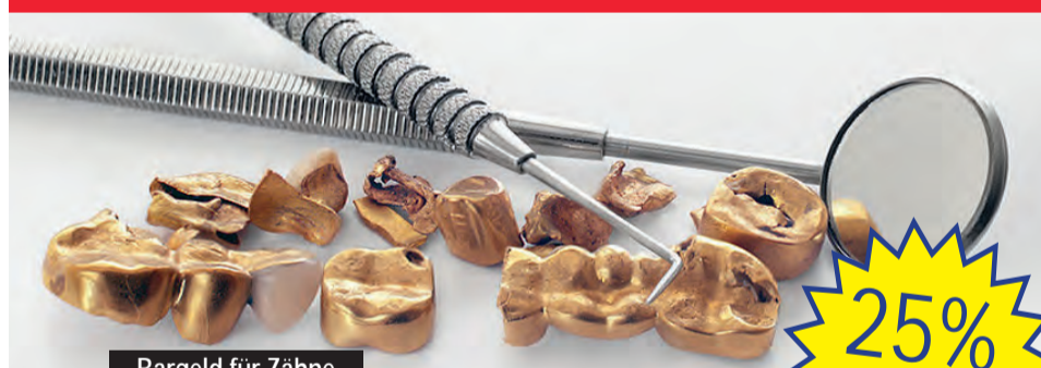
Bargeld für Zähne