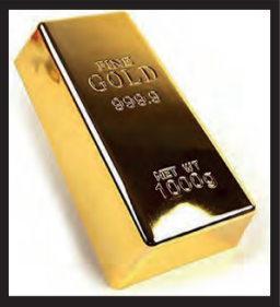
Ankauf Goldbarren Inhaber: W.