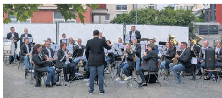
Der Musikverein Gottmadingen unterhielt beim abendlichen Konzert das Publikum.