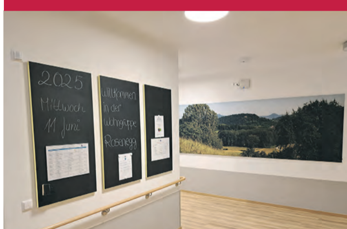
Die Wohngruppen sind nun nach regionalen Orten eingerichtet, wie hier bei der Wohngruppe Rosenegg.