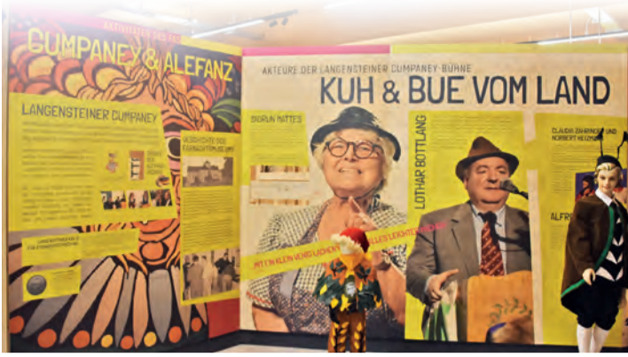
Auch die Geschichte der Langensteiner Cumpaney sowie Wissenswertes zu den Akteuren der Cumpaney-Bühne dürfen im neuen Fasnachtsmuseum Schloss Langenstein nicht fehlen.