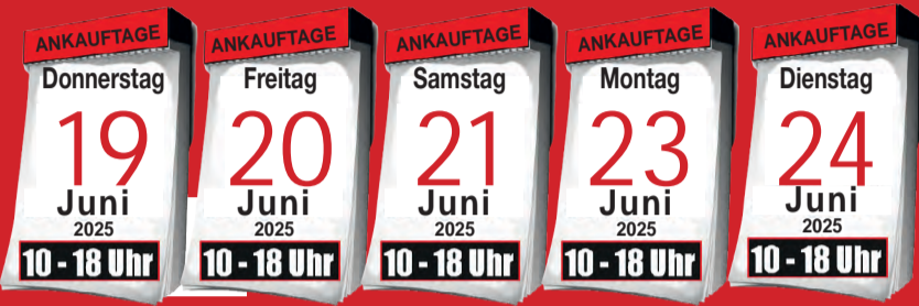
Ankauf von Krokotaschen

BARES FÜR WAHRES - DIE EXPERTEN SIND FÜR SIE VOR ORT