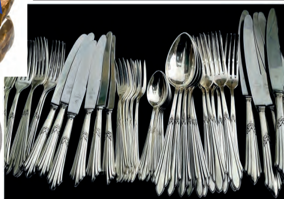
Besteck auch versilbert