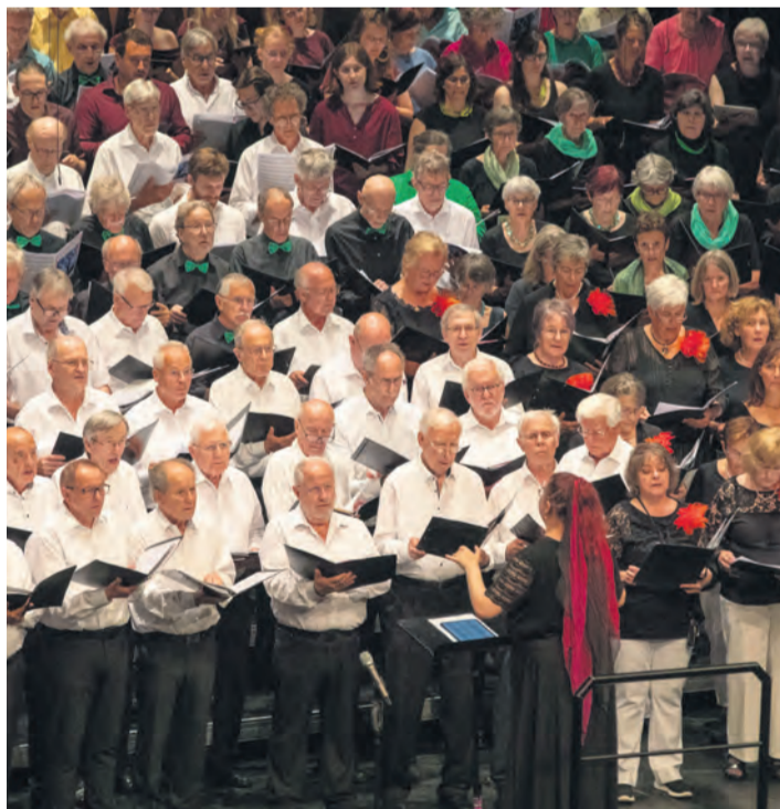
Sieben Chöre teilen sich beim grandiosen Abschluss von „Singen grenzenlos“ die Bühne.