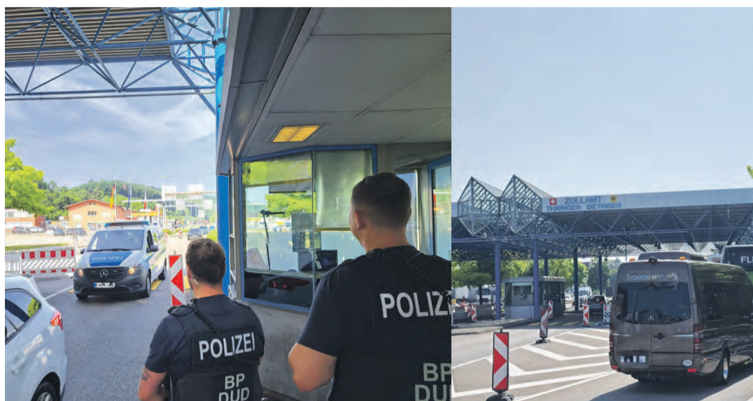
Beamte der Bundespolizei kontrollieren Fahrzeuge am Grenzübergang zwischen Thayngen und Bietingen.