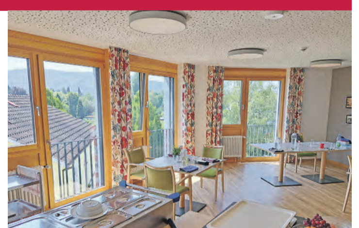
Die großen Fenster fluten die Räume des Pflegezentrums mit Sonne und bieten schöne Ausblicke.