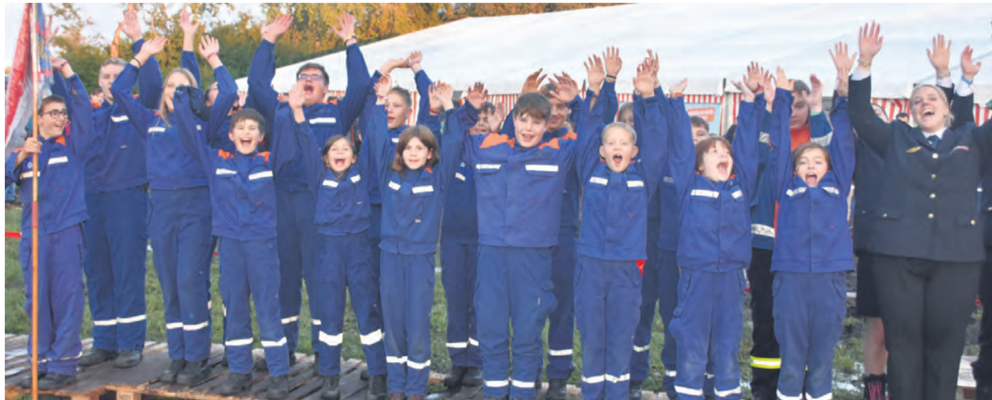
Auch bei der Jugendfeuerwehr Gaienhofen kam die große Laola-Welle zur Eröffnung des Zeltlagers in Bodman-Ludwigshafen bestens an.