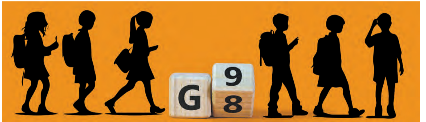
Der Umbau zurück zu einem 9-jährigen Gymnasium ist lange beschlossene Sache. Der Start – das kommende Schuljahr 2025/26 – steht fest, doch es gibt auch noch offene Fragen.

Perspektiven anderer Gymnasien auf das neue G9 gibt es auf Seite 3 nachzulesen.