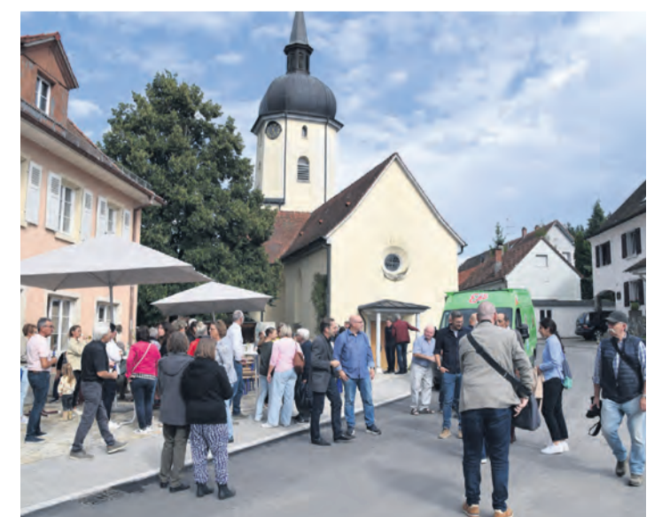
Vertreter der Anwohnerschaft, der Verwaltung und der Bauunternehmen feierten den Abschluss der Sanierung der Thaynger Straße in Ebringen.