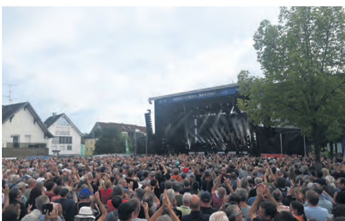
Auch im Jahr 2026 wird das Hohentwiefestival auf dem Singener Rathausplatz steigen.