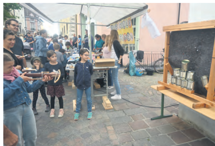
Auch für die Jüngsten wie hier bei der Grundschule Welschingen war beim 46. Engener Altstadtfest einiges geboten.

Und war das Wetter einem doch vielleicht zu viel, konnte man sich unter anderem beim Bücherflohmarkt der Stadtbibliothek für einige Augenblicke etwas schmökern. Zudem kamen Nostalgiker mit einer kleinen Ausstellung des Oldtimer- und Fahrzeugmuseums Engen in der Vorstadt auf ihre Kosten. Philipp Findling