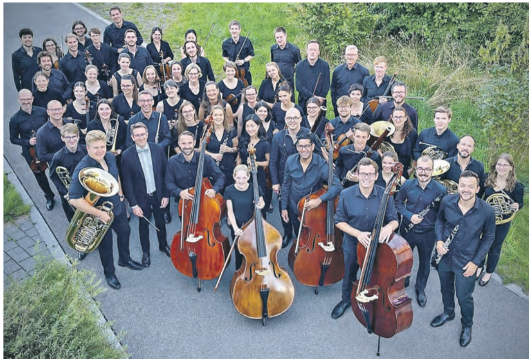
Bodensee Kammerorchester am Freitag, den 08. August 2025 um 19:00 Uhr Curana Halle, Eichbühlstraße 22a, Singen. Dieses Jahr erwartet die Zuhörer ein außergewöhnliches Programm: Im Mittelpunkt steht die Erste Symphonie in c-moll von Johannes Brahms, ein herausragendes Werk der romantischen Orchesterliteratur, das nach jahrelanger Arbeit 1876 vollendet wurde. Diese Symphonie, die in der Tradition Beethovens steht, gilt als eine der bedeutendsten des 19. Jahrhunderts. Weitere Infos unter www.gaienhofen.de.

umsführung »Gaienhofener Umwege«. Die Dauerausstellung beleuchtet im ersten Wohnhaus von Hermann Hesse das Leben und Werk des Schriftstellers. Die Führung endet genüßlich mit Kaffee und Kuchen. Eintritt: 10 Euro. Anmeldung erwünscht unter 07735/440949. Info: www.hesse-museum-gaienhofen.de .