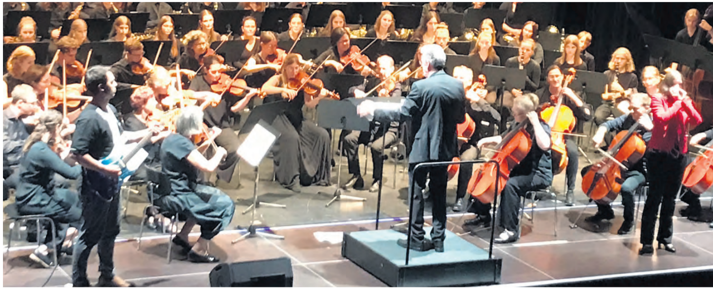
Teile des Konzerts wurden durch die Instrumente E-Gitarre (vorne links) und Mundharmonika (vorne rechts) bereichert.

Die stehenden Ovationen der rund 650 Gäste und die damit gewünschte Zugabe am Ende des Konzerts gaben den Organisatoren Recht. Bereits in der