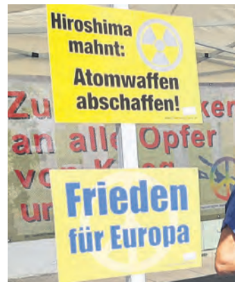
Auch in diesem Jahr gibt es am Jahrestag des Atombombenabwurfs eine Mahnwache.

Gezeigt werden auch Karten mit simulierten Auswirkungen einer Atombombe mit einer Sprengkraft von 22 Kilotonnen TNT auf die Stadt Radolfzell, was der Atombombe „Fat Man“ in Nagasaki entspricht. Die Vereine informieren am Infotisch auch über ihr Projekt „Friedensbaum“, das im Radolfzeller Bürgerbudget-Wettbewerb zur Umsetzung ausgewählt wurde: Es soll an exponierter Stelle ein Friedensbaum gepflanzt und eine Infotafel mit Friedenszitat installiert werden. Pressemeldung