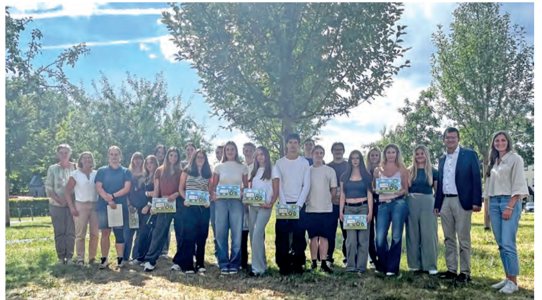
Die Klasse 11 des BSZ Radolfzell mit Projektteam.

Auf dem Betrieb Traber in Mühlingen-Hecheln entstand der