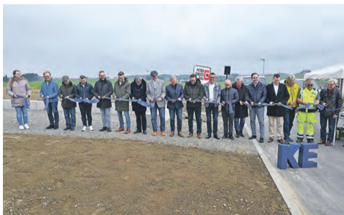
Die Gemeinde Hohenfels ist bereit für Häuslebau. Nach rund einem Jahr stehen nun 64 Bauplätze im neuen Baugebiet Röschberg Süd im Ortsteil Liggersdorf bereit.

„Die eine oder andere schlaflose Nacht“ habe sich gelohnt, meinte der Bürgermeister. Damit spielte er auf die Hürden an - insbesondere die Umsiedlung von Felderchen - die es zu bewältigen galt. Man habe aber nicht nur geredet, sondern auch an der Umsetzung gearbeitet und das Projekt „mit Mut und entschlossen angepackt“. Er sprach allen Beteiligten „ein riesen Kompliment für die Zuversicht und Zusammenarbeit“ aus.