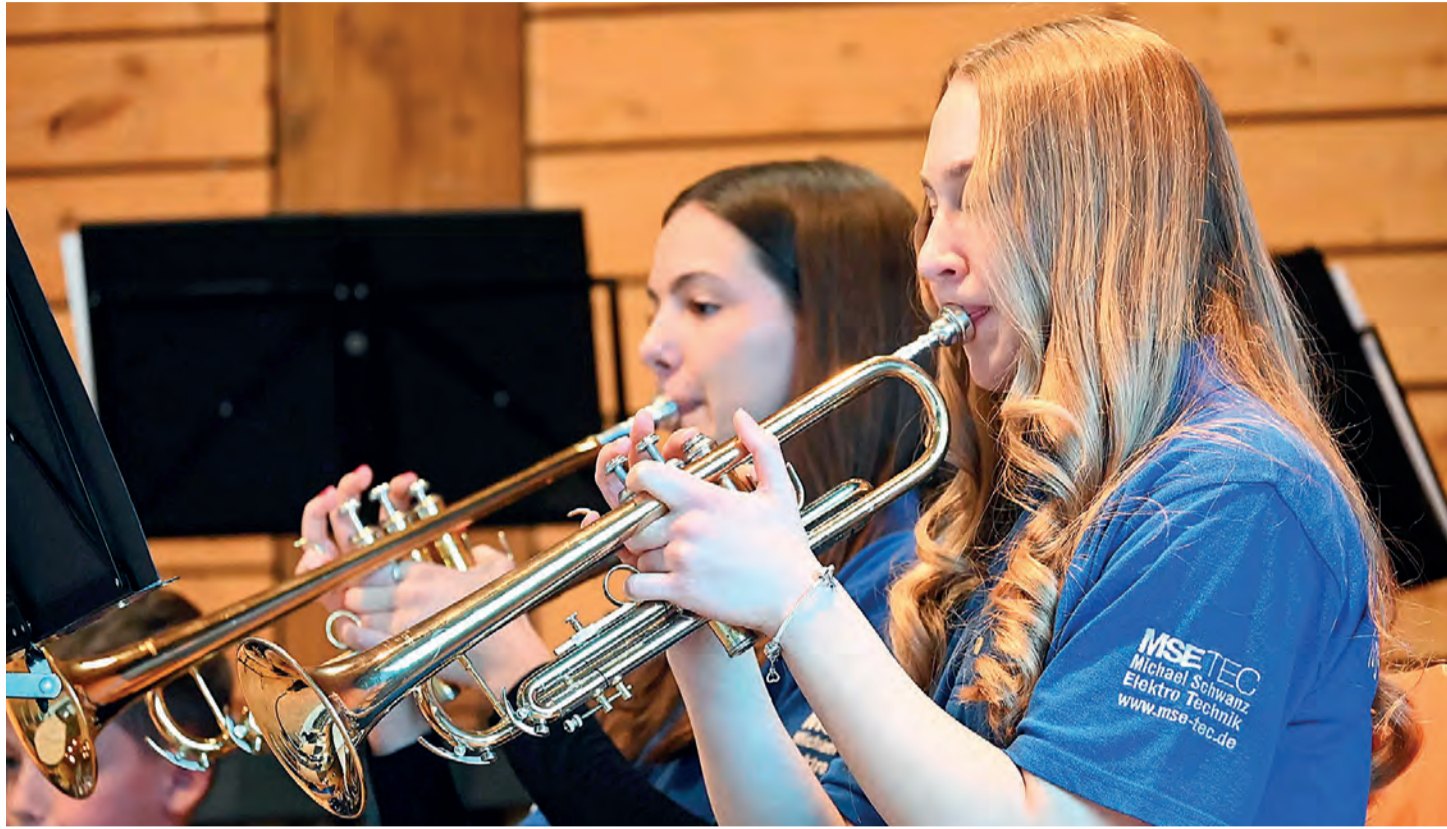
Beim Frühjahrskonzert sorgte der Musikverein Orsingen für einen gelungenen musikalischen Abend.