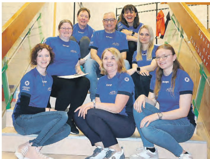
Die neue und alte Vorstandschaft freut sich über die angestiegene Mitgliederzahl.

In kurzen Darstellungen wurden über die vielen unterschiedlichen Aktivitäten im vergangenen Vereinsjahr informiert. Erstes Highlight war hierbei die Sportlehrerung Ende März. Fehlen durfte natürlich nicht die Beteiligung am Altstadtfest und die Durchführung der Sommerferien-Freizeiten. Im Herbst sind feste Termine das Volleyball-Mixed-Turnier und das Internationale Faustball-Turnier sowie