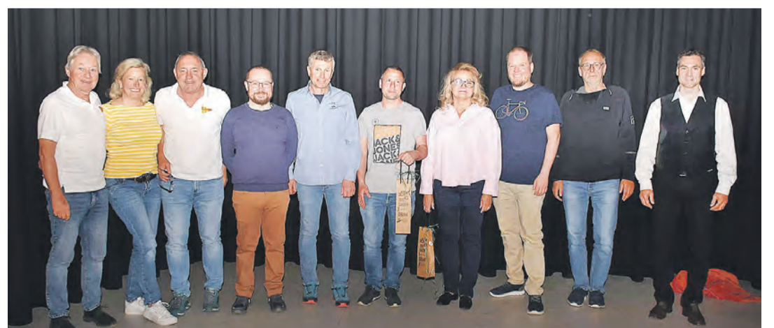
Der neue und alte Vorstand des MWSC samt anwesenden Jubilaren.

Pressemeldung Quelle: Markelfinger Wassersportclub