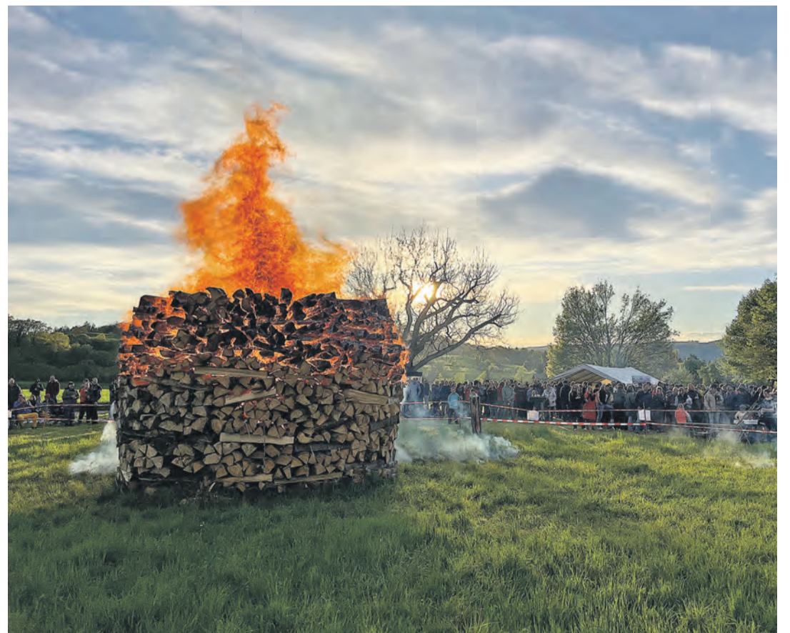
Auch in diesem Jahr zog der Osterfunken zahlreiche Bietinger auf die Wiese oberhalb des Sportplatzes.

Pressemeldung