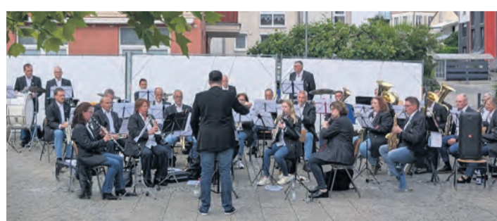
Der Musikverein Gottmadingen unterhielt beim abendlichen Konzert das Publikum.