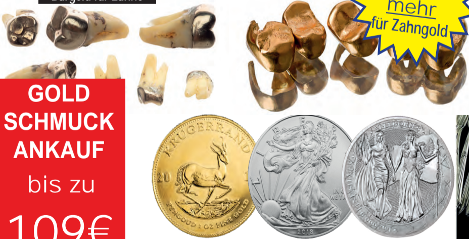
Ankauf von Münzen