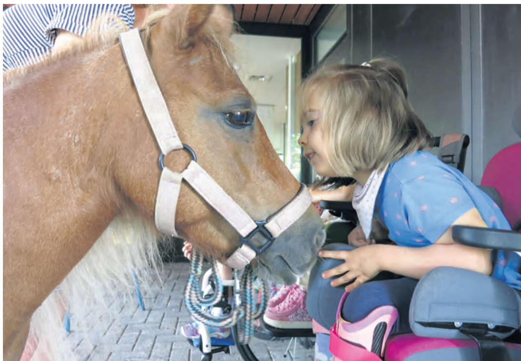
Über eine tierische Begegnung durften sich die jungen Patienten des Hegau-Jugendwerks freuen.