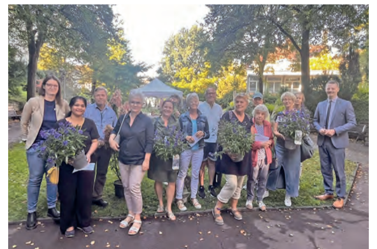
Bei strahlendem Sonnenschein und guter Laune wurden die fünf Gewinner des Gartenwettbewerbs in Radolfzell gekürt. Doch niemand ging leer aus: Auch für die Teilnehmenden gab es neben der Blutpflaume auch einen Aktionsgutschein.