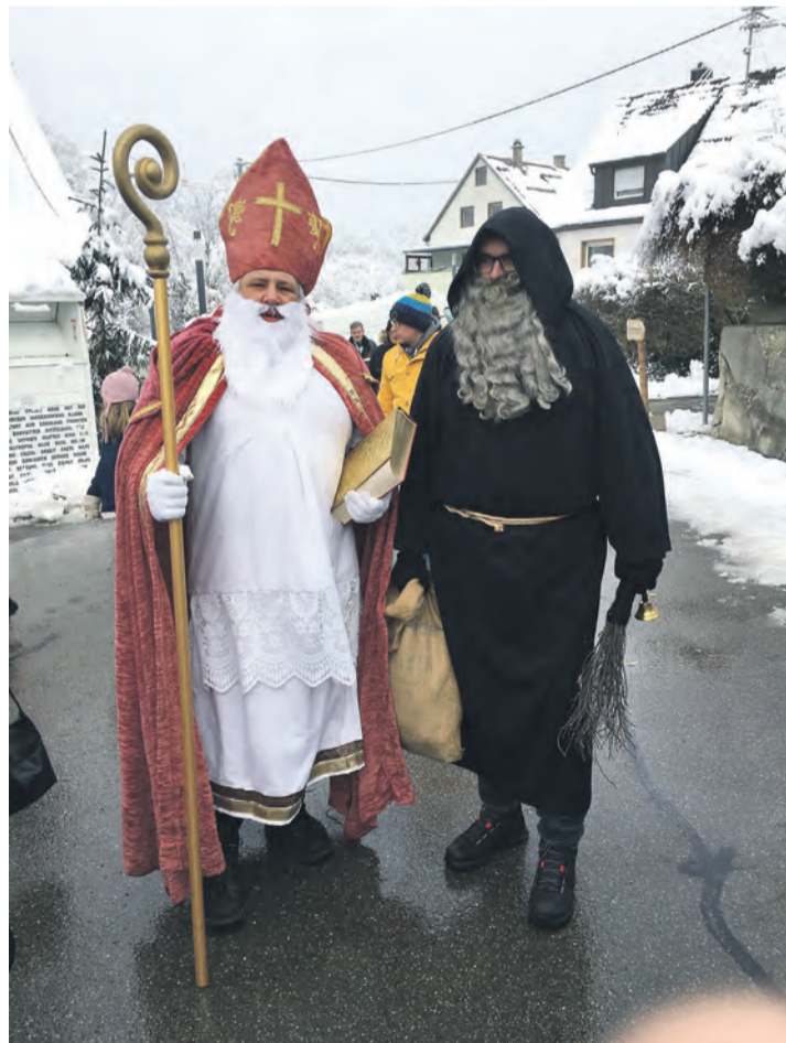
Auch dieses Jahr ist der Nikolaus auf dem Kloosemarkt anzutreffen und hat für jedes Kind eine Überraschung aus seinem Sack dabei.

Ab 19 Uhr: Kloosemarkt Warm-up-Party im Feuerwehrhaus der Freiwilligen Feuerwehr Stadt Aach.