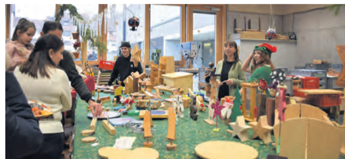
Das BSZ Radolfzell lädt wieder zu seinem traditionellen Weihnachtsbasar ein.

Mitmachaktionen und praktischen Einblicken in verschiedene Unterrichtsbereiche. Gleichzeitig findet der „Tag der offenen Schule“ statt, der Interessierten die Möglichkeit bietet, die Bandbreite des beruflichen Bildungsangebots am BSZ zu entdecken. Das Programm wird gemeinsam von der Schülerschaft, den Fachbereichen und Lehrkräften gestaltet und von der Schülermitverantwortung (SMV) koordiniert: Wie jedes Jahr steht die Veranstaltung im Zeichen sozialer Verantwortung. Der Erlös geht an Auxilium Radolfzell, die Fachstelle Sucht sowie das Frauen- und Kinderschutzzentrum Radolfzell. Die Schulgemeinschaft freut sich auf zahlreiche Gäste. Pressemeldung