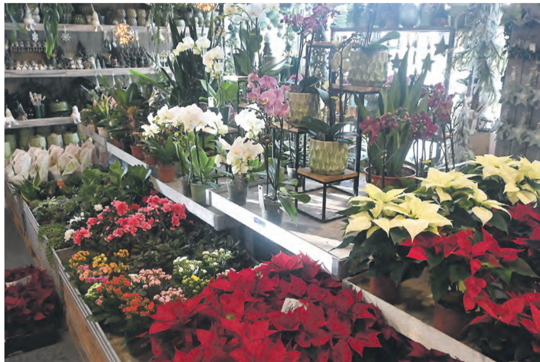
Blumen in unterschiedlicher Form und Farbe gibt es bei Blumen Glöggl.