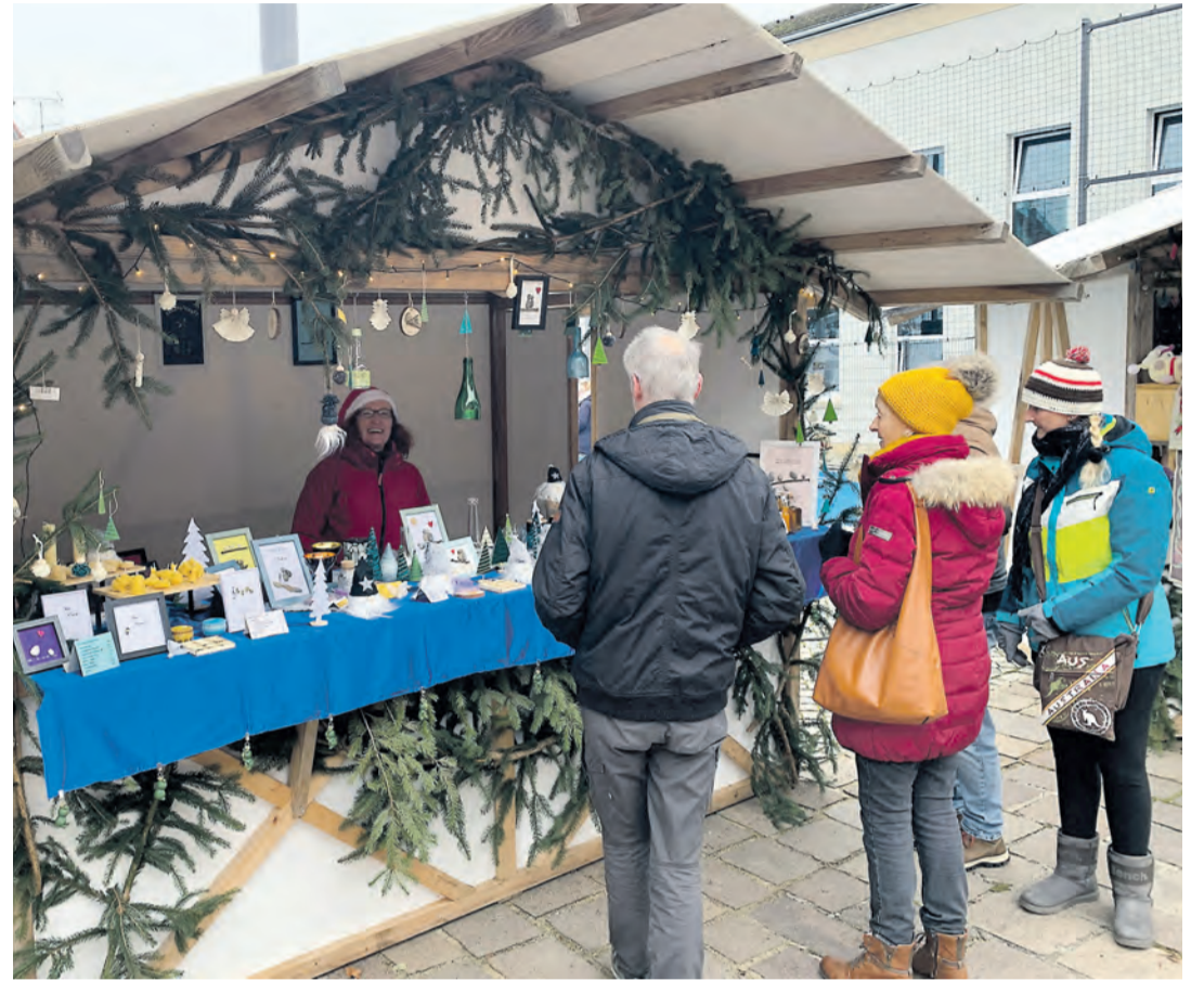
Originelle und einzigartige Weihnachtsgeschenke können Sie am diesjährigen Kloosemarkt wieder entdecken und erwerben.

Am Sonntag, 30. November, verwandelt sich die sanierte Ortsmitte der Stadt Aach in einen festlichen Treffpunkt. Von 9.30 bis 18 Uhr erwartet die Besucher der traditionelle Kloosemarkt - ein bunter Mix aus Handwerk, Kulinarik und musikalischen Höhepunkten auf dem Mühlenplatz und dem Platz hinter dem Rathaus.