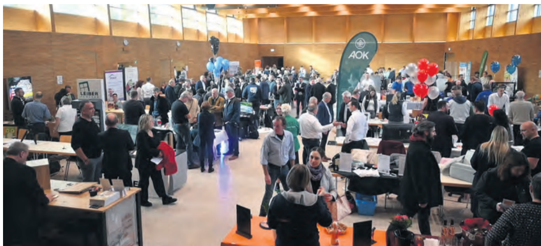
Viele Besucher zog die Engener Tischmesse an, die in der Stadthalle stattgefunden hat.