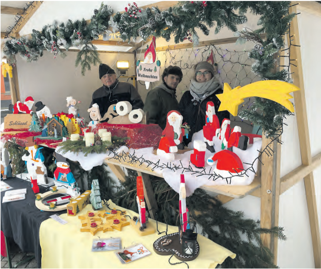
Der Kreativmarkt bietet von Selbstgebasteltem, Selbstgebackenem bis zum Kunsthandwerk alles an.