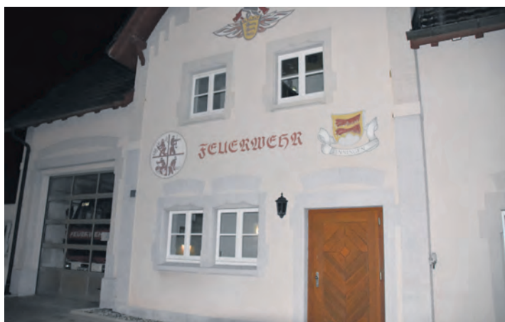
Die Feuerwehr des Hilzinger Ortsteils Binningen soll in naher Zukunft ein neues Fahrzeug bekommen.