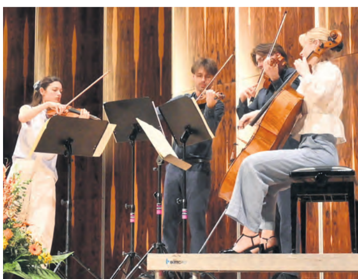
Kammermusik auf allerhöchstem Niveau bot das Novo Quartet aus Dänemark dem Publikum bei deren begeisternden Auftritt in der Singener Stadthalle.

Ein weiteres, sehr persönliches Werk folgte nach der Pause mit Bedřich Smetanas Streichquartett Nr. 1 in e-moll „Aus meinem Leben“. Getragen von einem lieblichen Tanz, der dank des perfekten Spiels des begnadeten Quartetts nie enden möchte, offenbart dieses Stück die ganze Seele des tschechischen Meisterkomponisten. Allen voran im Allegro vivo appassionato sowie dem Allegro moderato à la Polca wurde die Leichtigkeit von Smetanas Komposition spürbar. Generell stellt „Aus meinem