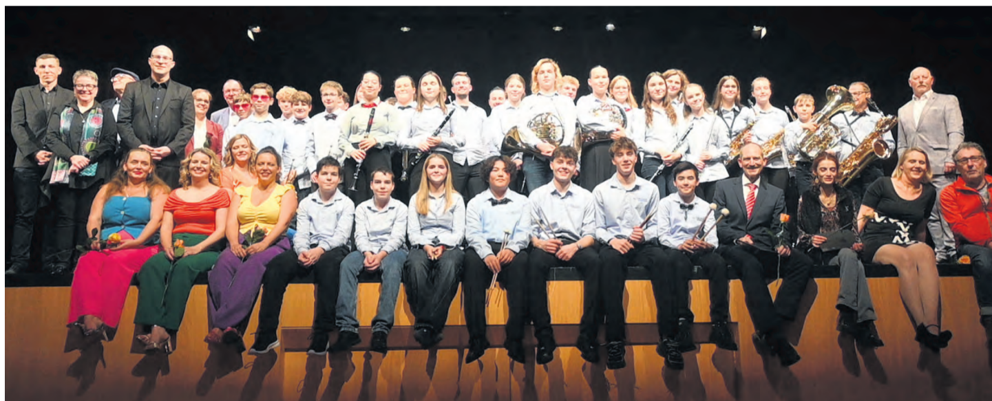
Die Geehrten und Laudatoren des diesjährigen Kulturförderpreises des Kulturförderkreis Singen-Hegau.

Beim ersten Preisträger passte es wie gemalt, dass dieser bereits in voller Besetzung auf der Bühne