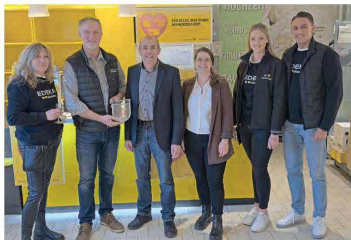
Große Freude herrscht darüber, dass es auch in Zukunft eine Postfiliale im Ort gibt.

Die Eucharistiefeier in der Autobahnkapelle findet statt am ersten Adventssonntag, 3. November, um 11 Uhr. Die Gäste sind eingeladen, ihren Adventskranz zur Weihe mitzubringen, als persönliche Zeichen zu Hause des gemeinsamen Weges dem Weihnachtsfest entgegen. Redaktion