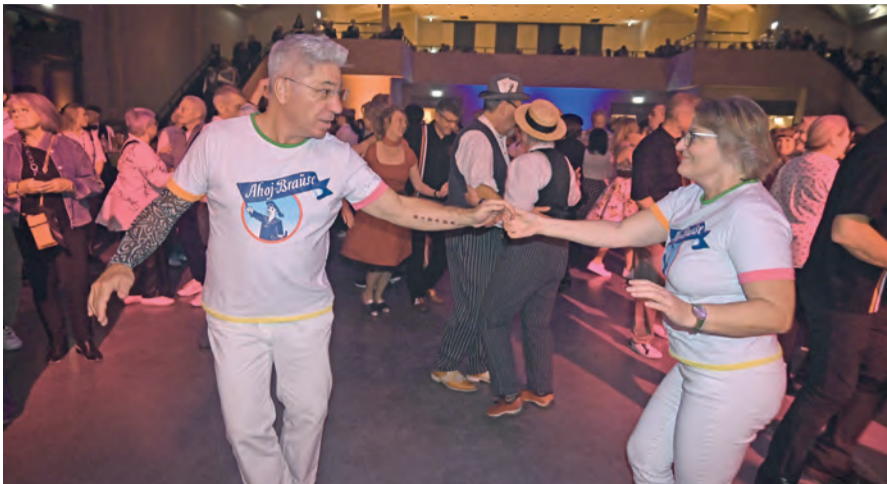
Vor 100 Jahren erbaut und nun in neuem Gewand gebührend gefeiert. Die Jubiläumsnacht „Feiern wie vor 100 Jahren“ am 15. November bewies seit der Wiedereröffnung der Scheffelhalle einmal mehr, wie viel den Singern ihr Stall der Ställe noch immer bedeutet.