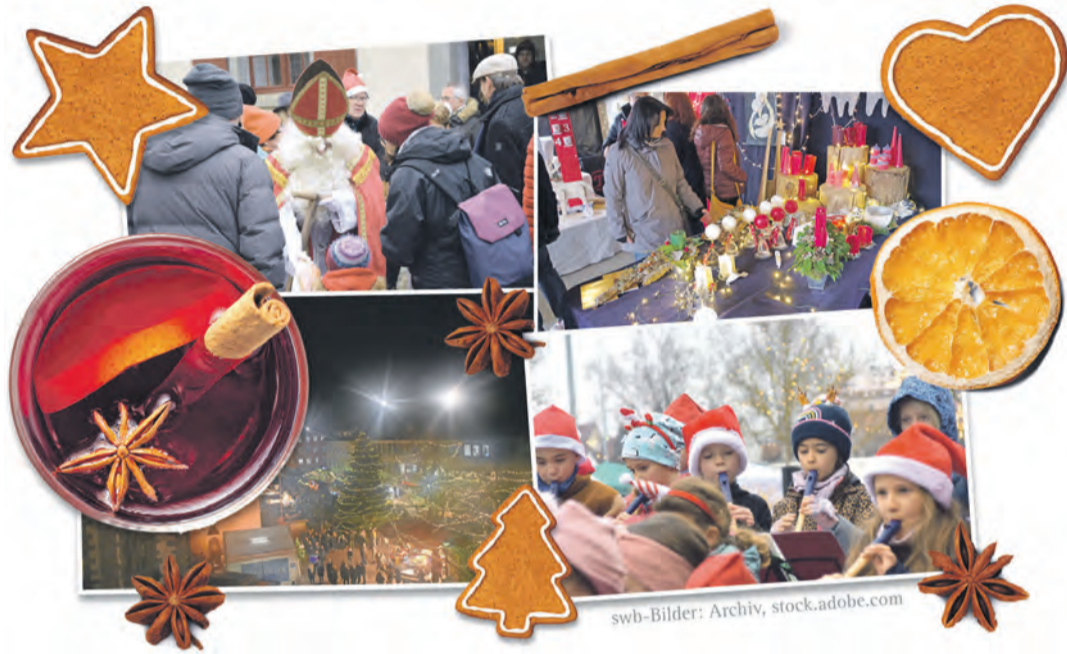
Egal ob in Hilzingen (oben links), dem Eigeltinger Ortsteil Heudorf, (oben rechts), Radolfzell (unten links) oder auch Rielasingen: Auch in diesem Jahr ist wieder einiges geboten zur Vorweihnachtszeit.

Immer im Wechsel findet auch in der Hegau-Gemeinde Hilzingen ein großer Weihnachtsmarkt statt. In diesem Jahr steigt er wieder in der Ortsmitte am Rathausplatz. Zum ersten Mal dort vertreten sein wird die Initiative Hilzinger Kindertagespflegepersonen. „Hier informieren wir alle interessierten Bürger über unsere individuelle und familiennahe Betreuungsform