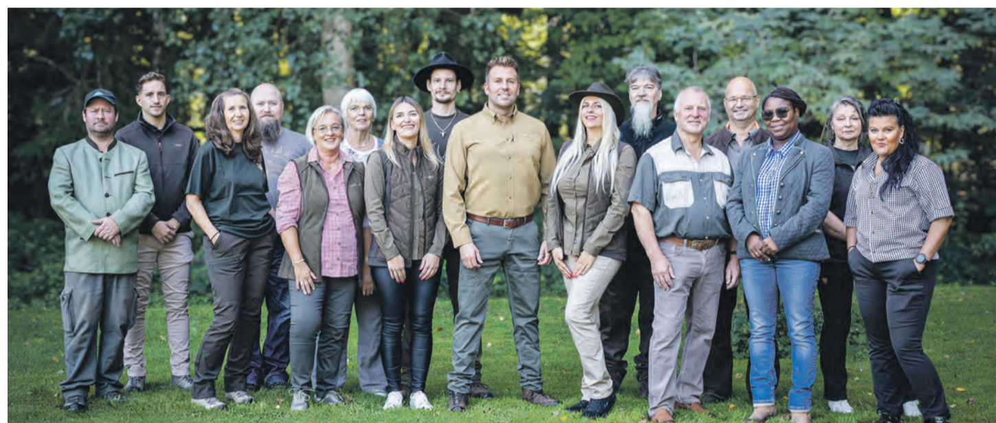
„Auf Kieferle kann man sich halt einfach verlassen“. Ein Versprechen, das Kieferle seit 100 Jahren einhält.