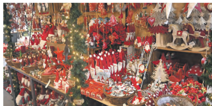
Auch allerlei Deko-Artikel gibt es im Sortiment von Blumen Glöggl.

Rund 400 Ausstellungsstücke gibt es bei der Jubiläumsausstellung zu sehen. Alle kriert von Glöggl und seinen zwölf Mitarbeiterinnen und Mitarbeitern. Und zum Jubiläum gibt es neue Tassen, die auch erworben werden können und ein schönes Andenken sind. Ein Besuch lohnt sich also.