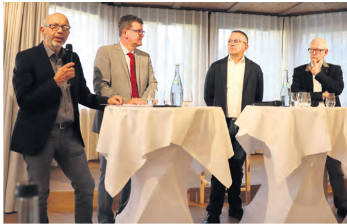
Die Lage scheint nicht hoffnungslos, aber es gibt einige Herausforderungen, die die Gastronomen bei der Jahreshauptversammlung der DEHOGA Kreisstelle im Landkreis Konstanz diskutierten.