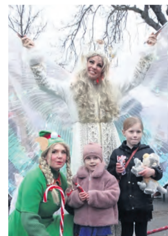
Für besondere Momente beim Adventszauber sorgte der Engel.

Einen himmlischen Anteil daran hatte beim Adventszauber in Gottmadingen der bezaubernde Engel. Dieser verteilte unermüdet mit seinem wichtigen Helfer nicht nur Süßes an die jüngsten, der zahlreichen Gäste. Die Eltern und Großeltern dieser Kinder, aber auch viele Pärchen und Singles wandelten in ansprechender Atmosphäre zwischen den zwölf eher kommerziellen Buden, Foodtrucks und Wohnwägen und den zehn Pavillions der unterschiedlichsten Einrichtungen des Ortes. Unterhalten wurden sie alle von dem Bläserensemble der Jugendmusikschule Westlicher Hegau. Marcelino Rütth