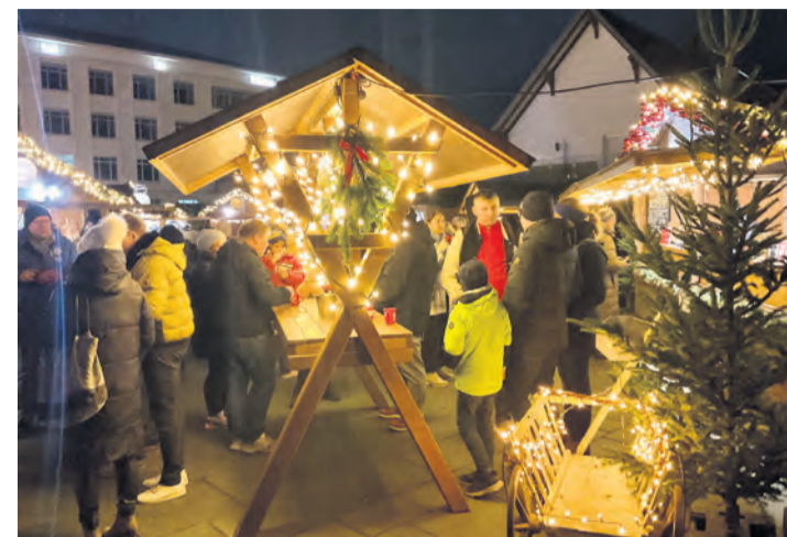
Es tut sich etwas auf dem Rathausplatz in Singen. Der Weihnachtsmarkt hat wieder geöffnet.

Singen. Seit dem 4. Dezember lockt der Singener Weihnachtsmarkt wieder Besucherinnen und Besucher auf den festlich illuminierten Rathausplatz, angeleitet und eingangs begrüßt von einem zauberhaft geschmückten und imposanten acht Meter hohen Weihnachtsbaum.