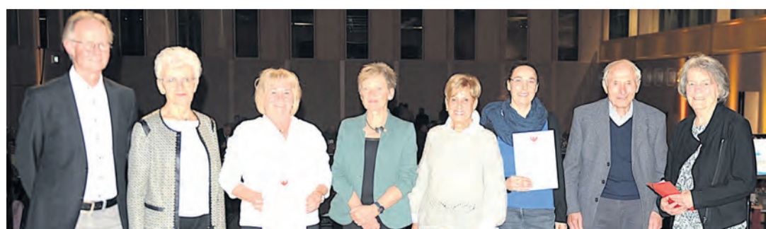
Die Organisatoren der Veranstaltung blickten auf 40 Jahre AHR zurück. Mit dabei waren auch viele Ehrungen, die an diesem Abend ausgezeichnet worden sind.