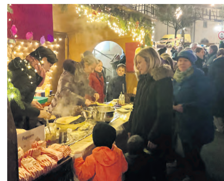
Es weihnachtete wieder an allen Ecken und Enden nahe der Steißlinger Torkel zum traditionellen Weihnachtsmarkt.