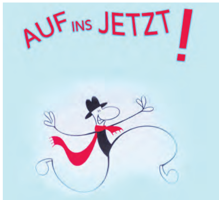
Auch im Engener Schützenurm werden am 21. Dezember wieder alle Kurzfilmfreunde voll auf ihre Kosten kommen.

Ab 19 Uhr wird eine Auswahl von Kurzfilmen der Ludwigsburger Filmakademie Baden-Württemberg gezeigt. In dieser Auswahl von Animations-, Spiel- und Dokumentarfilmen dreht sich alles um Aufbruch. Die Zeit ist jetzt! Das denkt sich zum Beispiel Helmut, der seinen 60. Geburtstag feiert, obwohl er erst 57 ist.