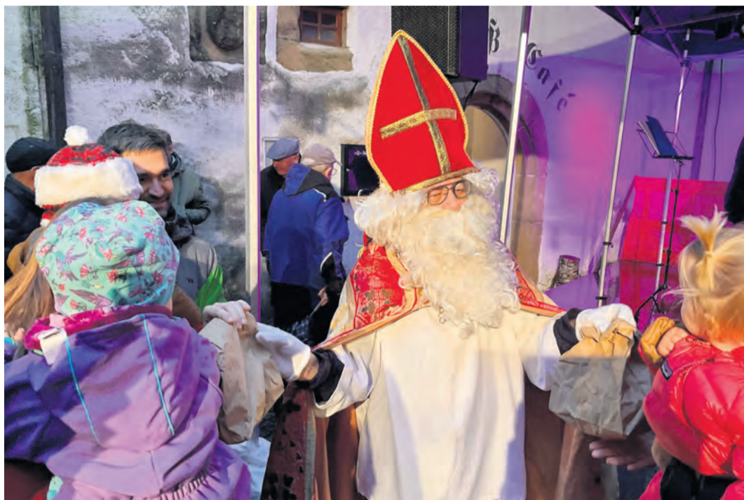
Auch der Nikolaus war an der Schlossweihnacht anwesend und hat so manche Kinderaugen zum Staunen und Strahlen gebracht.

Tengen-Blumenfeld. „Wir haben Schnee in aufgetauter Form.“ Der leichte Nieselregen tat der Stimmung indes keinen Abbruch: Auf dem Kirchplatz, im Schlossgarten, vor und hinter dem Torbogen und auf dem festlich illuminierten Schlosshof tummelten sich Generationen von heimischen und nachbarlichen Besucherinnen und Besuchern, ließen sich an den Ständen und Pavillions lokaler Vereine verwöhnen und erfreuten sich am vielfältigen Kunsthandwerksmarkt. Das Bläserquartett St. Agatha aus Hausen an der Aach spielte stimmungsvoll zur Vorweihnachtszeit auf, gefolgt von der X-Mas-Combo mit schwungvollen Stücken rings