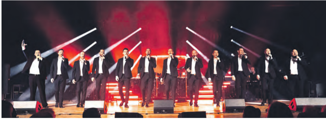
The 12 Tenors – Song of Eternity am Dienstag, den 30. Dezember um 20:00 Uhr in der Stadthalle, Hohgarten 4 in Singen. Begleitet von einer Live-Band und umrahmt von einer spektakulären Lichtshow zelebrieren die 12 Tenöre die Vielseitigkeit der Musik in all ihren Facetten. Weltberühmte Arien treffen auf Rock- und Pophymnen, eine Allianz von charismatischen Stimmen formiert sich zu einem beeindruckenden Ensemble und 12 Top-Solisten verschmelzen in ihrer Virtuosität und Leidenschaft zu einer fulminanten Einheit. Weitere Infos unter www.stadthalle-singen.de

■ Biedermann und die Brandstifter Schauspiel von Max Frisch - »Die Darstellung eines durchschnittlichen Bürgers, der ein etwas schlechtes Gewissen hat ... und der ein gutes haben möchte, ohne irgendetwas zu verändern.« So Max Frisch. Mi., 19:30 Uhr.