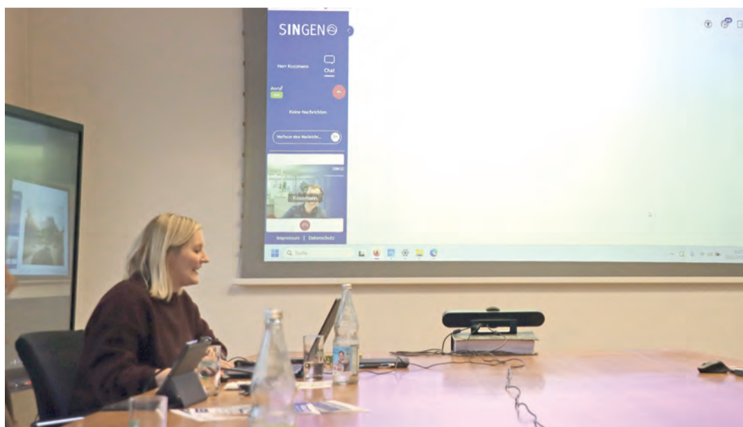
Den Link zum Termin erhält man mit der Bestätigungsmail. So sieht dann der virtuelle Raum aus, wo die Bürger den Termin mit dem zuständigen Sachbearbeiter durchführen können.