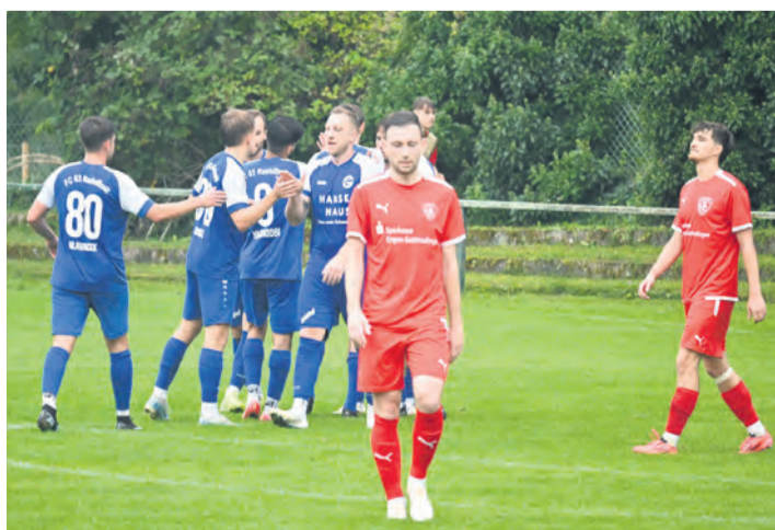
Freud und Leid waren nach dem 3:0 Treffer im SBFV-Rothaus-Pokal beim FC Radolfzell und dem SC GoBi nah beieinander.