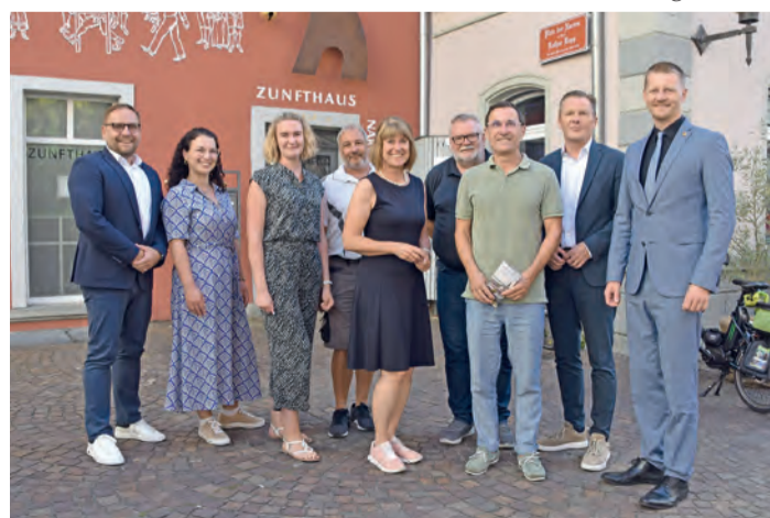
Die Beteiligten freuen sich schon auf viel Musik, Besucher und gute Stimmung beim 47. Radolfzeller Altstadtfest am 6. September.