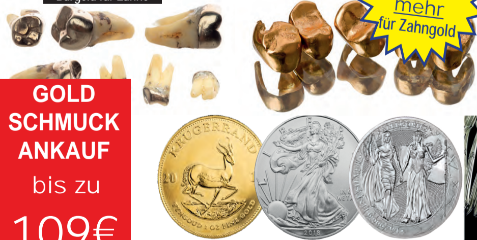
Ankauf von Münzen