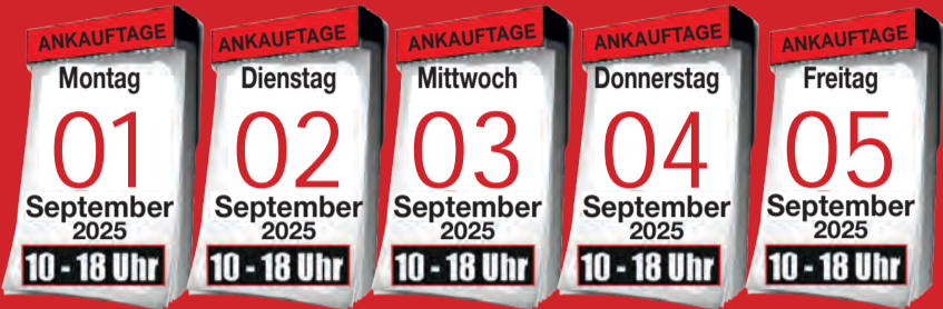
Ankauf von Krokotaschen

BARES FÜR WAHRES - DIE EXPERTEN SIND FÜR SIE VOR ORT