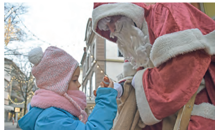
Auch der Nikolaus wird wieder in der Sternengstadt Singen erwartet.