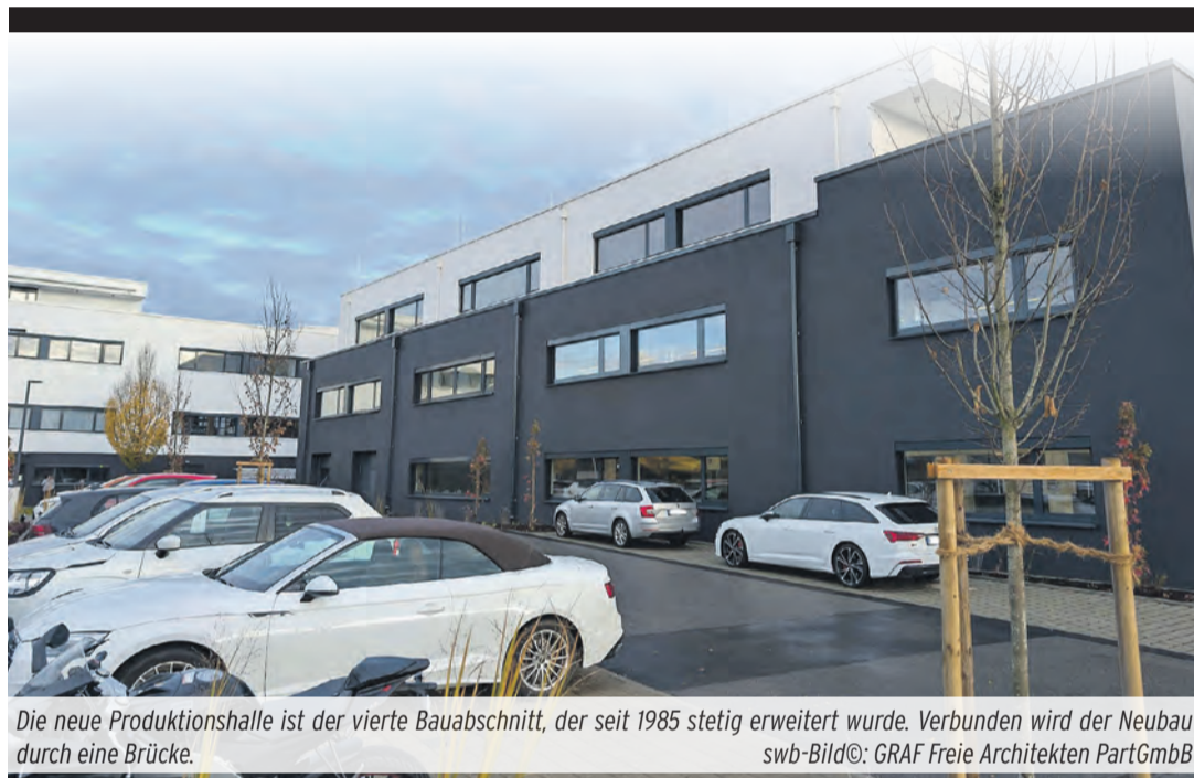
Die neue Produktionshalle ist der vierte Bauabschnitt, der seit 1985 stetig erweitert wurde. Verbunden wird der Neubau durch eine Brücke. swb-Bild©: GRAF Freie Architekten PartGmbH