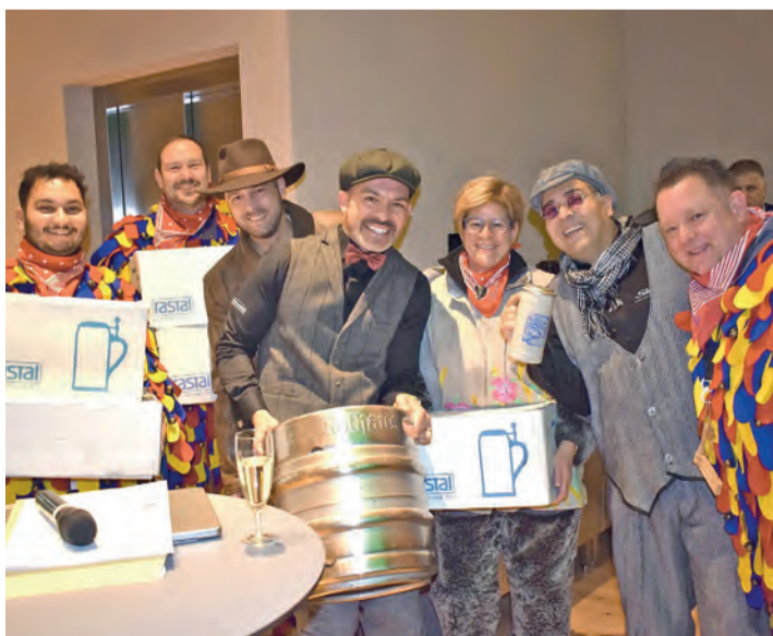
Zum 70. Geburtstag des Fanfarenzugs wurde in der Scheffelhalle ordentlich gefeiert.