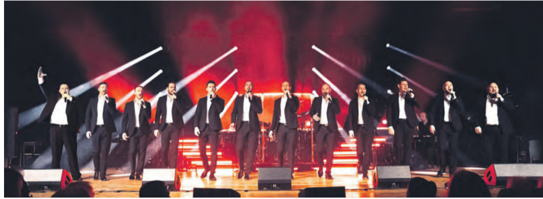
The 12 Tenors – Song of Eternity am Dienstag, den 30. Dezember um 20:00 Uhr in der Stadthalle, Hohgarten 4 in Singen. Begleitet von einer Live-Band und umrahmt von einer spektakulären Lichtshow zelebrieren die 12 Tenöre die Vielseitigkeit der Musik in all ihren Facetten. Weltberühmte Arien treffen auf Rock- und Pophymnen, eine Allianz von charismatischen Stimmen formiert sich zu einem beeindruckenden Ensemble und 12 Top-Solisten verschmelzen in ihrer Virtuosität und Leidenschaft zu einer fulminanten Einheit. Weitere Infos unter www.stadthalle-singen.de

■ Biedermann und die Brandstifter Schauspiel von Max Frisch – »Die Darstellung eines durchschnittlichen Bürgers, der ein etwas schlechtes Gewissen hat ... und der ein gutes haben möchte, ohne irgendetwas zu verändern.« so Max Frisch. Mi., 19:30 Uhr.