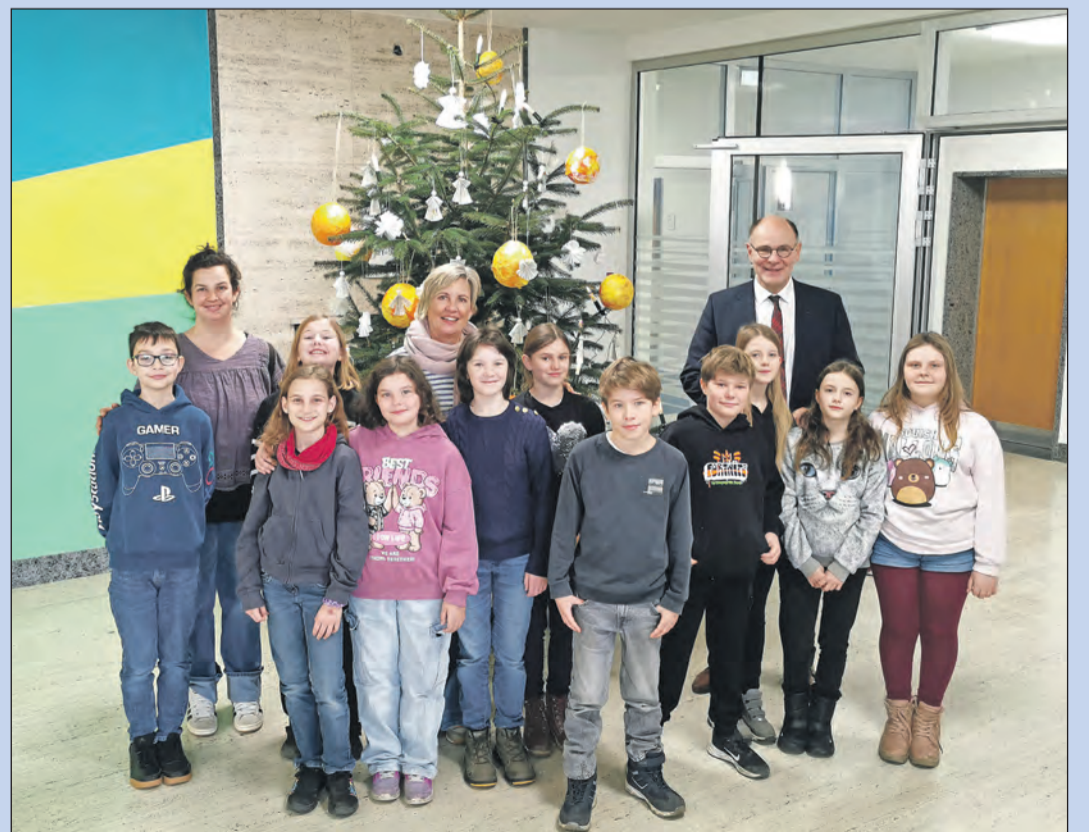
35 Schülerinnen und Schüler der Klassen 2a und 2b der Grundschule Friedingen schmückten den großen Weihnachtsbaum im Foyer des Singener Rathauses (linkes Bild). Den Christbaum im 3. OG des Rathauses dekorierten insgesamt 12 Schülerinnen und Schüler der Klasse 4 der Grundschule Bohlingen (rechtes Bild). Zum Dank für die geschmückten Christbäume lud Oberbürgermeister Bernd Häusler alle Kinder in den Ratssaal ein, wo sie dem Stadtoberhaupt bei Kakao und Gebäck zahlreiche Fragen stellen durften.