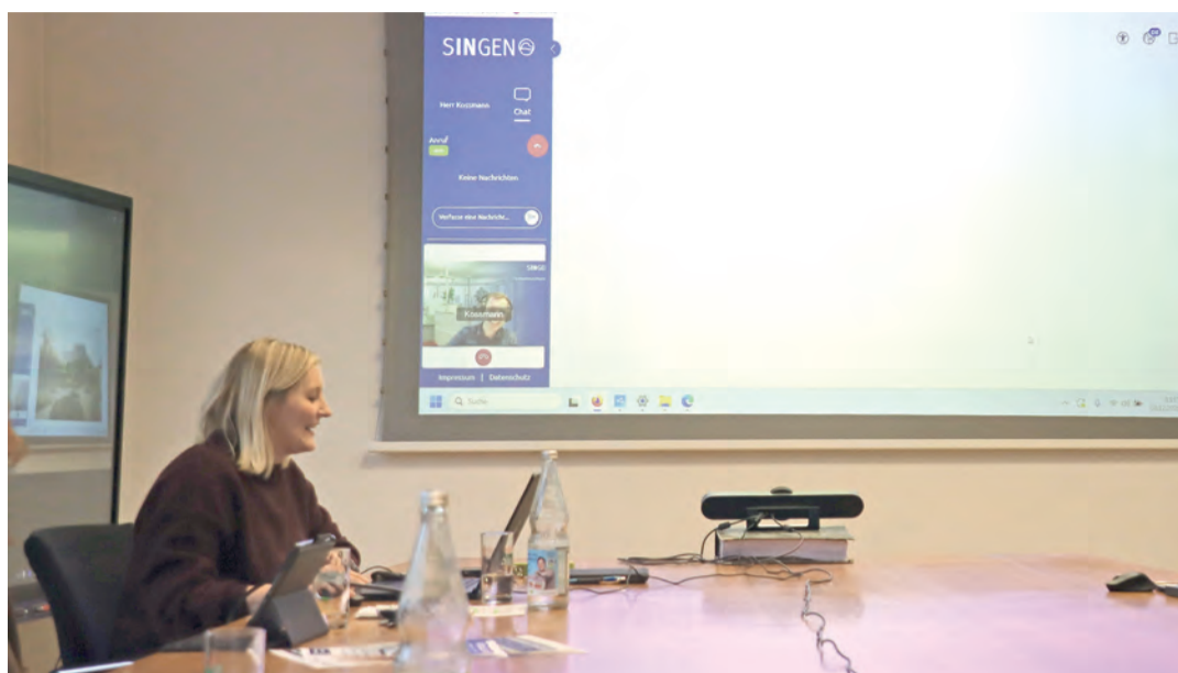
Den Link zum Termin erhält man mit der Bestätigungsmail. So sieht dann der virtuelle Raum aus, wo die Bürger den Termin mit dem zuständigen Sachbearbeiter durchführen können.