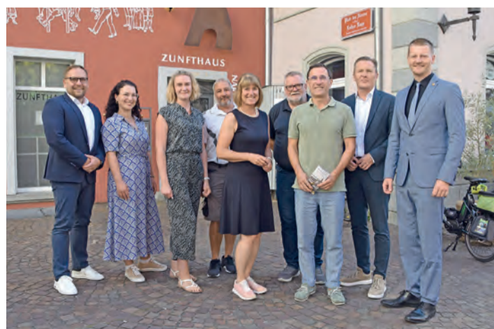
Die Beteiligten freuen sich schon auf viel Musik, Besucher und gute Stimmung beim 47. Radolfzeller Altstadtfest am 6. September.