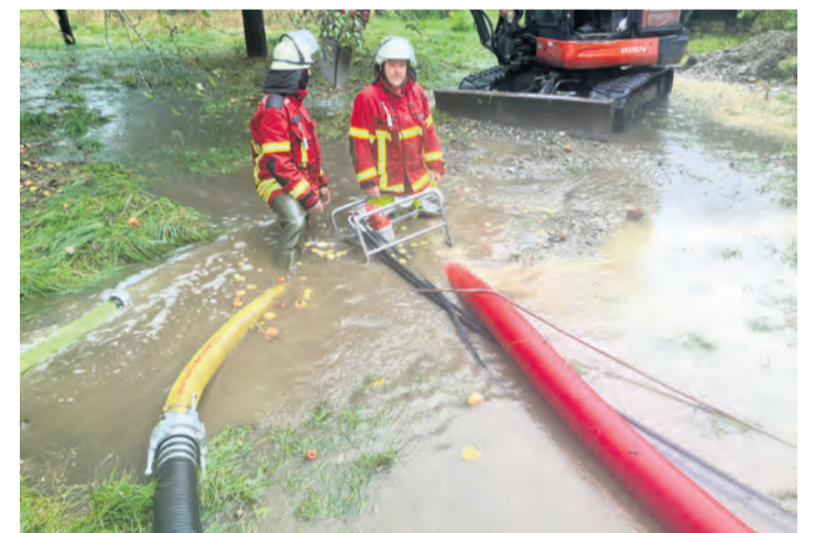
Die Feuerwehr Singen musste auch überschwemmte Wiesen abpumpen, weil die Wassermassen gegen Häuserwände drückten oder drohten einzulaufen.