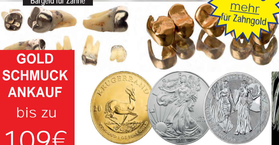
Ankauf von Münzen