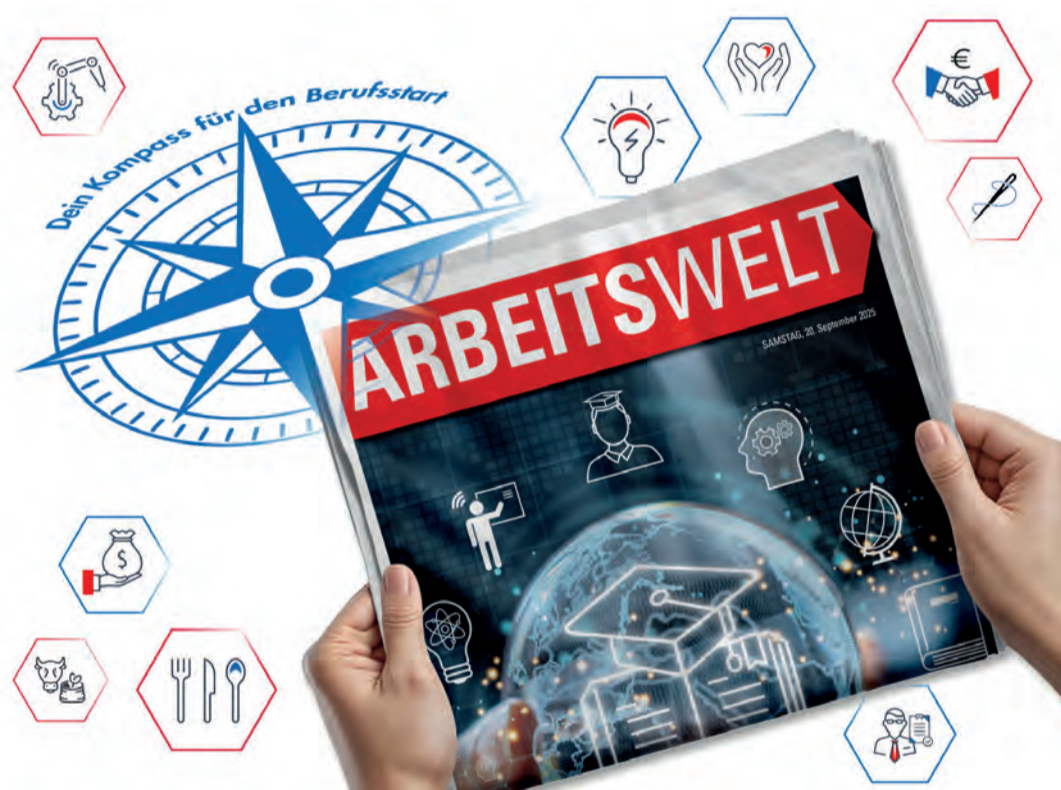
Die heutige Beilage soll für junge Menschen bei der Berufswahl als Orientierung dienen.

fahrungen sammeln und Weichen für die eigene Zukunft stellen.