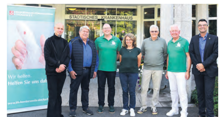
Über eine Spende in Höhe von insgesamt 1.000 Euro durfte sich der Förderverein des Krankenhauses Stockach freuen.