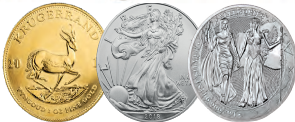
Ankauf von Münzen